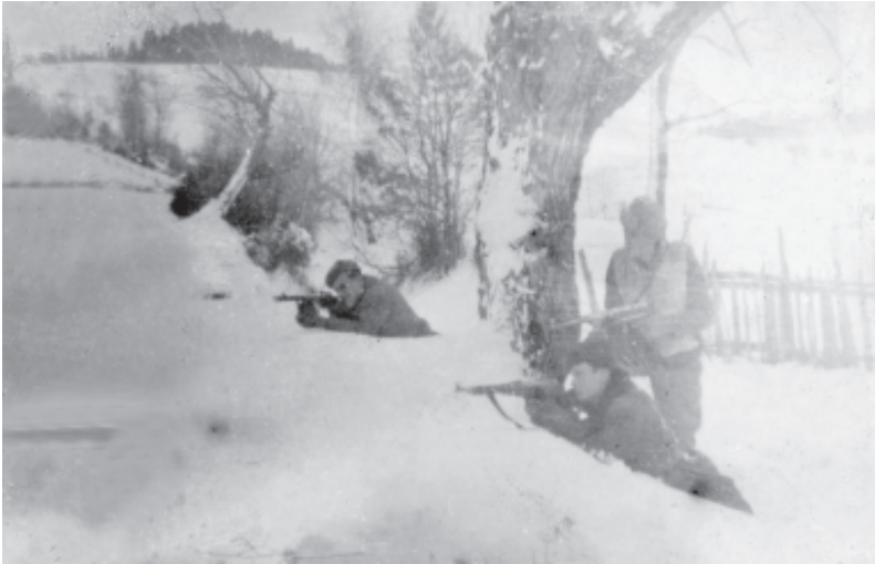
Повстанська стежа в с. Завадка. 15.02.1946 р.