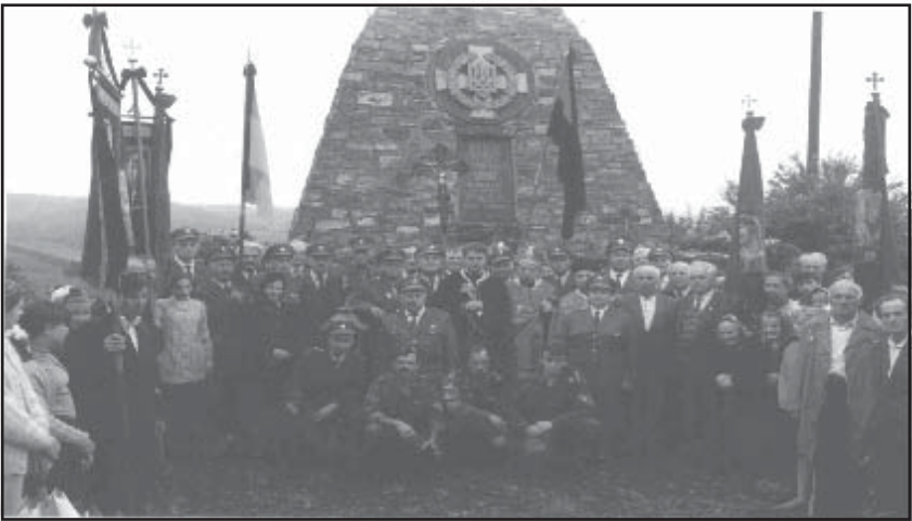
Фрагмент пантеону для перезахоронення останків полеглих повстанців, м. Хирів Старосамбірського району, 1996.