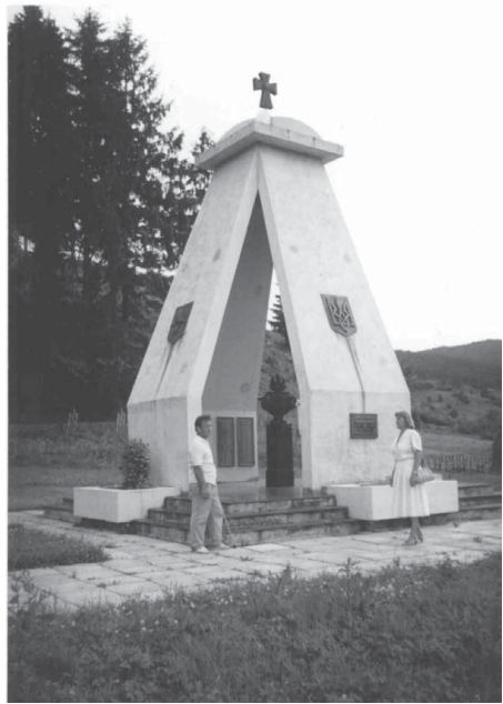
Пам'ятний знак на місці масових захоронень полеглих та закатованих повстанців: Млака, смт. Славське, 1995.