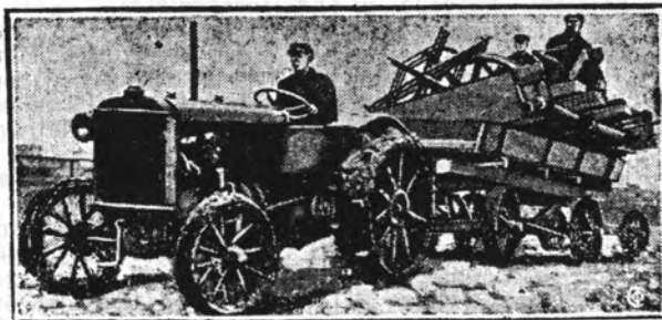
Перевозка складних сільсько-господарських машин