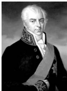
А. К. Разумовский

Уже после 1917 г. эти портреты, вместе с остальными работами, экспропрированными из имения, были распределены в разные государственные музеи страны, в том числе и в Рязанский Художественный музей.