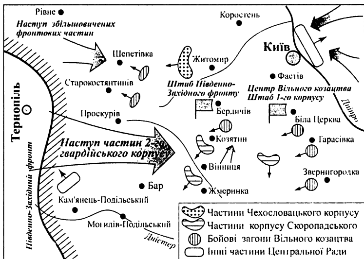
Боротьба армії УНР проти більшовицьких військових частин на Правобережжі України у листопаді—грудні 1917 року

РНК, а в армії — більшовицького головкома Криленка. «Комітетчики» створили у кожній армії місцеві більшовицькі комітети й почали призначати своїх комісарів у всі частини фронту, назначати лояльних до більшовиків командирів. Так, командуючим Особливою армією став збільшовичений генерал В. Єгор'єв, а 11-ю армією — полковник О. Єгоров.