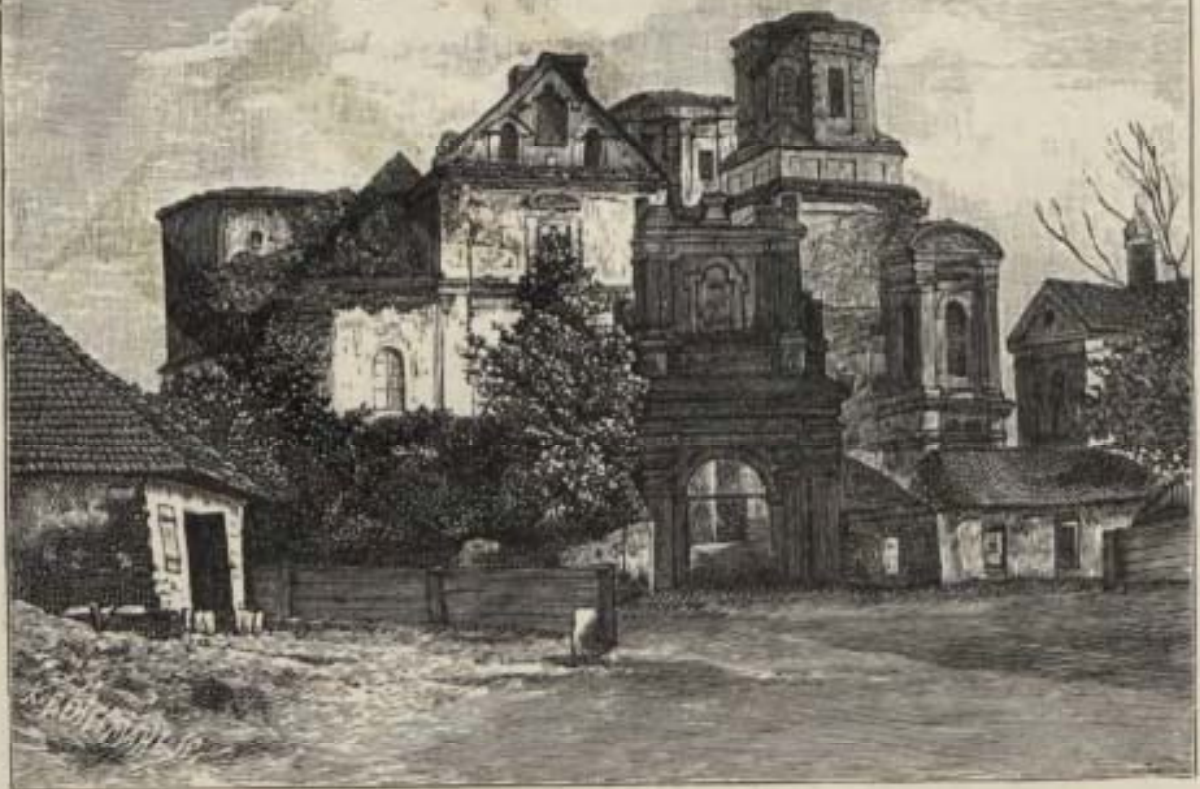
Развалины кафедрального соборнаго Мстиславова храма во имя Успенія Пресвятыя Богородицы: 1) съ западной стороны (фронтонъ) и 2) съ сѣверной стороны.