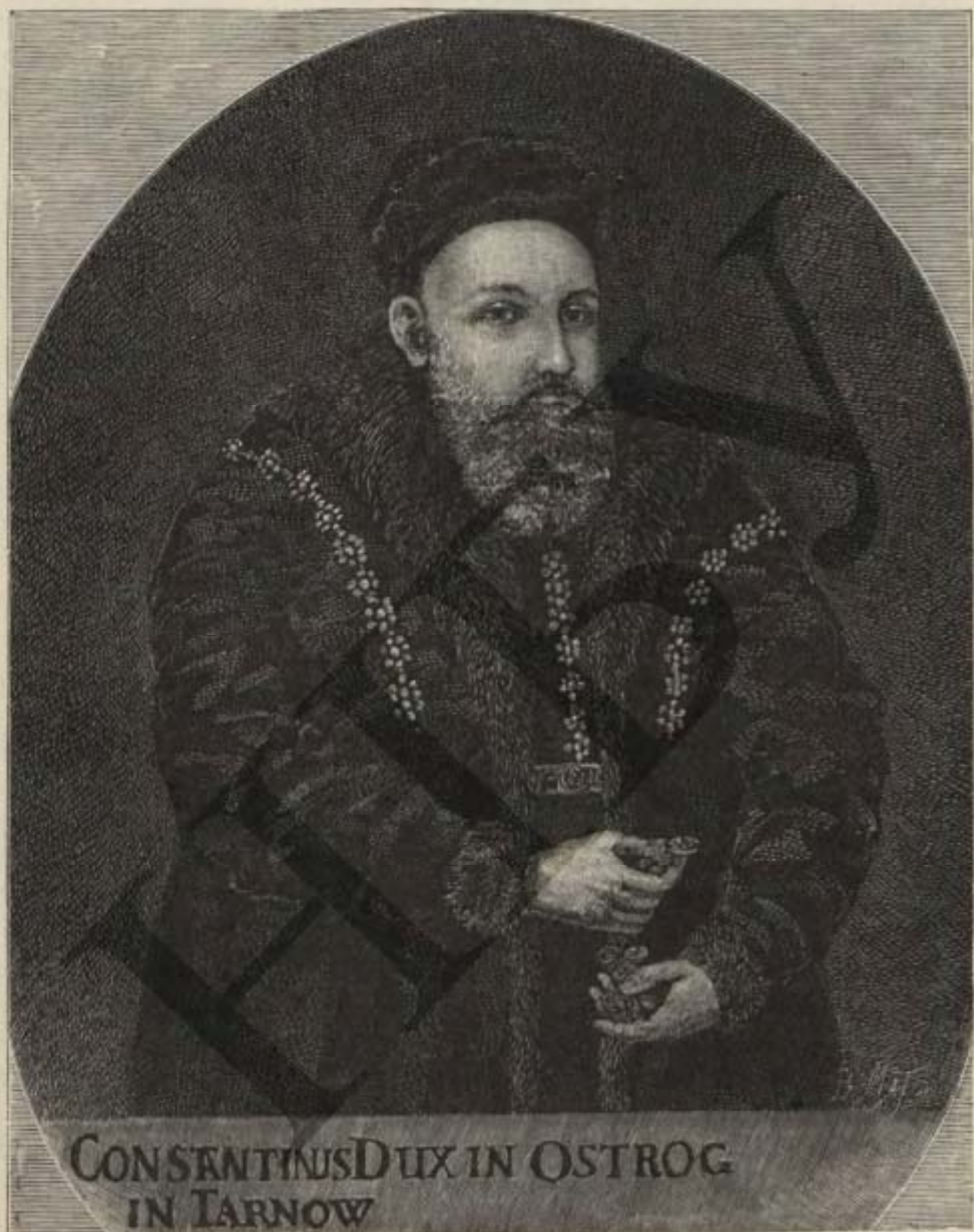
Князь Константинъ Константиновичъ Острожскій, доблестный защитникъ Православной Церкви и русской народности въ Запад- ной Руси.