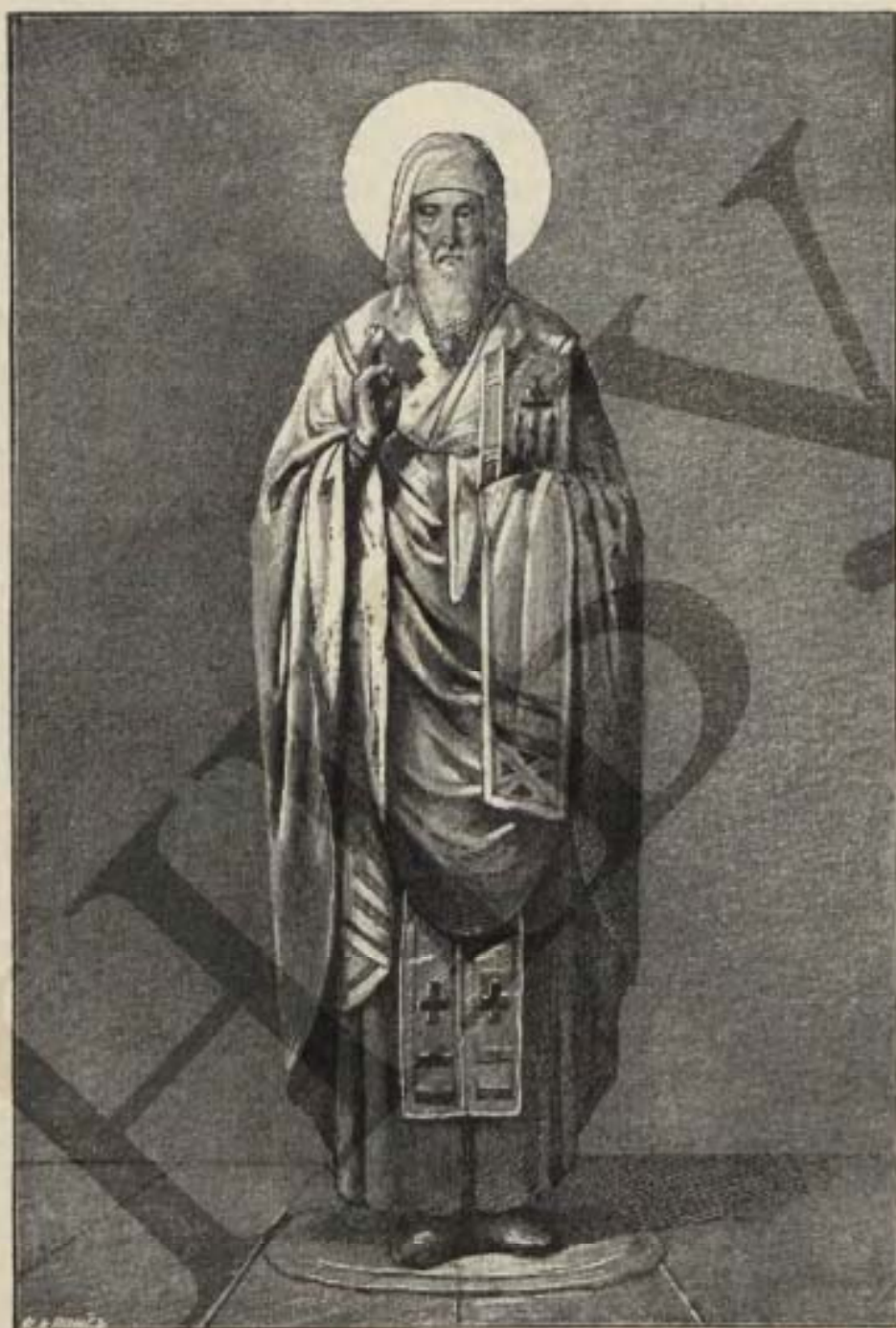
Святой Стефанъ II, Епископъ Владиміро-Волинскій.