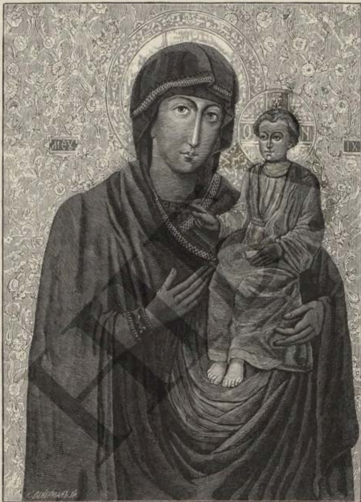
Древняя икона Пресвятой Богоматери изъ Успенскаго Метиславова храма, нынѣ находящаяся, подъ именемъ Братской, въ Николаевской соборной церкви г. Владиміра-Волынска.