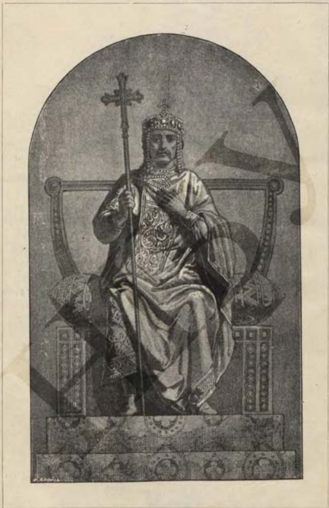
Святой Равноапостольный Великий Князь Владимиръ, просвѣтитель Русской земли и устроитель г. Владиміра Волынскаго.