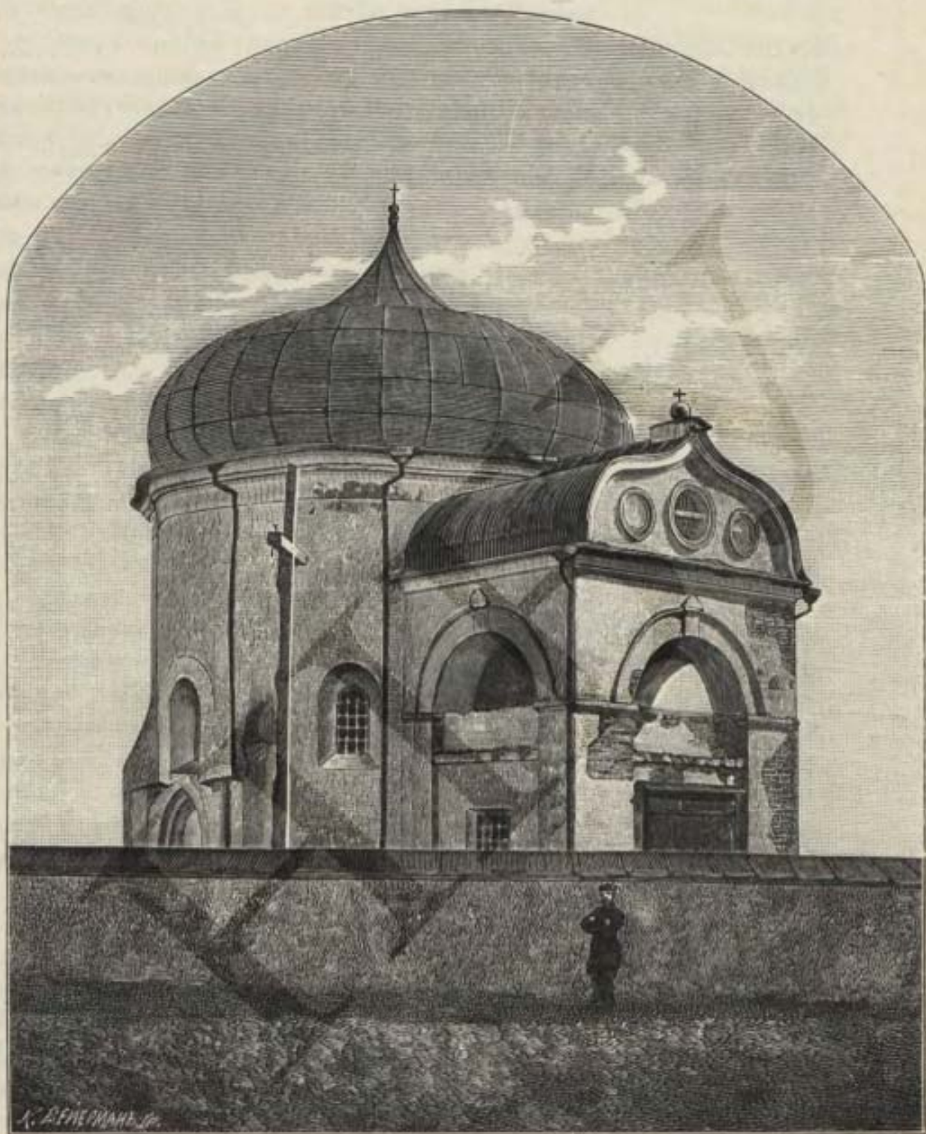
„Обыденная“ церковь во имя Св. Василия, по преданію, построенная Св. Владиміромъ Равноапостольнымъ.