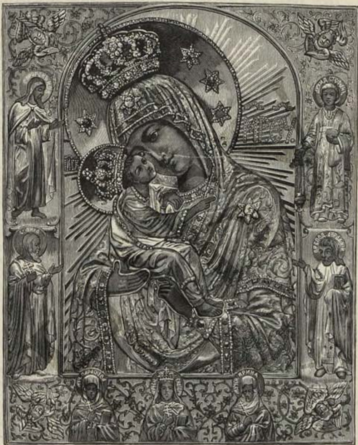
Почаевская чудотворная икона Пресвятой Богородицы.