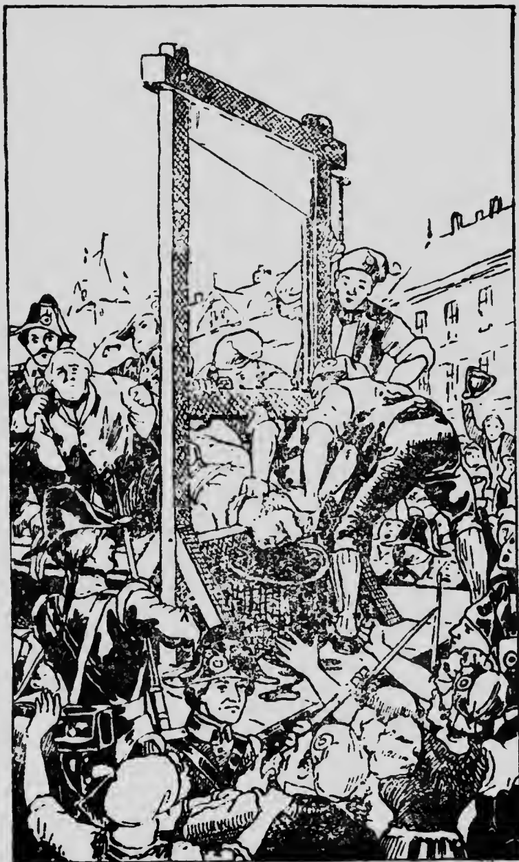
Страчене короля Людовика XVI (21 січня 1793).