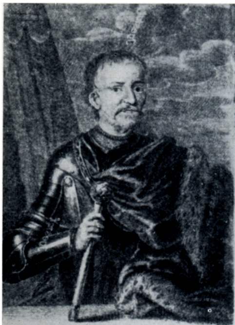
Johannes Muzepa Cesareorum Zaporozienum Supremus Belli Dux.