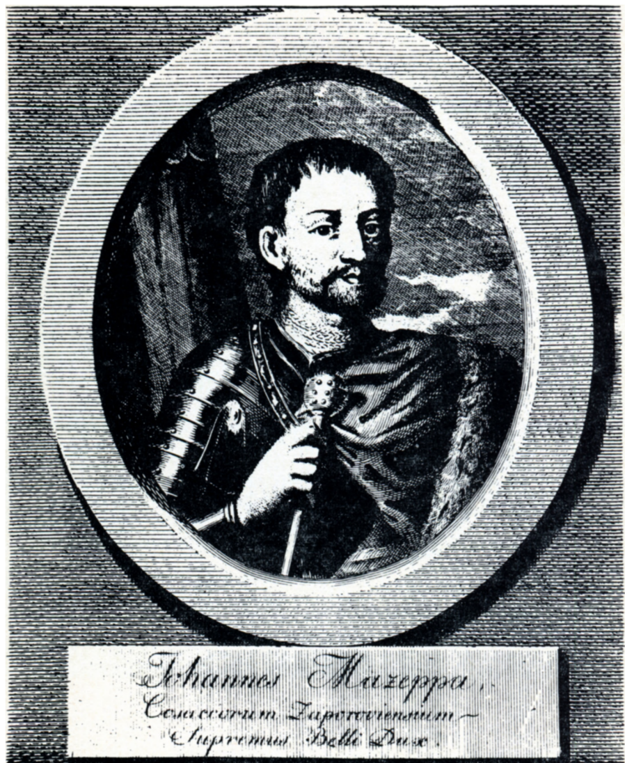
Johannes Mazepa, Cossacorum Zaporoziennum & supremus Belli Dux.

Ann. R. H. 1. Polignac, Transilvania, Unversal, 1679.