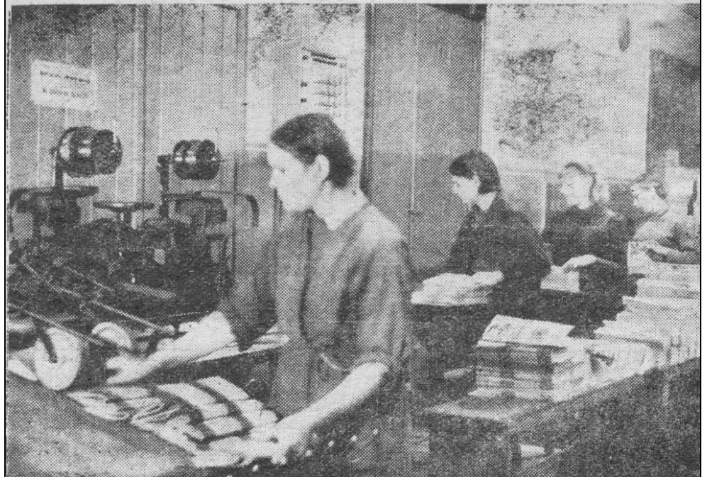
Українці на праці у Німеччині