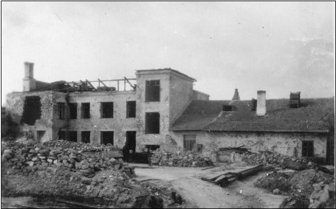
Зруйнований окупантами Херсонський хлібозавод. 1944 р. ДАХО. Фотоальбом № 2 злочинств та руйнувань, заподіяних німецько-фашистськими окупантами у м. Херсоні, арк. 11, фото № 21.