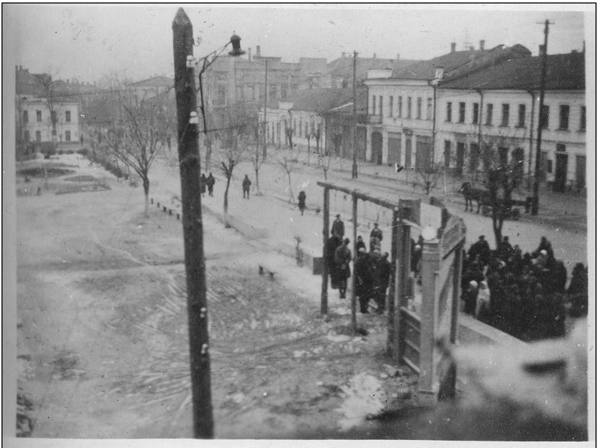
Страта радянських громадян на головній вулиці м. Херсона. 1942 р. ДАХО. Фотоальбом № 2 злочинств та руйнувань, заподіяних німецько-фашистськими окупантами у м. Херсоні, арк. 7, фото № 13.

ДАХО, ф. Р – 1479, оп. 1, спр. 162, арк. 1, 1 зв., 2, 2 зв.