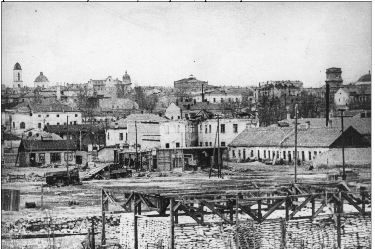
Загальний вигляд м. Херсона після визволення від окупації. 20 березня 1944 р.