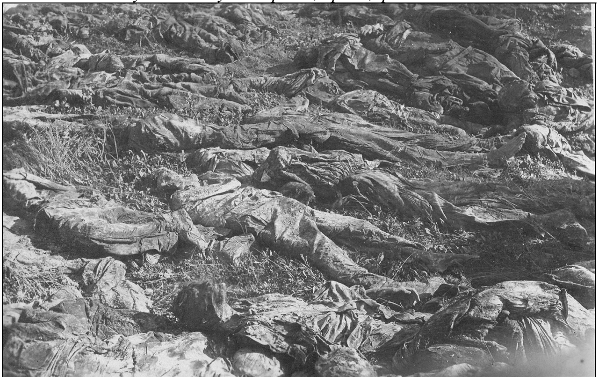
Трупи розстріляних нацистами громадян м. Херсона. Виявлені при розкопуванні протитанкового рову біля с. Зеленівка в 1944 р.