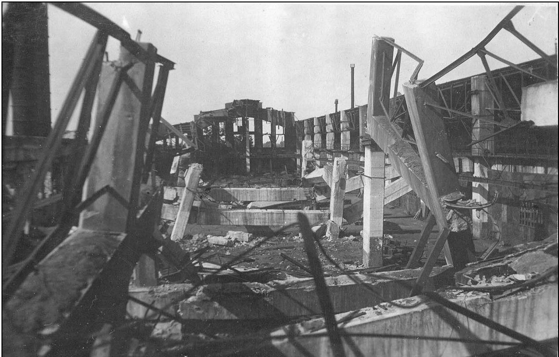
Зруйнований ливарний цех Херсонського заводу сільськогосподарського машинобудування ім. Петровського. 1944 р.