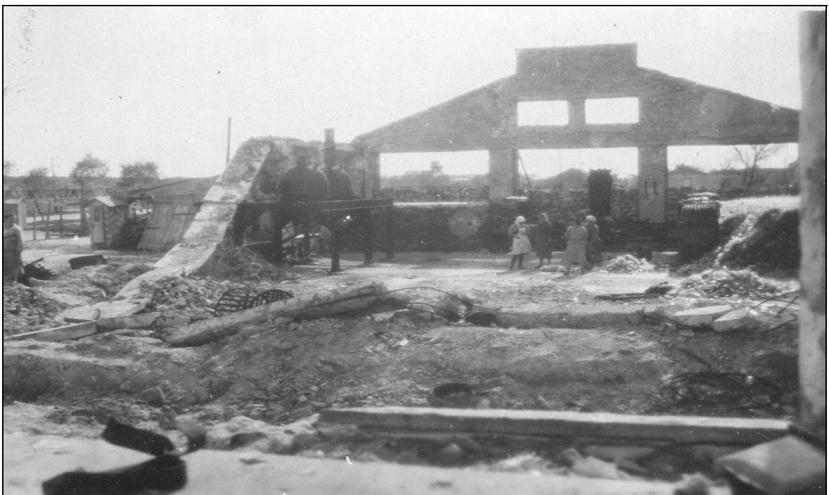
Вигляд одного з цехів судозаводу ім. Комінтерну. 1944 р.