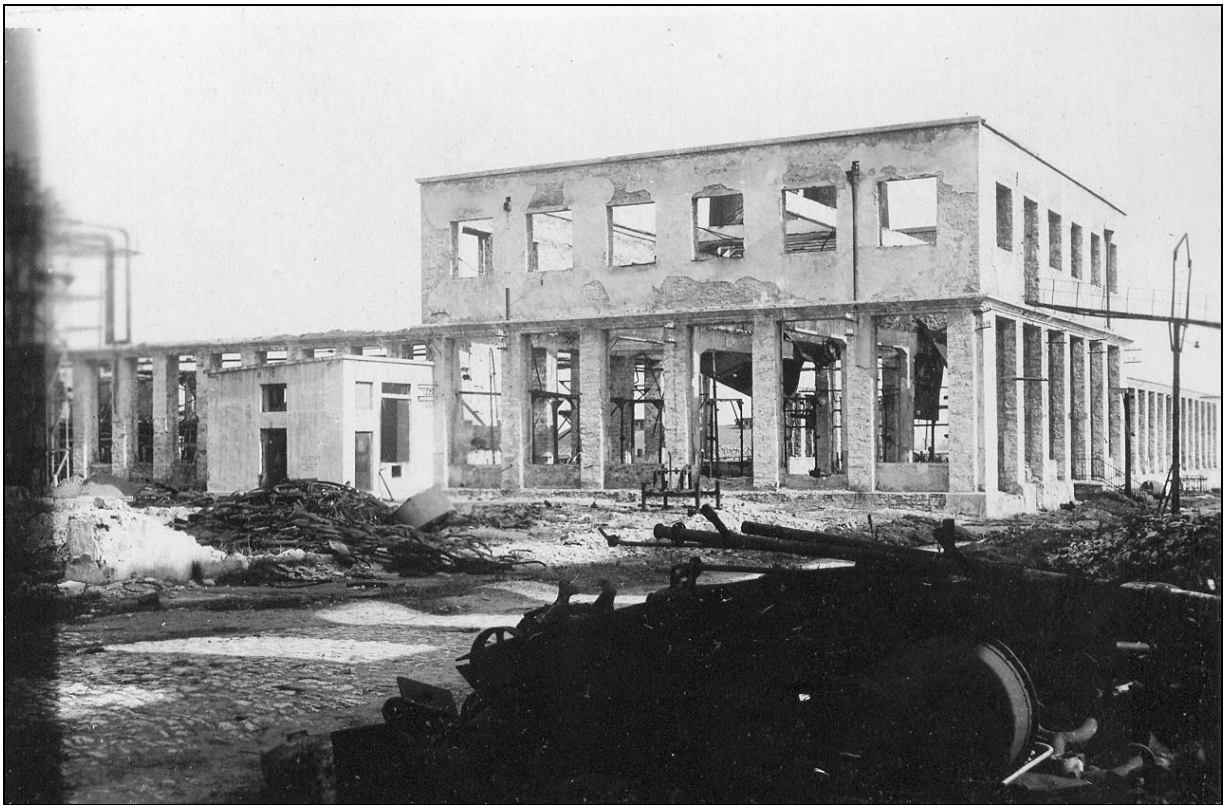
Зруйнований цех консервного заводу ім. 8-го Березня. 1944 р. ДАХО. Фотоальбом № 2 злочинств та руйнувань, заподіяних німецько-фашистськими окупантами у м. Херсоні, арк. 19, фото № 37.