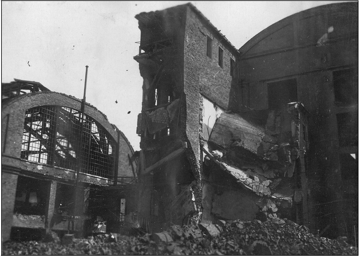
Підірваний та спалений німецькими окупантами Херсонський завод склотари. 1944 р.

ДАХО. Фотоальбом № 2 злочинств та руйнувань, заподіяних німецько-фашистськими окупантами у м. Херсоні, арк. 22, фото № 43.