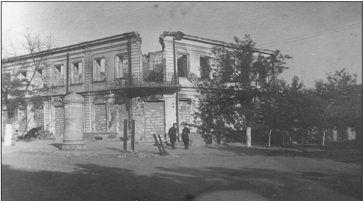
Зруйнована будівля друкарні ім. Леніна у м. Херсоні. 1944 р.

ДАХО. Фотоальбом № 2 злочинств та руйнувань, заподіяних німецько-фашистськими окупантами у м. Херсоні, арк. 22, фото № 43.