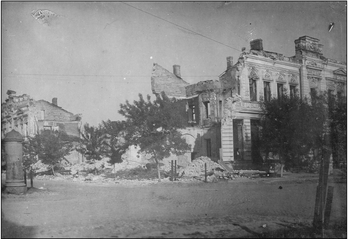
Один із зруйнованих житлових будинків м. Херсона. 1944 р.