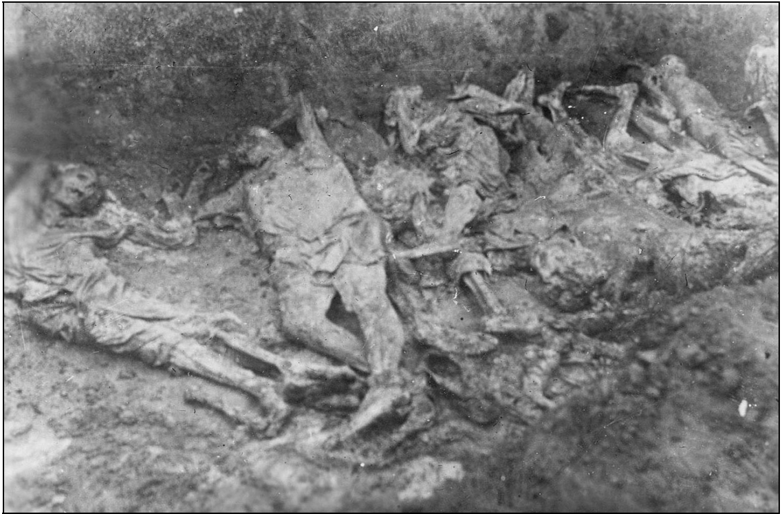
Місце масового захоронення жертв нацистських окупантів у Великолепетиському районі. Дослідження могил здійснено в 1944 р. ДАХО. Фотоальбом № 2 злочинств та руйнувань, заподіяних німецько-фашистськими окупантами у м. Херсоні, арк. 5, фото № 10.