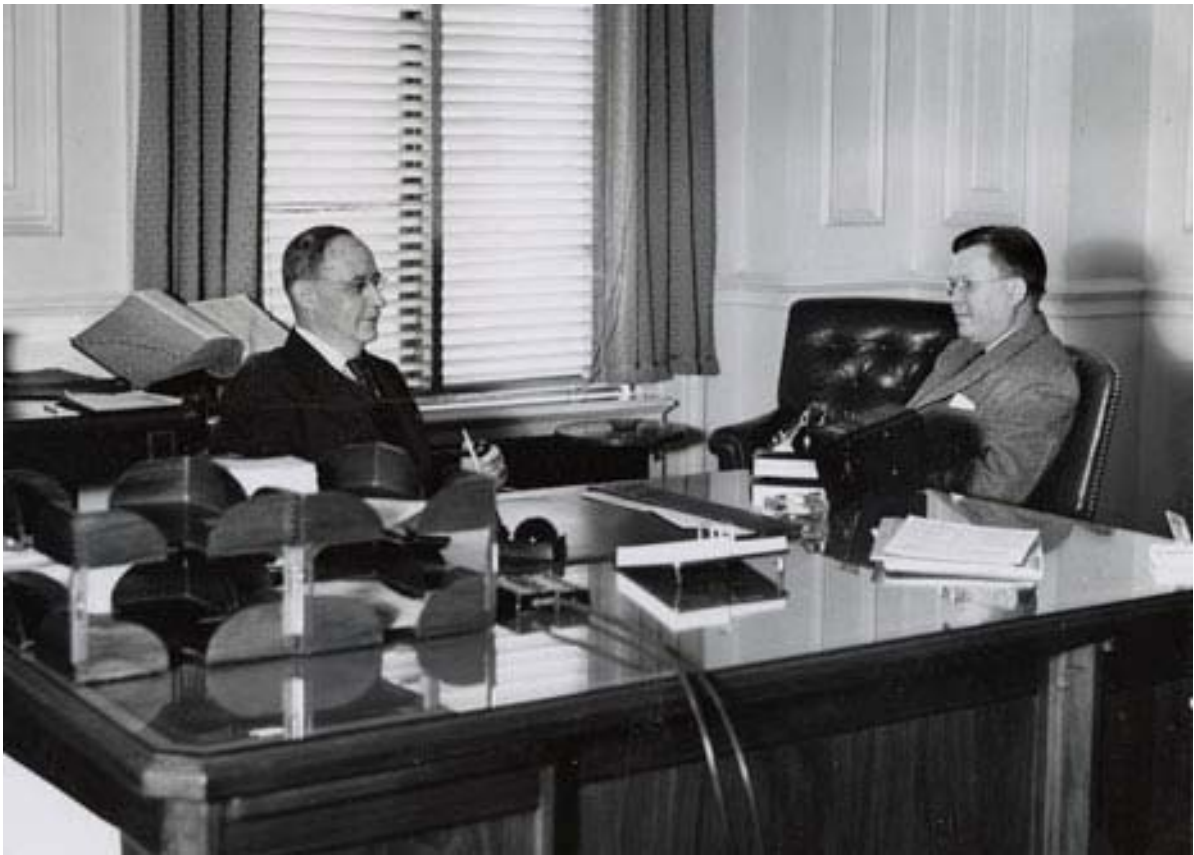
Фото. 2-й Архівіст США С. Дж. Бакк (зліва) та 3-й Архівіст США У. К. Гровер (з права), 20 травня 1948 р. [27]

З огляду на внесені пропозиції Комісія 12 квітня 1948 р. підписала угоду з Е. Ліхі та Національною радою з управління документацією про вивчення проблеми управління документацією у федеральному урядові. У звіті Ліхі від 14 жовтня 1948 р., представленому на розгляд Комісії, обсяг документів федеральних відомств був оцінений у 18,5 млн. куб. футів, а щорічні витрати на їх зберігання у 1,2 трлн. дол. Ліхі рекомендував створити Федеральну адміністрацію документації, інкорпорувати до її складу Національний архів та усі репозиторії, що зберігали непоточні документи федерального уряду, видати закон для регулювання процедур утворення, зберігання, управління і знищення документів, у кожному департаменті призначити особу, відповідальну за управління документацією, розробити і впровадити відповідні стандарти і правила.