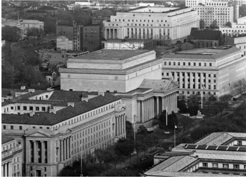
Фото Будинок Національного архіву (в центрі фото), 1951 р. [32].

У грудні 1949 р. у структурі NARS був створений Відділ з управління документацією (Records Management Division), 1950 р. Конгрес прийняв Закон про федеральні документи «Federal Records Act» (PL 754, 81 st Congress), у кожному федеральному відомстві були впроваджені програми управління документацією, згодом відкриті федеральні центри документації для зберігання не поточних документів федеральних агенцій. На 30 червня 1954 р. 95 % федеральних департаментів прозвітували про розроблення і впровадження конкретних переліків документів, утворюваних в їх відомствах зі строками зберігання і встановленими процедурами виділення нецінних документів до знищення [33].