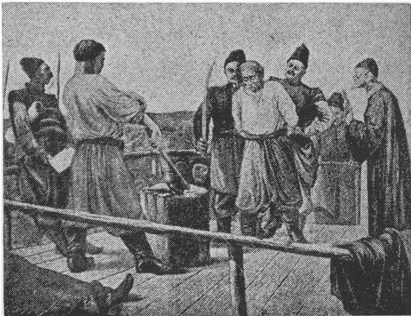
Кочубея карують на смерть (Цікаво, що про це немає згадки в тексті. Прим. В-ва).

Московський уряд побачив, що перебавив трохи у своєму поспіхові. Він вирішив, з одного боку, відступити Правобережжя Польщі, щоб легше справитися з старшиною на Лівобережжі, і одночасно повів широку пропаганду проти козацької знаті. Наслідком тієї агітації була, як уже знаємо, ніженська «чорна рада» та обрання Брюховецького гетьманом; разом з тим стався розділ Гетьманщини в 1663 рр., бо на Правобережжі почав гетьманувати старшинський кандидат Тетеря, що був одним з авторів Гадяцьких пактів. Москва й ствердила цей розділ Андрусівським перемир'ям з Польщею, залишаючи на цей раз Правобережжя під зверхністю Польщі.