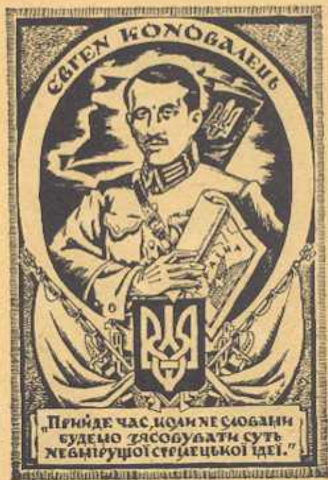
Голова ПУН полк. ЄВГЕН КОНОВАЛЕЦЬ згинув від вибуху большевицької бомби у Роттердамі дня 23. V. 1938 р.

Чи була їх смерть даремна? Навіть крайній матеріаліст заперечить таке питання. Кров, пролита ними в обороні рідного краю, містичним способом запричастила їхніх нащадків до нової священної служби справі, за яку вони згинули. Чиж не в цьому криється незбагнена таємниця нашого постійного національного відродження, нашого постійного прагнення до свободи і врешті героїзму нашого народу?