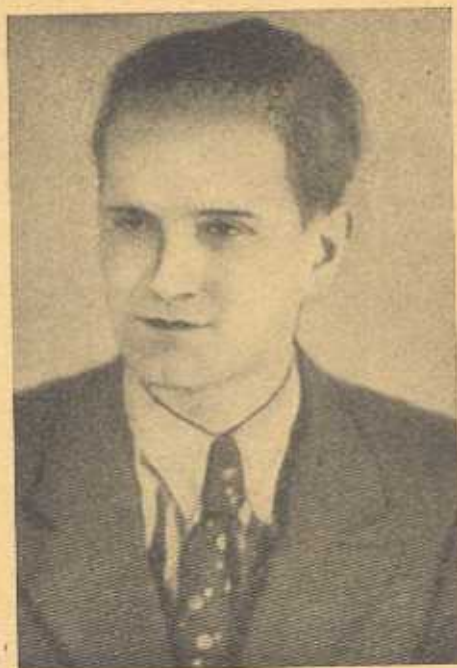
ЗЕВОН КОССАК-ТАРНАВСЬКИЙ згинув у боротьбі за Карпатську Україну.

Ідімо до могил у Парижі і Роттердамі і черпаймо над ними нову духову силу і світло розуму, щоб не заблудити нам на небезпечних мандрівках еміграційного побуту. Шу-