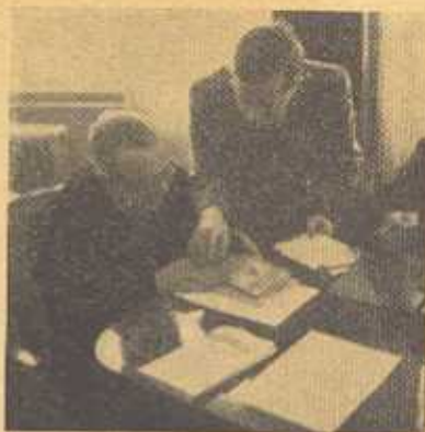
Президент Карпатської України о. А. Волошин у розмові зі своїм секретарем І. Рогачем.

змагань за право українського народу бути паном на власній землі. Ніякі перешкоди не стримують їх.