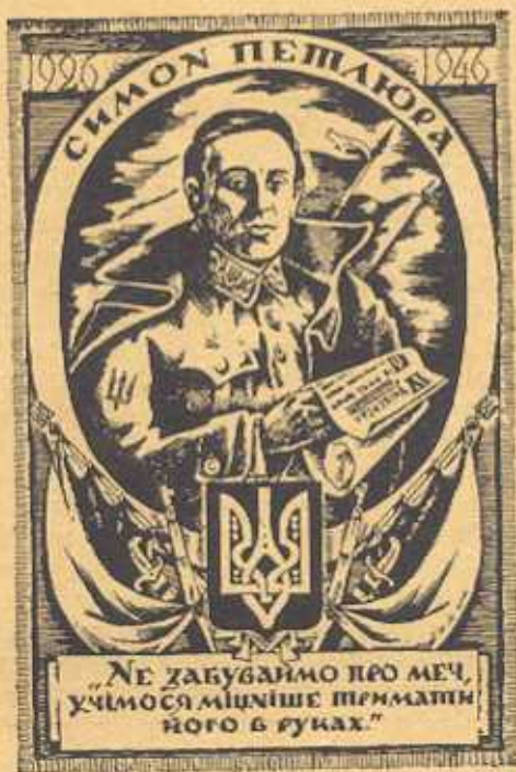
Головний Отаман СИМОН ПЕТЛЮРА убитий більшовицьким агентом у Парижі дня 25. V. 1926 р.

не вдовоїлася... Кому ця кістка належала — ніхто не розгадає. Чи був це княжий дружинник, що ганяв по степах половців і захищав кордони княжої України перед хижими зазіханнями сусідів? Чи козак це запорожець, що згинув, визволяючи бранців з неволі татарської? Чи повстанець Хмельницького, що помагав будувати відроджену українську державу? Чи може один з тих, що помагали