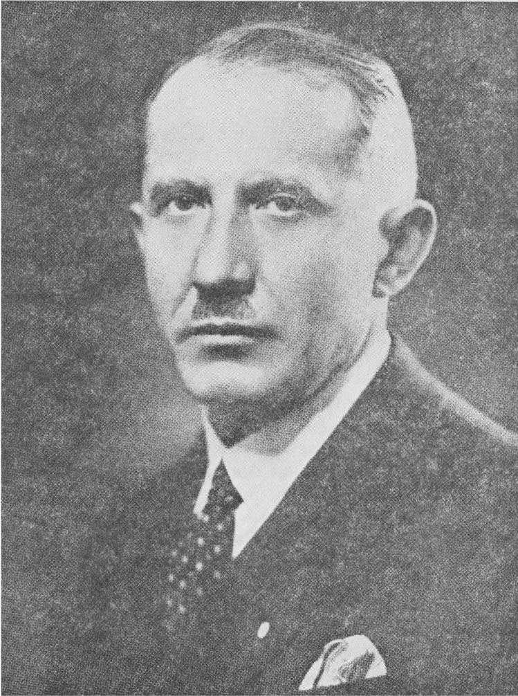
Євген Коновалець Основоположник Організації Українських Націоналістів