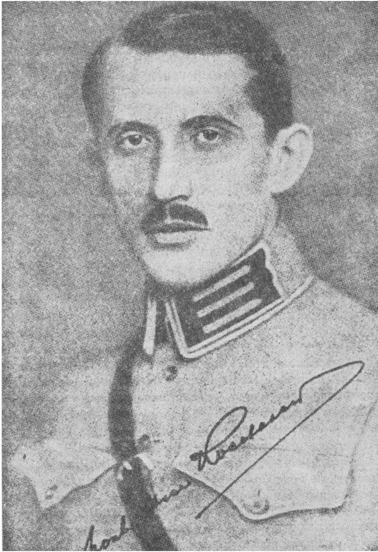
Євген Коновалець Командир Корпусу Січових Стрільців