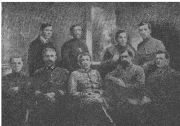
Команда Січових Стрільців. В середині сидить Полк. Євген Коновалець, по його правій руці Полк. Андрій Мельник, по лівій руці Полк. Роман Сушко.

В лютому 1918 р. Галицько-Буковинський курінь іде в авангарді наступу на ворога і звільняє від нього столицю, щоб уже в березні перетворитися у Полк Січових Стрільців, першу соборницьку військову формацію, якій, завдяки особам її командирів, судилося відограти першорядну роль у українській збройній боротьбі й політичній історії.