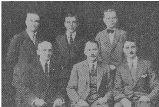
Полк. Євген Коновалець найдовше побував у Вінніпегу під час своєї поїздки по Канаді в 1929 р. На світлині Він між провідними членами Української Стрілецької Громади у Вінніпегу.

Змагання розгортаються одночасно на всіх фронтах. Сам провідник іде до Півн. Америки, щоб створити там політичний резонатор і фінансову базу для революційної акції (квітень-липень 1929 р.). Протягом наступних років здобувається для руху Канаду, потім решту європейської еміграції та Південну Америку.