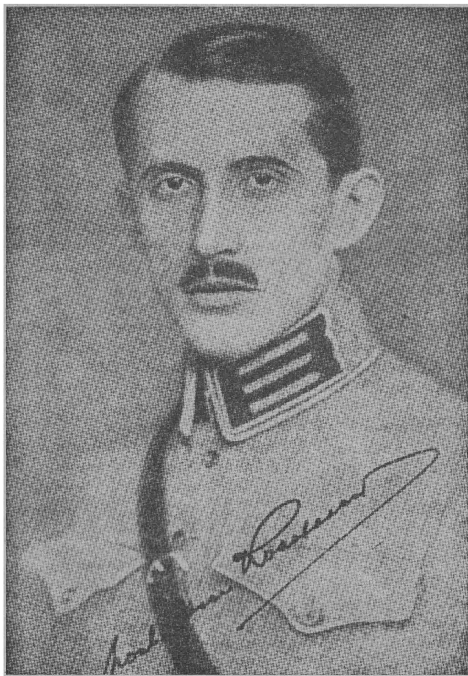
Полковник Евген Коновалець (* 14. VI. 1891 — † 23. V. 1938)