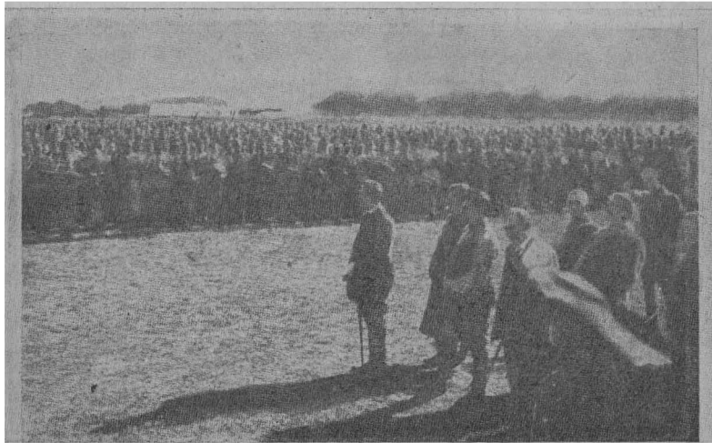
Присяга у Вишколі Січових Стрільців в приві Головного Отамана С. Петлюри, за яким з-права стоїть Полк. Є. Коновалець. (Староконстантинів, літо 1919 р.)

Делегація Галицької Національної Ради жадала саме в листопаді, щоб Січових Стрільців послано на Захід боронити Львова від поляків. Командири Січових Стрільців стали перед важкою дилемою. Заслугою їх, одначе, 12. XI. в Білій Церкві Стрільська Рада остаточно ухвалила не йти на Львів, а ждати на повстання. Гострий зір Євгена Коно-