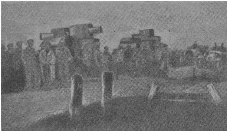
Манцерні авта „Отаман Коновалець” і „Отаман Мельник” Автопанцерного Дивізіона Січових Стрільців.

Командирам Січових Стрільців Директорія надає генеральські ранги, які вони відхиляють. Висувається плян тріумвірату: Симон Петлюра — Євген Коновалець — Андрій Мельник, одначе військовики хочуть лишитись самі собою. Євген Коновалець віддається розбудові Корпусу, пізніше Дивізії Січових Стрільців, за короткий час роблячи з неї зразкову, дисципліновану військову одиницю.