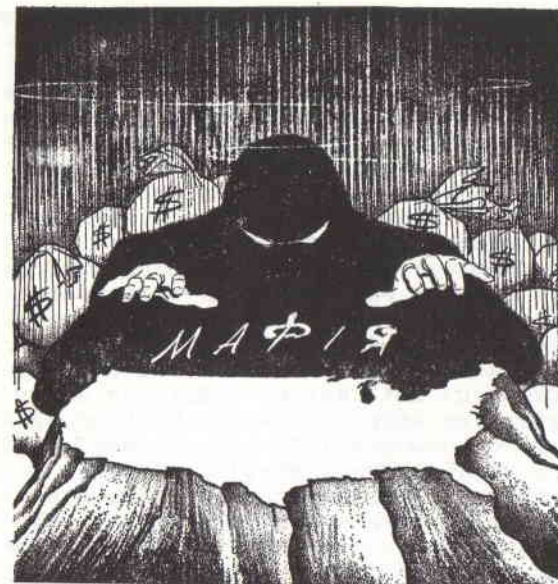
Над Америкою простягнула свої лапиша темна мафія, за якою стоять капітали

черепки. Роблячи це, вони лише точка за точкою виконують вже давно накреслені свої пляни, згідно з якими комунізм має бути лише переходною стадією на шляху до повного підкорення собі світу. А поки він триває, він виконує роботу в їхньому інтересі: винищує фізично та збиває духово народи, нищить серед них усе, що є сильне, відважне, здібне до спротиву насилля, збиває всякий ідеалізм, нівечить духовість, віру в Бога, гідність людини як твору Божого, а зводить її до становища покірного раба, без власної волі, без принципів, який без найменшого спротиву та де "ентузійстично" прийме всяку тиранію. Комуністичний режим, захоплення якнайбільше народів у сильця цього режиму, нищення окремішності поміж поодинокими народами, касування кордонів і т.п. -- це вимріяний якраз ґрунт для експериментів тих темних сил, тієї мафії міжнародних заговорників. Ось чому вона -- оця мафія є така прокомуністична, така промосковська чи як треба, прокастровська, протитовська і навіть прокитайська, а така проти-українська і так сильно поборює анти-комуністів і патріотів усіх народів, які є