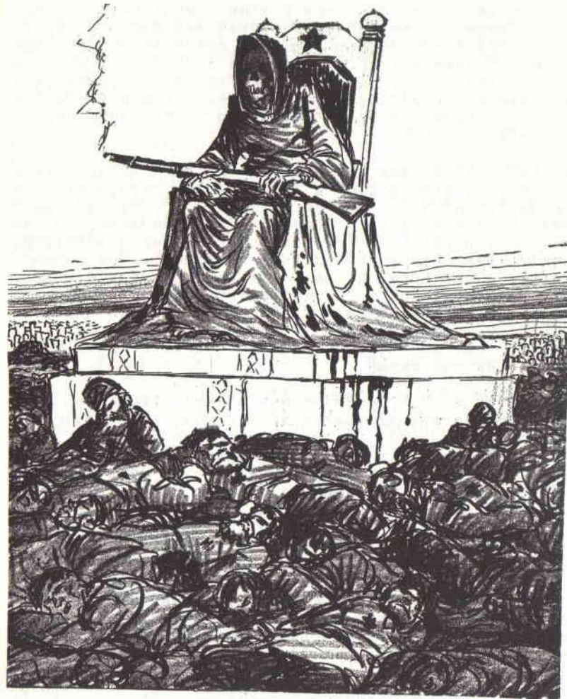
Смерть, терор, насилля -- ось на чому спирається влада в ССРСР.

Розтрубляє також ця пропаганда, що в Советському Союзі є повна свобода слова, преси і свобода релігії