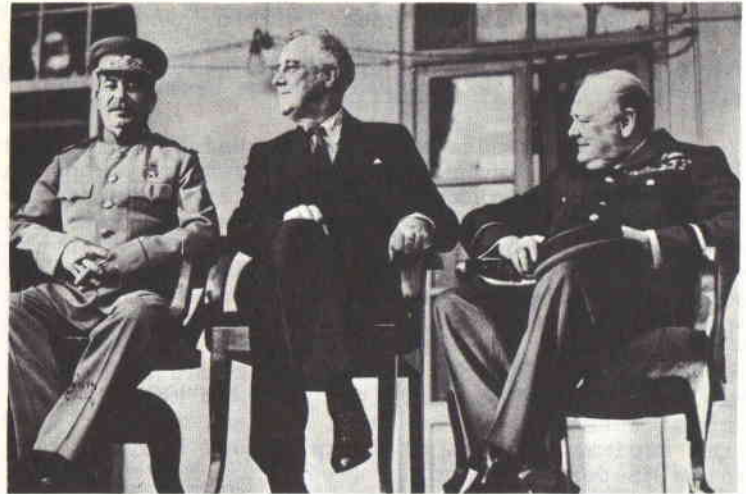
Рузвельт (посередині) і його "друг" Йосиф Сталін та В. Черчіл після ганебного договору в Ялті, де запродано в комуністичну неволю мільйони людей.

Що так воно є, можна подати багато прикладів. Ось візьмімо лише т.зв. "Кубинську Проблему". Коли б це залежало від американського народу, то оцього пістряка на американському тілі можна було б давно зліквідувати, коли б не оці "дорадники" і маючі вплив на громадську опінію через газети, радіо і телевізію Від самих початків постання і зросту кубинської комуністичної партії в ЗДА, які вмовляли всіми доступними їм способами, що "Куба маленька і від неї ніякої небезпеки для ЗДА не може бути." Але чема найменшого сумніву, що ця небезпека таки є, бо не в Кубі справа але в тому, хто і з яких причин стоїть за Кубою.