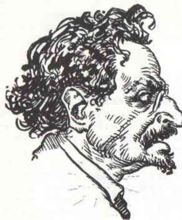
Лейба Бронштайн Троцький

Війна Росії з Японією в 1905 році мала послужити міжнародній зграї комуністів-марксистів під жидівською рукою нагодою для випробування своїх сил в російській державі. За жидівські гроші, що в більшості походило з кишені Якуба Г. Шіффа, нью Йоркського банкіра, поведено сильну агітацію між російським воєнством на японському фронті. Програна Росії в тій війні мала послужити ще більшим підйомом для бунту і загального повстання, революції, яку підготовлювано внаслідок Росії, а зокрема в Петербурзі. На день 22 січня 1905 жидівські агітатори та деякі москалі, що були під революційними впливами писань і кличів Леніна, пішли походом на царську палату, домагаючись таких радикальних реформ, що коли вони були б прийняті, Росія уже була б вступила на "шлях соціалізму". Коли речник