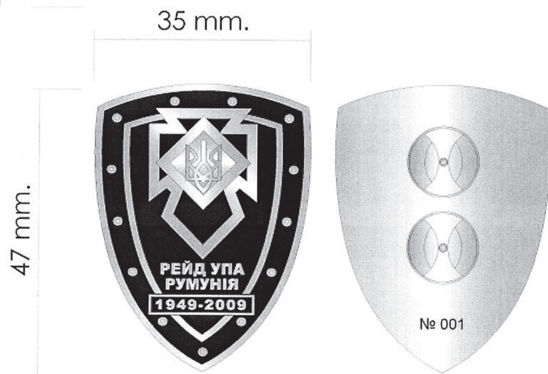
Загальний вигляд пам'ятної відзнаки