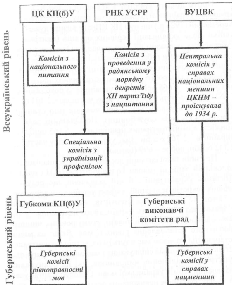
Схема 1. Система комісій партійних і державних органів, які 1923–1924 рр. відповідали за здійснення політики українізації.