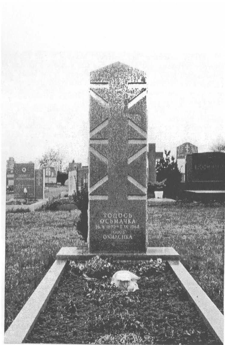
Могила Теодосія Осьмачки на українському цвинтарі в Бавнд Брук, США