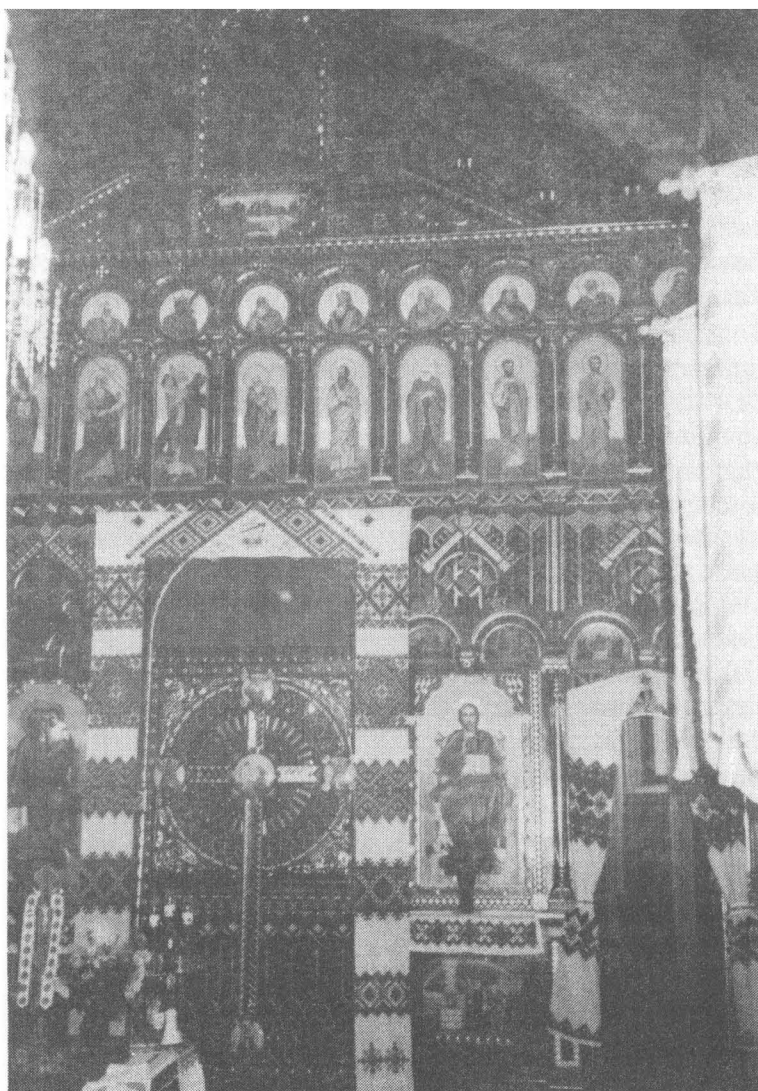
Іконостас церкви св. Покрови в Оріхівці.