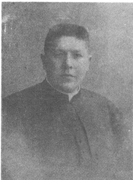
О. прелат Леонтий Куницький Довголітній парох Архикатедри св. Юра у Львові. 1876 — 1961