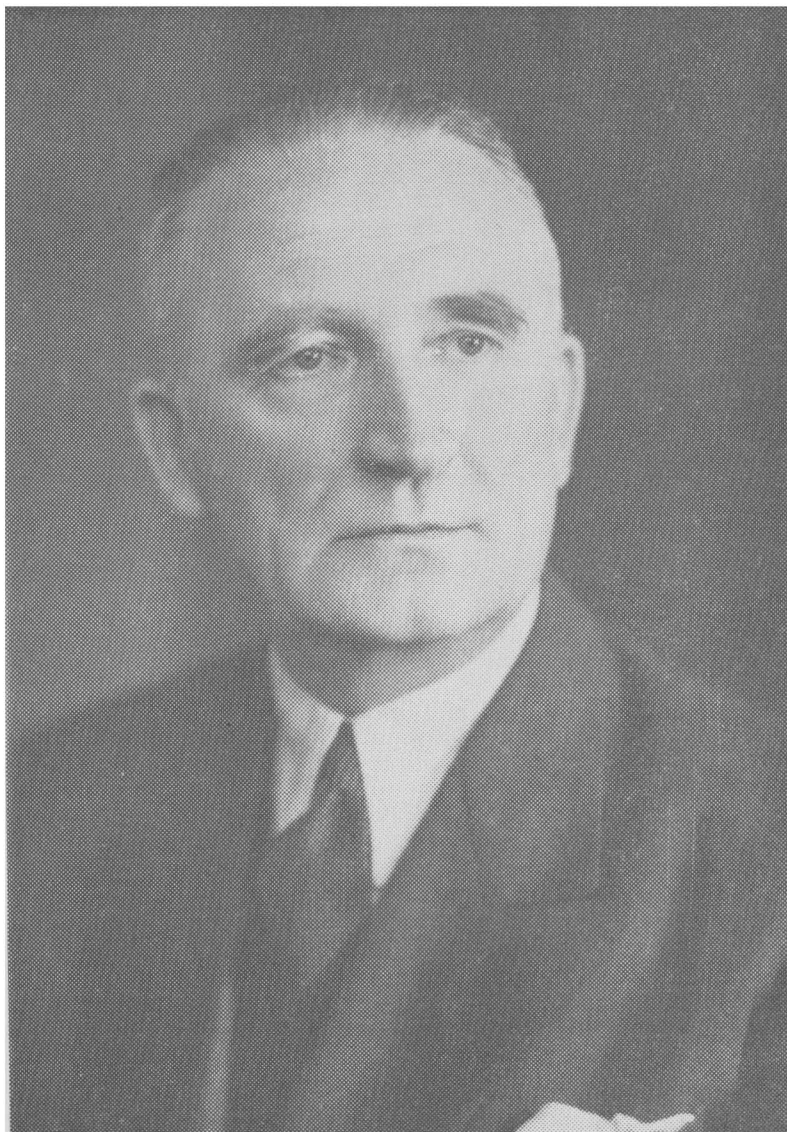
... Полковник Андрій Мельник ...