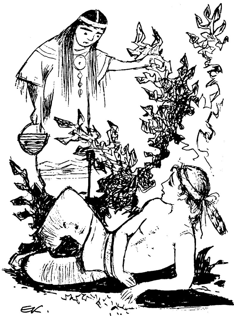
Перед нами стояла Наби...