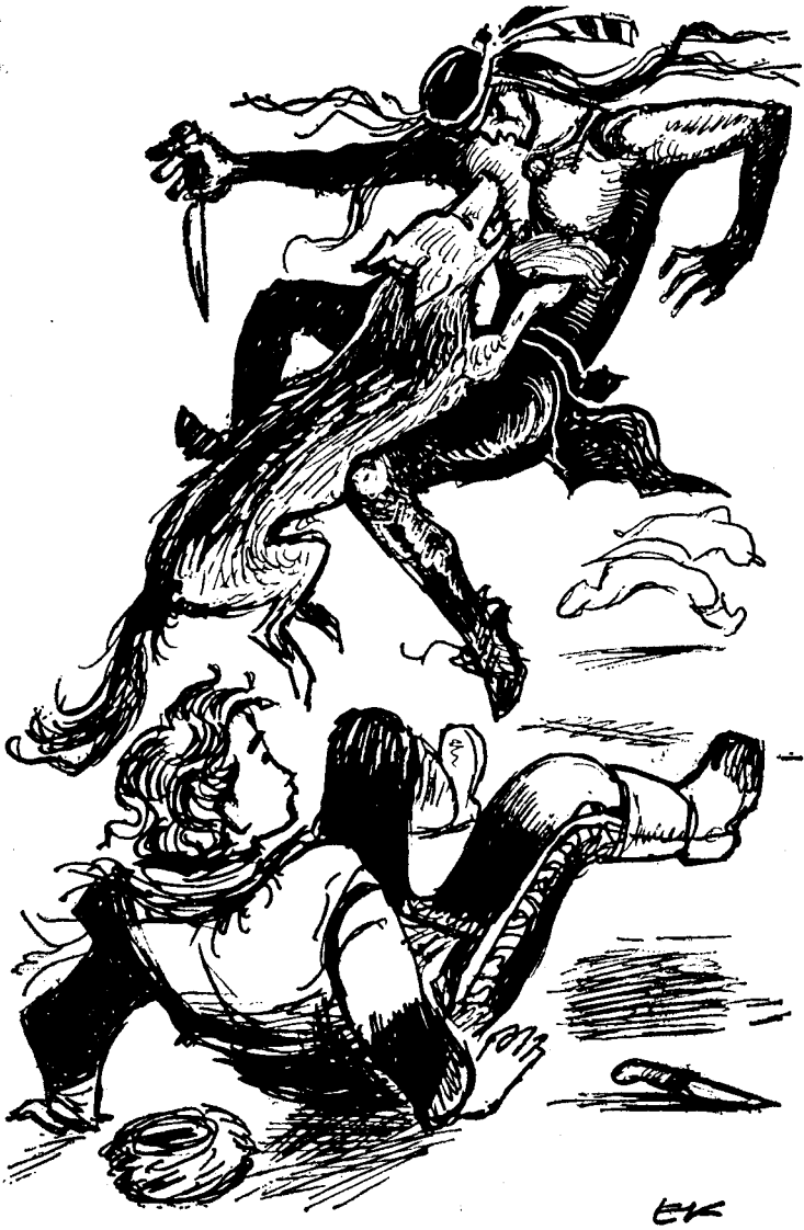
Нараз зі страшним гаркотом все кинувся на індіанця.