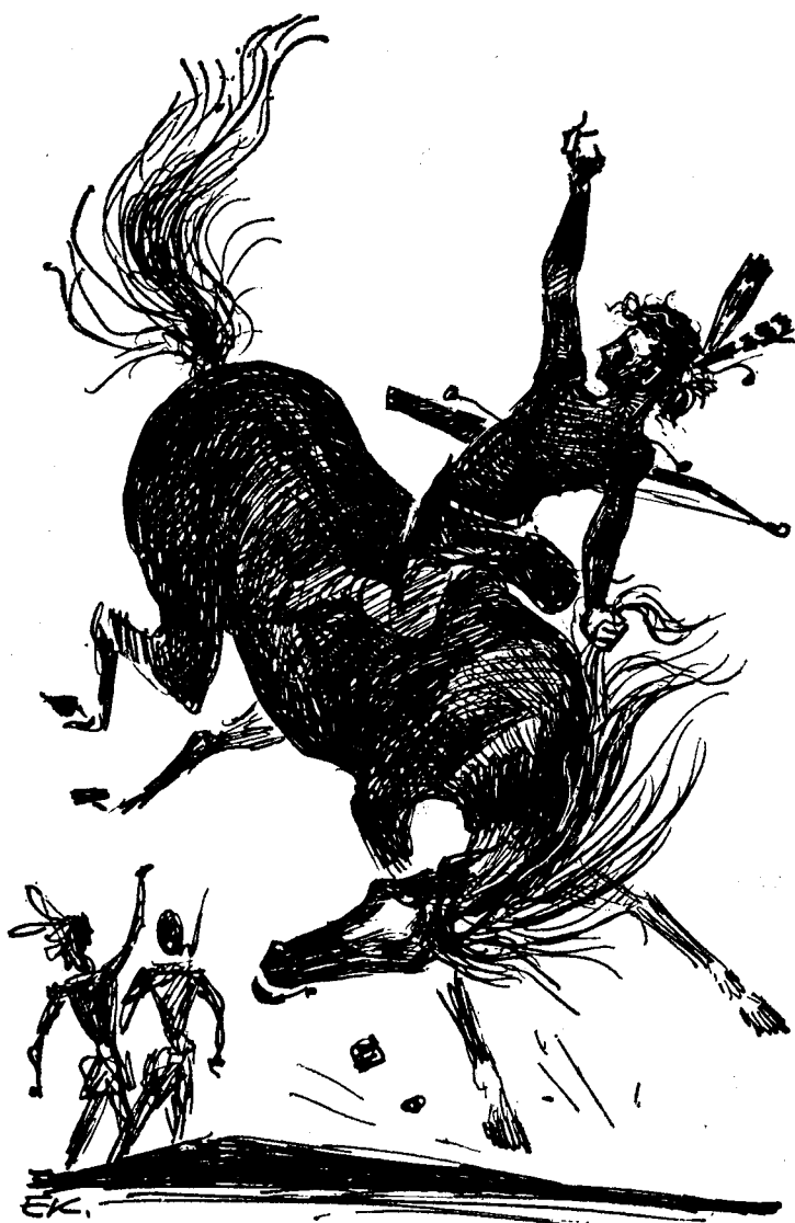
Денис вже сидів на коні, що мав білу зірку на чолі.