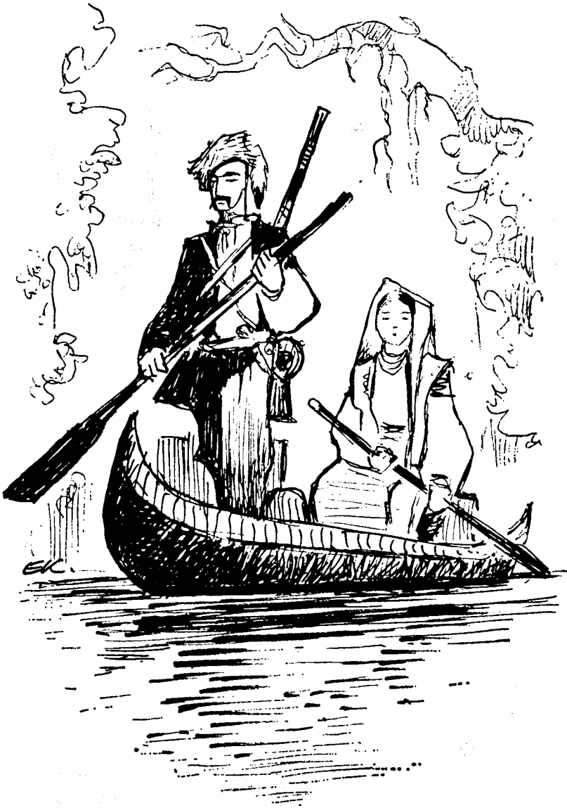
Це Іван приїхав і привіз жінку.