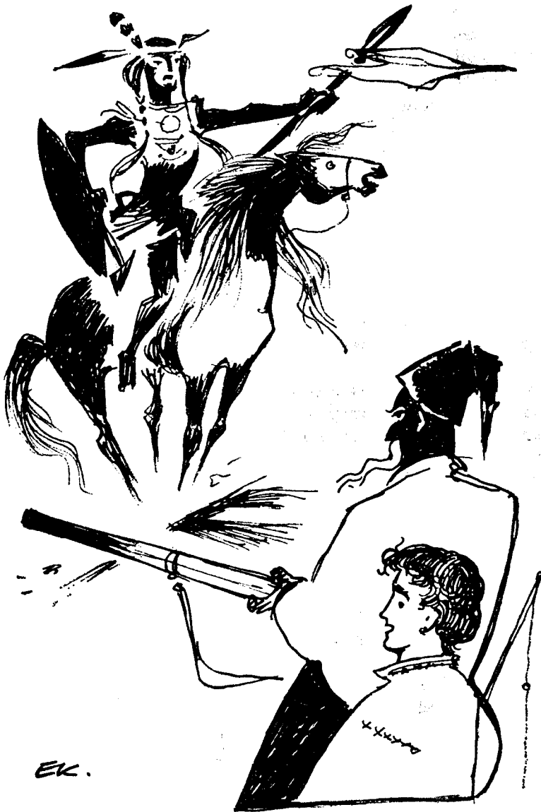
...Наче з-під землі виріс індіанець на коні.