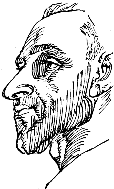
Іван Смолій (рис. Я. Гніздовського)