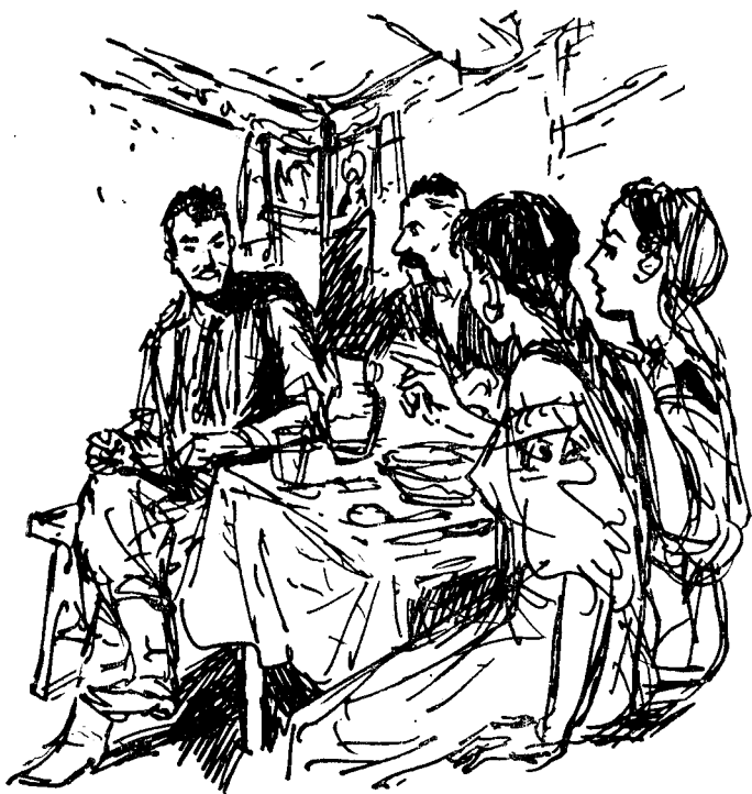
«Катерина гордо указала рукою на Остана» (ст. 226).