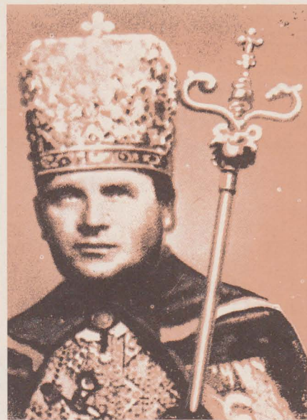
Василь Гопко — Єпископ-помічник Пряшівський (Словаччина).

Ув'язнений словацькими комуністами 3 травня 1950 р. і засуджений на 15 літ тюрми. Після його звільнення (1965 р.) не мав дозволу виконувати свого єпископського служіння. Помер 23 липня 1976 р.