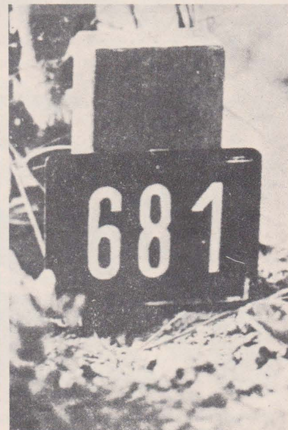
Могила єпископа Гойдича.

Павло Гойдич — Єпископ Пряшівський (Словаччина), ув'язнений 28 квітня 1950 р. чехословацькими комуністами і засуджений на довічну тюрму. Помер 17 липня 1960 р. у в'язниці в Леопольдово і був там похований як в'язень ч. 681.