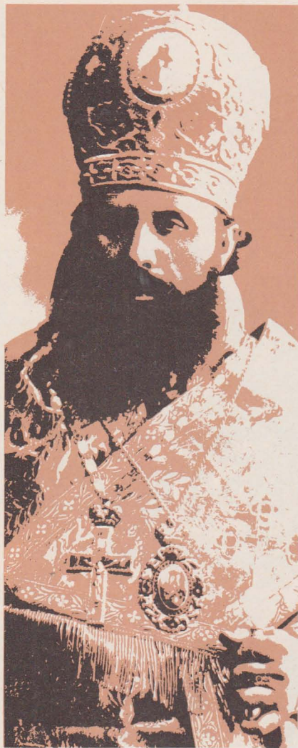
Єпископ Микола Чарнецький — Апостольський Візитатор Волині, ув'язнений 11 квітня 1945 р. Із знаками тортур і злиднів вернувся він після десятих літ зі Сибіру до Львова, де помер 1957 р. внаслідок своєї неволі.

Наша Церква начислює в Советському Союзі принаймні чотири мільйони людей, що осталися вірними Римові. Їхня віра є така сильна, що приносить багаті плоди: маємо священників, монахів, монахинь, численні покликання і таємну ієрархію. Безбожницькій системі не вдалося вбити віри. Батьки, що виростили в безбожницькій системі, виховують своїх дітей у християнському дусі. Дисиденти, виховані в