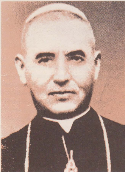
Іван Лятишевський — Єпископ-помічник Станіславський, ув'язнений 11 квітня 1945 р., повернувся хворий у 1955 р. зі Сибіру і помер у 1957 р.

Існування і духовна сила Церкви в моїй Батьківщині є надзвичайної ваги для збереження вірності для тих українців-ізоїв, що через втечу або переселення розсипалися по цілому світі і залишилися вірними своїй Церкві. Без існування Церкви-Матері не може бути мови про Церкву на поселеннях! Так як ізраїльський народ у вавилонській неволі, будь-коли забував Єрусалим, неминуче пристосовувався до поганських звичаїв, так теж і українські поселення без вну-