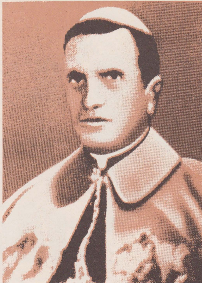
Никита Будка — Єпископ-помічник Львівський, ув'язнений 11 квітня 1945 р. Помер у жовтні 1949 р. як каторжник у Караганді (Казахстан).