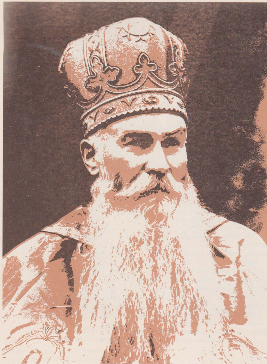
Йосафат Коциловський — Єпископ Перемиський, ув'язнений 21 вересня 1945 р. польськими комуністами, був виданий до Советського Союзу. Помер 17 листопада 1947 р. в київській тюрмі.

Церкви немає іншої путі від хресної дороги. Ця хресна дорога Української Церкви є ще й тепер засіяна людськими кістками.