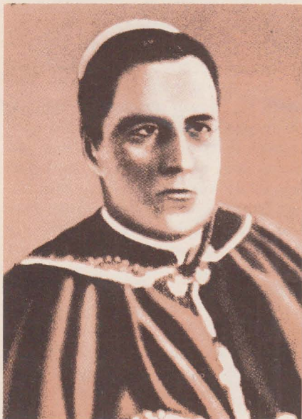
Григорій Лакота — Єпископ-помічник Перемиський, ув'язнений 22 вересня 1945 р.

польськими комуністами і виданий до Советського Союзу. Помер у листопаді 1950 р. як каторжник у Воркуті.