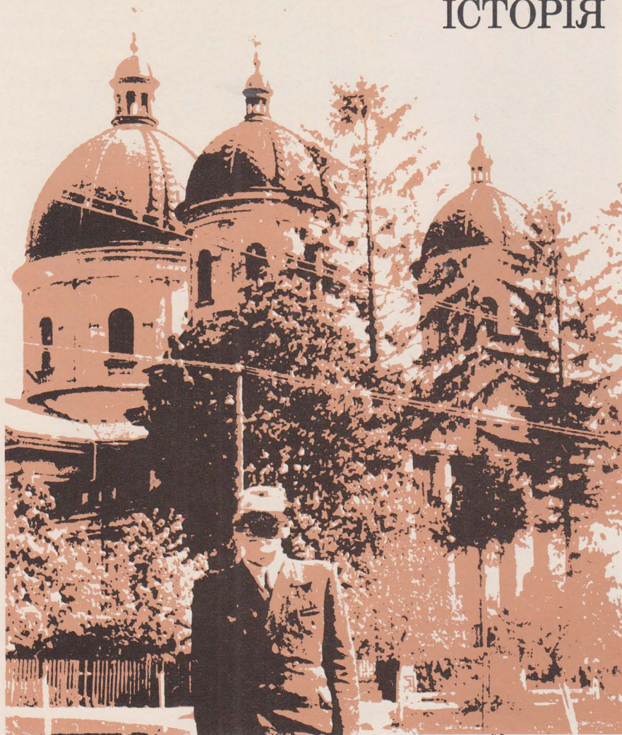
Катакомбний священик перед церквою в околиці Львова. Пресвята Богомати береже його.

віді. Усні іспити відбуваються весною і літом на вільному повітрі. Тоді й відбуваються свячення».