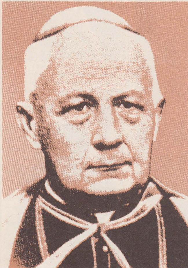
Григорій Хомишин — Єпископ Станіславівський, ув'язнений 11 квітня 1945 р. і помер у січні 1947 р., вісімдесятилітній, у тюрмі в Києві.

Також комуністичний режим добре знає, що його боротьба за душі, яку він перед більш як 60 роками почав з такою самопевністю та бундючністю, не мала сподіваних успіхів. Часті заклики у пресі до молоді, також до комуністично зорганізованої молоді (комсомолу), не брати участі в