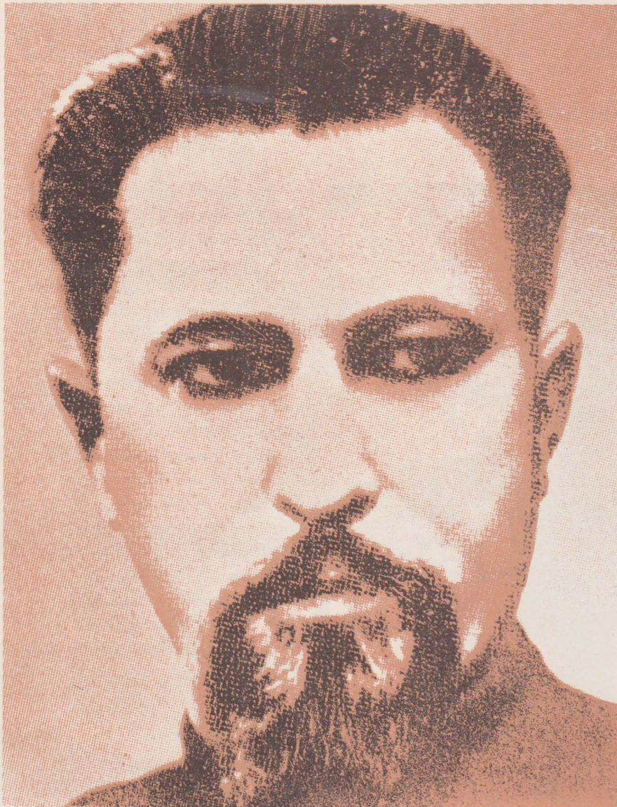
Теодор Ромжа — Єпископ Мукачівський і Ужгородський.

Його з наміром переїхало 27 жовтня 1947 р. вантажне військове авто, що перевозило солдатів червоної армії, коли він вертався з церковного свята. Солдати вже важко раненого єпископа копали й били прикладами рушниць і залишили його в рові при дорозі. Коли, несподівано, поранення його не подолали, йому дали смертельну ін'єкцію 1 листопада 1947 р. в мукачівській лікарні. Було йому 36 літ, коли він помер мучеником.