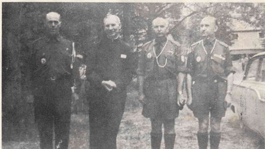
Владика Кир Ніл на пластовому таборі в Сіба Біч, 1963 р. з провідниками 3-ох Станиць