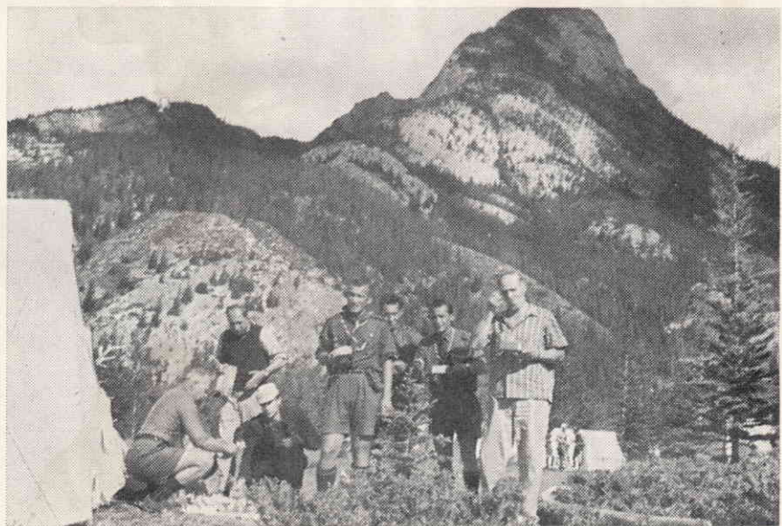
В горах Джеспер, 1963 р.