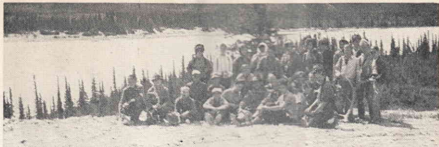
Відпочинок у горах Джеспер, 1963 р.