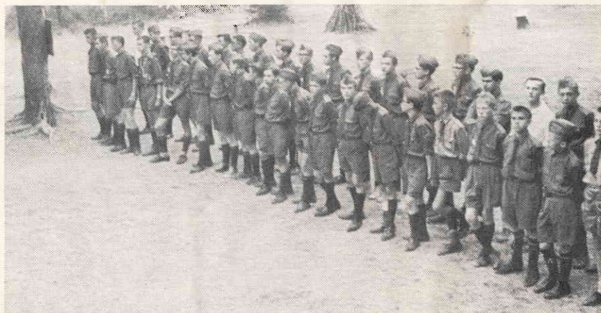
Юнаки 3-ох західних Станиць на збірці, 1963 р.