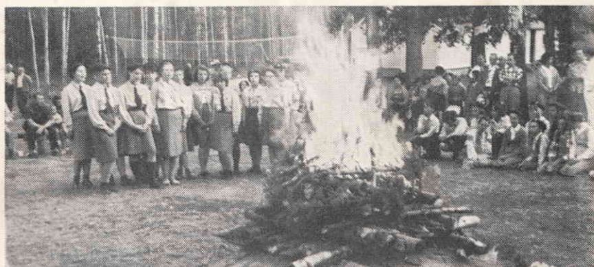
Таборова ватра, 1962 р.