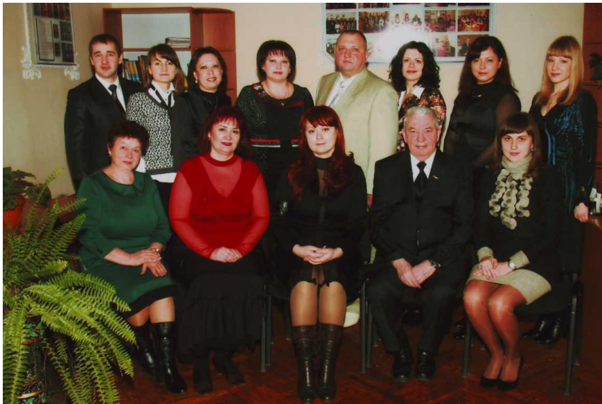
Кафедра історії України – сьогодні