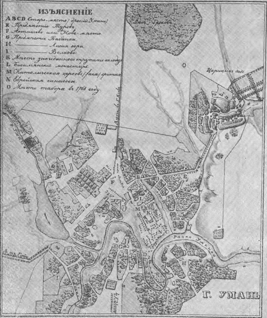
План м. Умані.