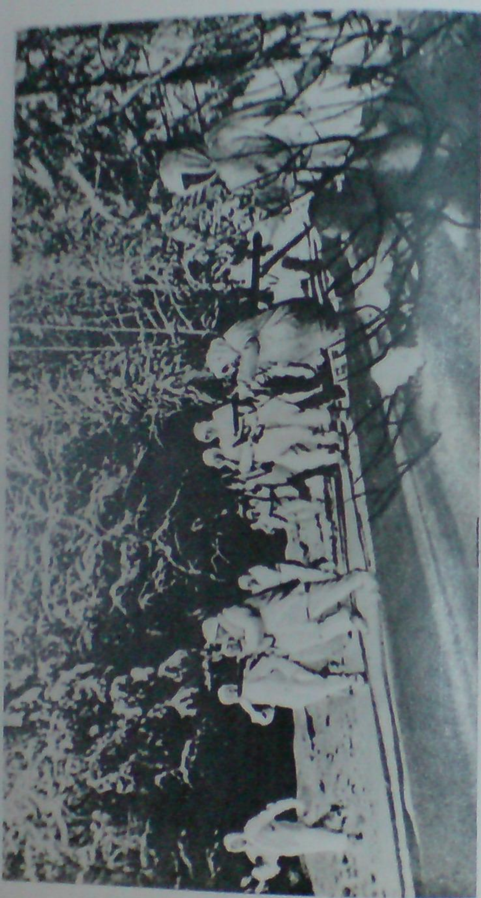
В наступлении войны 49-го стрелкового полка. Январь, 1942 г.