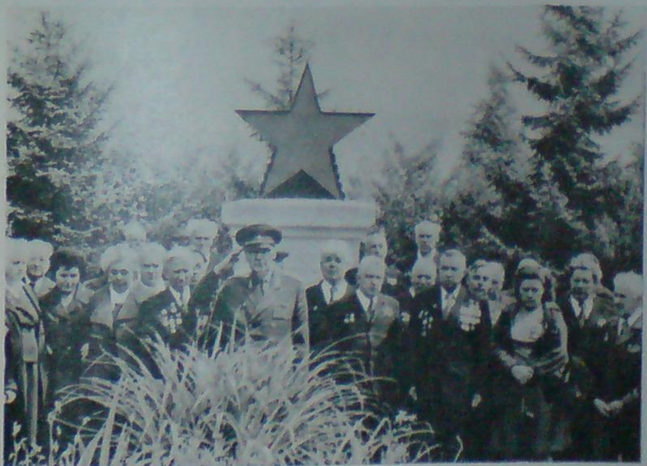
Вечная память павшим! Тучково, 1980 г.