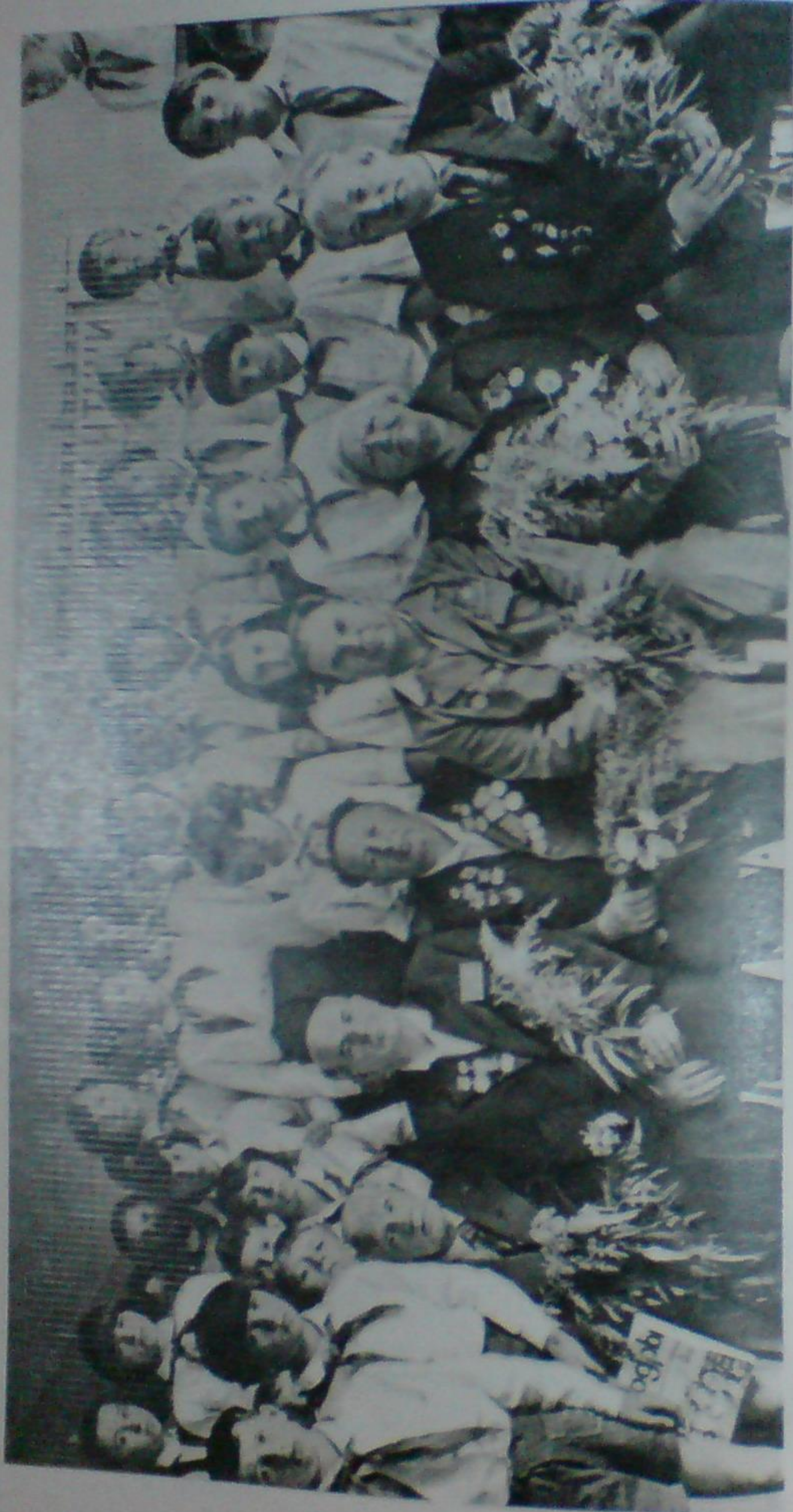
Ветераны дивизии у школьников Васильевской средней школы, 1978 г.