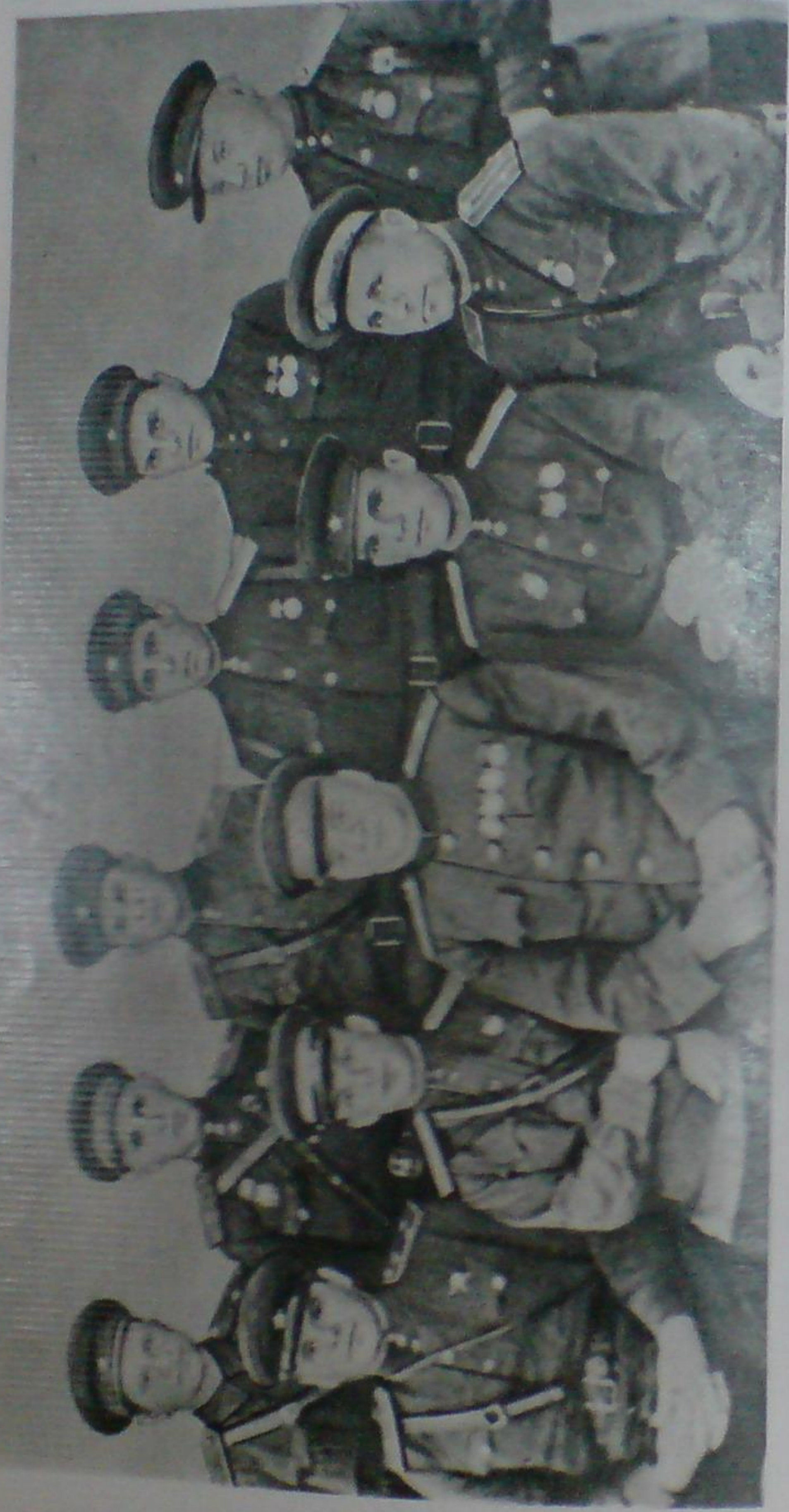
Командование дивизии с командирами полков, 1943 г.