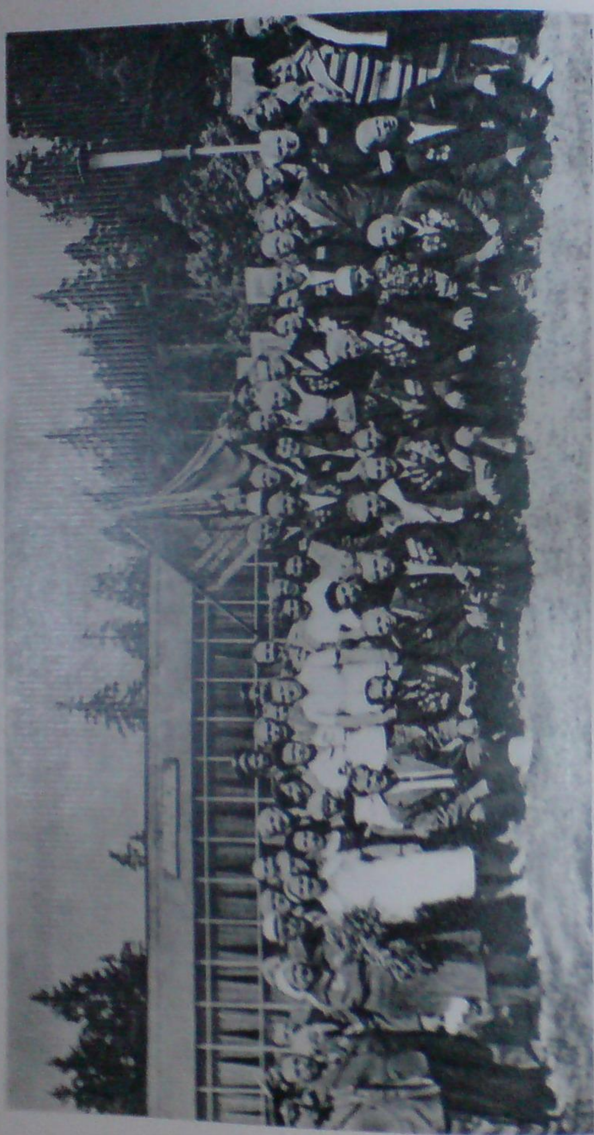
Ветераны 359-го стрелкового полка, крадящегося в музей. 1981 г.