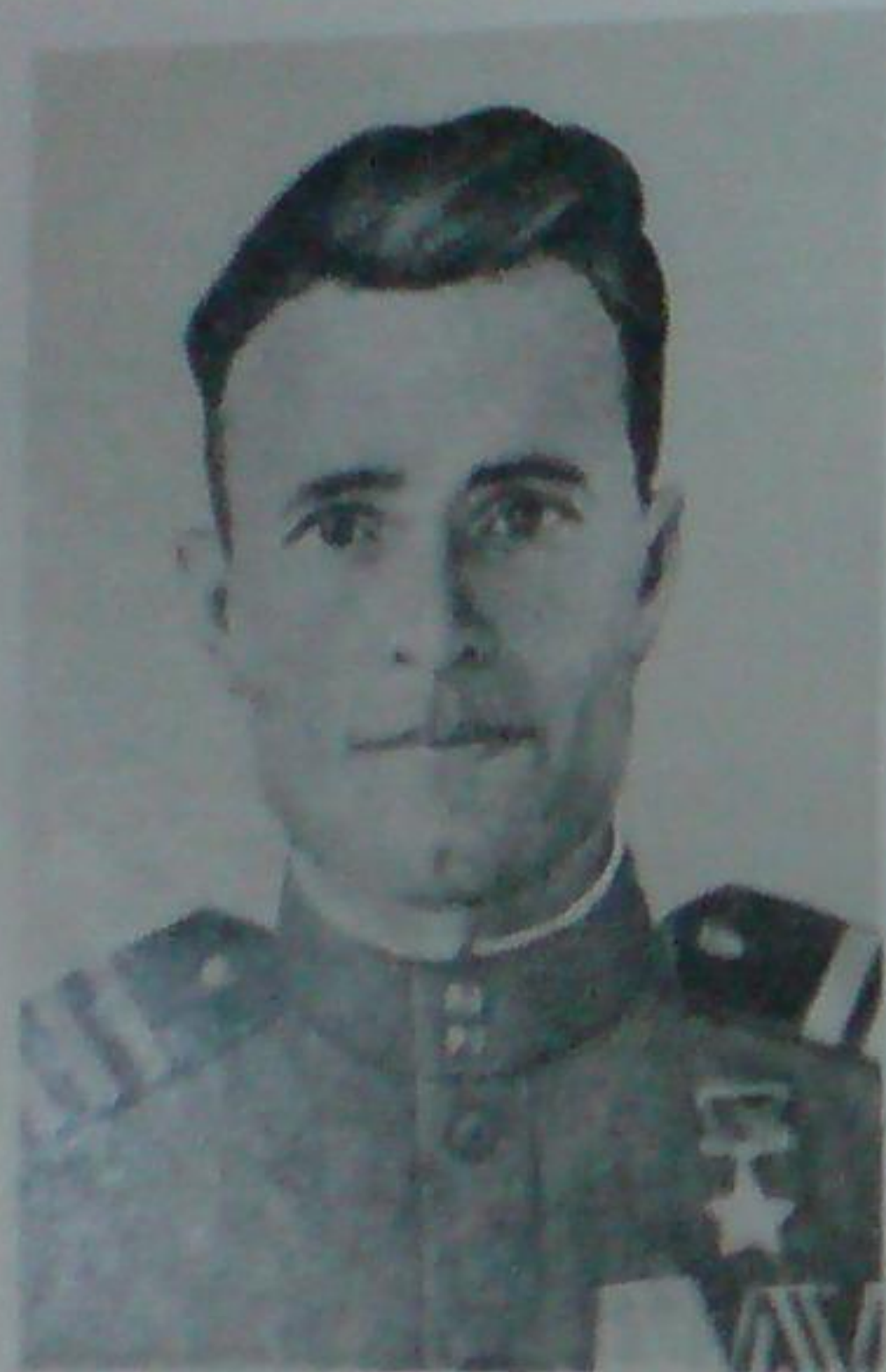
И. С. Поскребышев