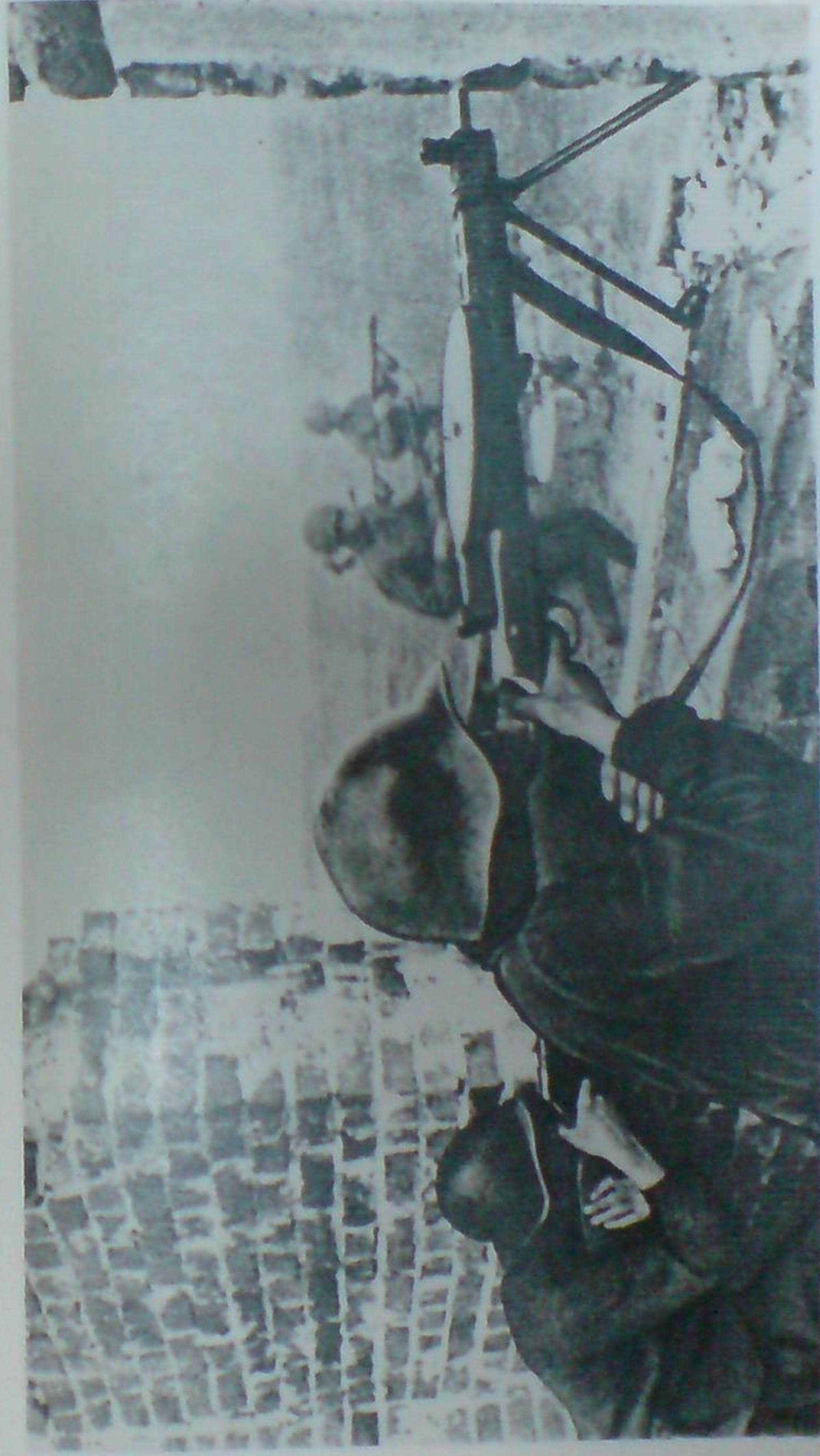
В бою подразделение 359-го стрелкового полка, 1943 г.