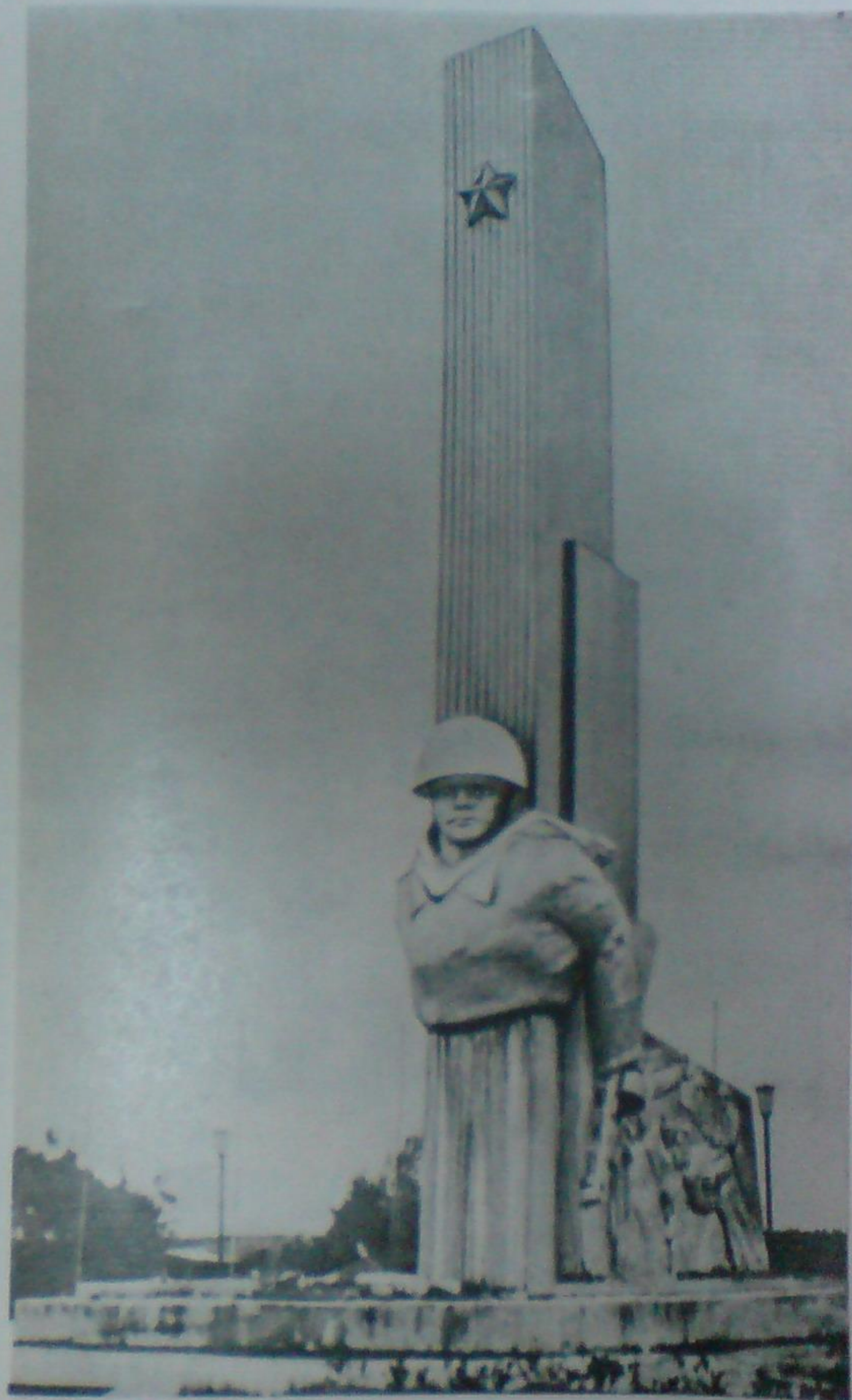
Памятник воинам 50, 32 и 82-й стрелковых дивизий, погибшим в боях под Москвой