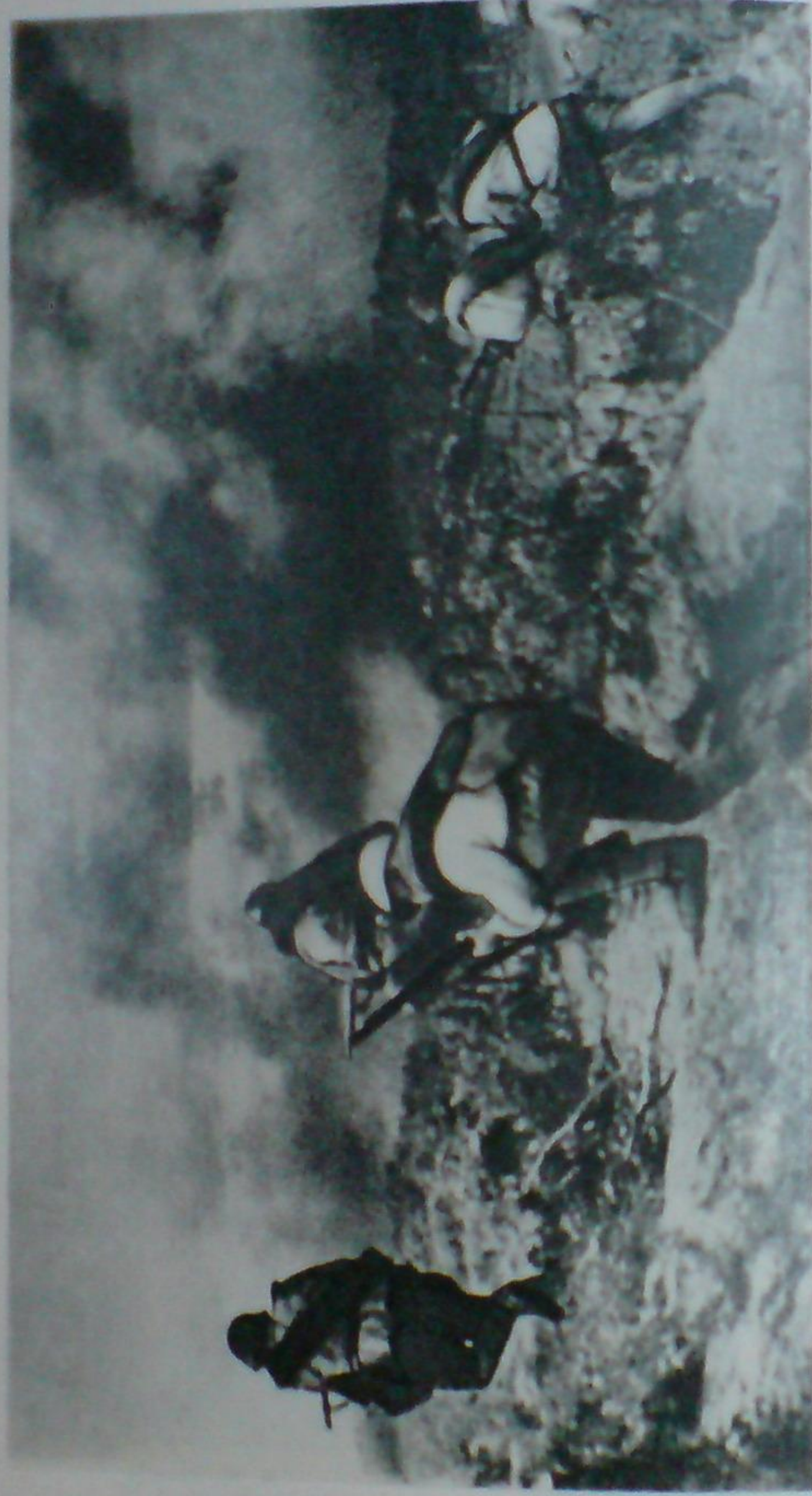
Атакуют воины 2-го стрелкового полка, 1942 г.