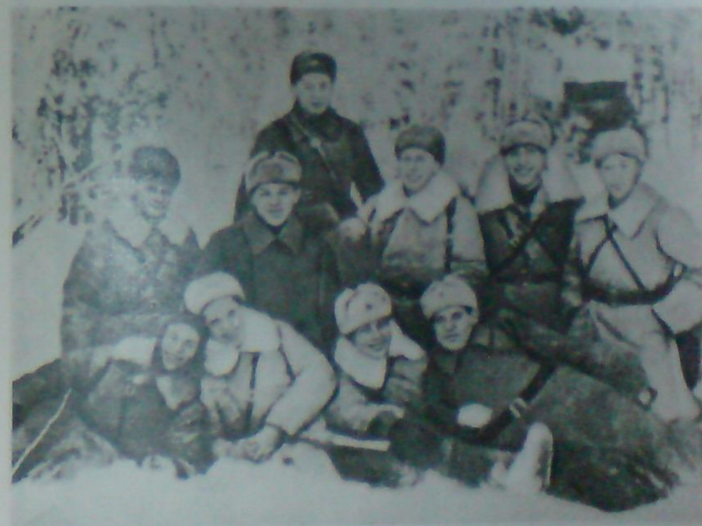
Политработники дивизии. Декабрь, 1941 г.