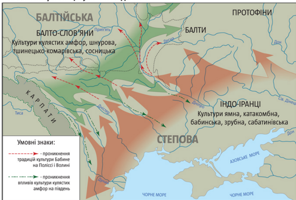
Рис. 2. Розселення пращурів індоіранців та балто-слов'ян на землях трипільців у III–II тис. до н.е.

Безглуздо заперечувати генну своєрідність окремих популяцій людства, зокрема й конкретних етносів. Особливо якщо вони тривалий час мешкали в географічній ізоляції від сусідів, наприклад на островах, півостровах, за гірськими хребтами чи пустелями. Історія знає випадки й самоізоляції окремих народів, коли з ідеологічних міркувань шлюбні контакти штучно обмежувала власна ж таки популяція. Однак українці, як і переважна більшість європейських сусідів, не належать до числа таких етносів-ізоляціоністів. Тому їхній геном принципово не різниться від сусідських і складається з гаплогруп I, R1a, R1b, N, J, властивих іншим народам Європи, геноми яких різняться між собою насамперед пропорціями згаданих гаплогруп. Причому від 70% до 95% генного набору більшості європейських народів (зокрема й українців) становлять гени, що успадковані від палеолітичних мисливців прильодовикової Європи (гаплогрупи I, R1a, R1b).