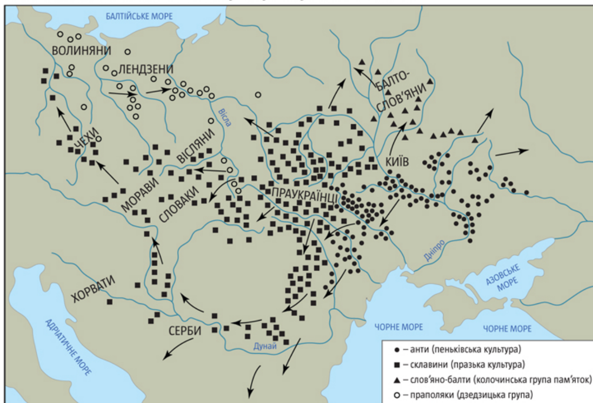
Рис. 4. Розселення слов'ян із території України в VI–VII ст.

Від V–VII століття після навали гунів та аварів також стабілізується ситуація на етнічній батьківщині українців між Карпатами, Прип'яттю й Київським Подніпров'ям. Безперервність етнокультурного розвитку на цих теренах упродовж останніх 1500 років дає підстави опускати коріння українського етносу, як і згаданих інших великих народів Європи, в ранне середньовіччя (рис. 3). На цей час головні компоненти української етнокультури – праслов'янський (зарубинецька культура), іранський (спадок скіфів, сарматів), східногерманський (готи, вандали), балтський, фракійський, кельтський – поєдналися в єдиний і неповторний український комплекс, який упродовж середньовіччя збагатився тюркськими елементами.