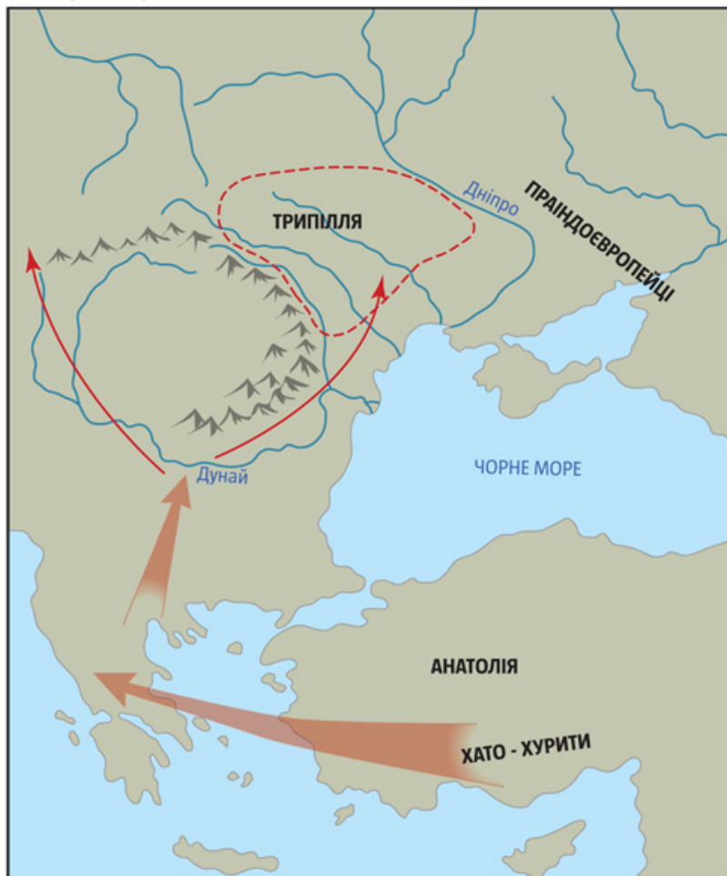
Рис 1. Розселення найдавніших неолітичних землеробів Європи у VII–V тис. до н. е.

2) мовою; 3) етнокультурою; 4) темпераментом (ментальністю); 5) національною самосвідомістю. Причому остання ознака головна, адже без неї народ дезінтегрується, а без чотирьох попередніх може обійтися. Наприклад, цигани та євреї тривалий час зберігали свою етнічну ідентичність поза межами батьківщини. А чилійці, аргентинці чи мексиканці є різними народами, хоча й не мають окремих власних мов і користуються іспанською.