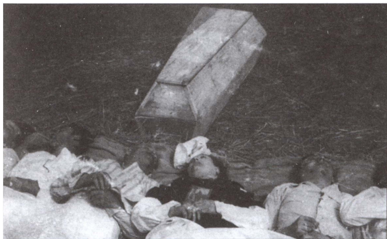
Жертвы «Волынской резни»