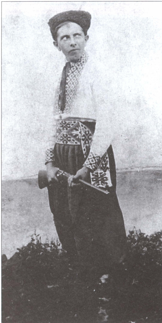
С. Бандера в национальном костюме