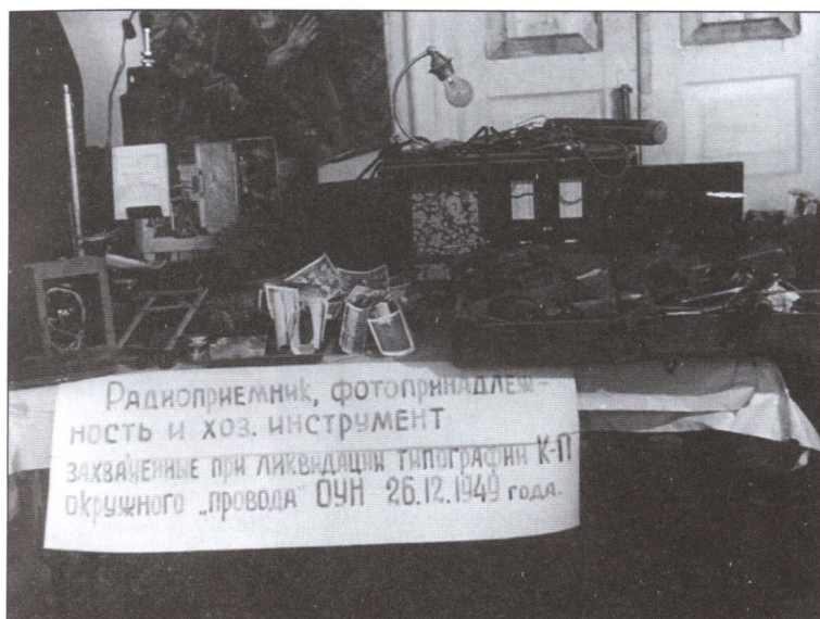
Оборудование и инструменты, захваченные в одной из типографий ОУН