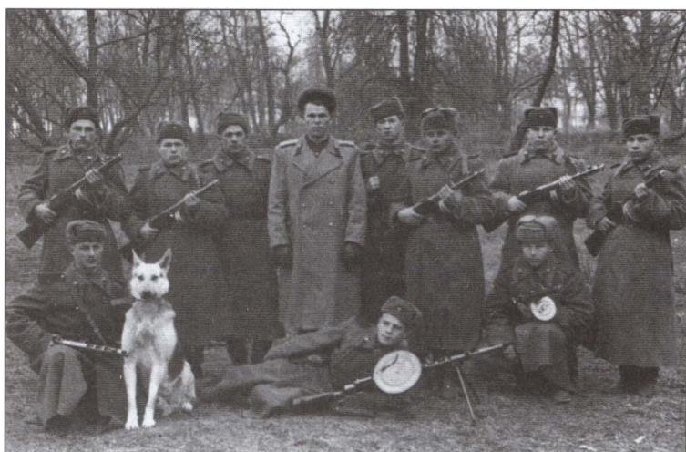
Бойцы МГБ на Западной Украине