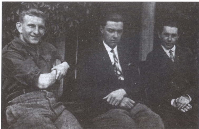
Р. Шухевич (слева) с соратниками на Волыни