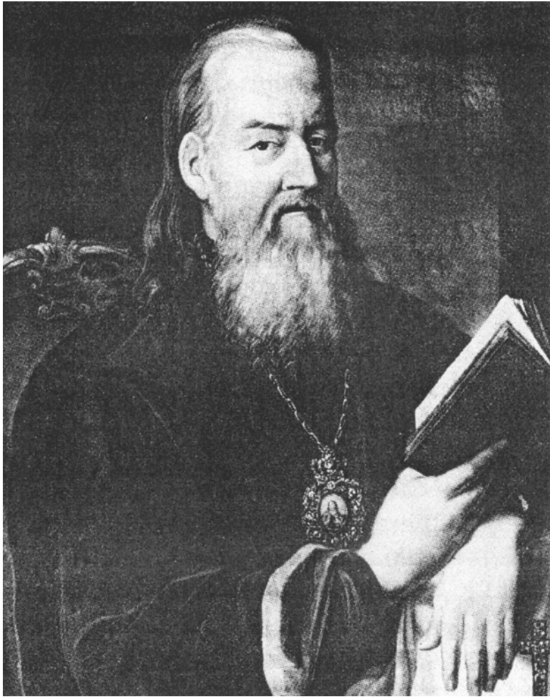
Митрополит Гавриил (Петров-Шапошников)