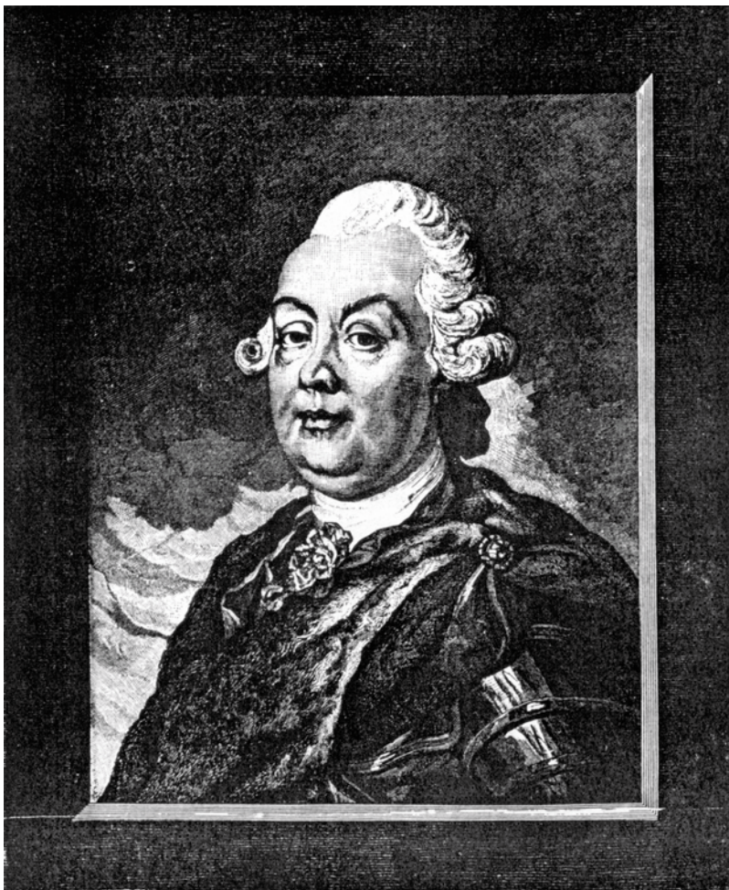
Генерал-фельдмаршал, граф П.А. Румянцев-Задунайский. Гравюра Д. Уолкера с портрета Д.Г. Левицкого