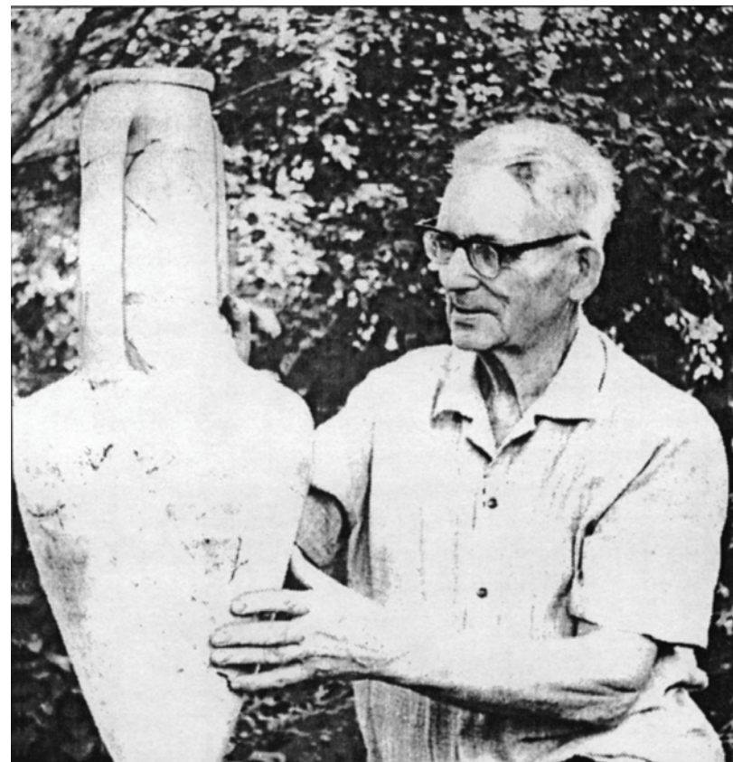
И.П. Грязнов. 1974 г.