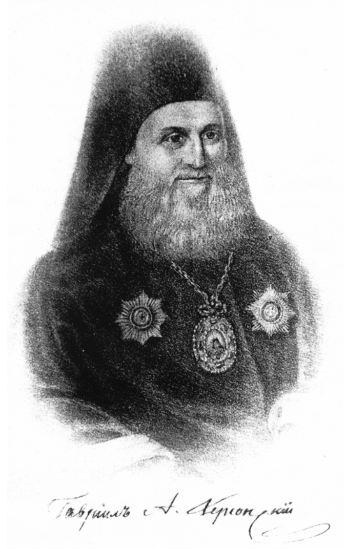
Архиепископ Гавриил (Розанов)