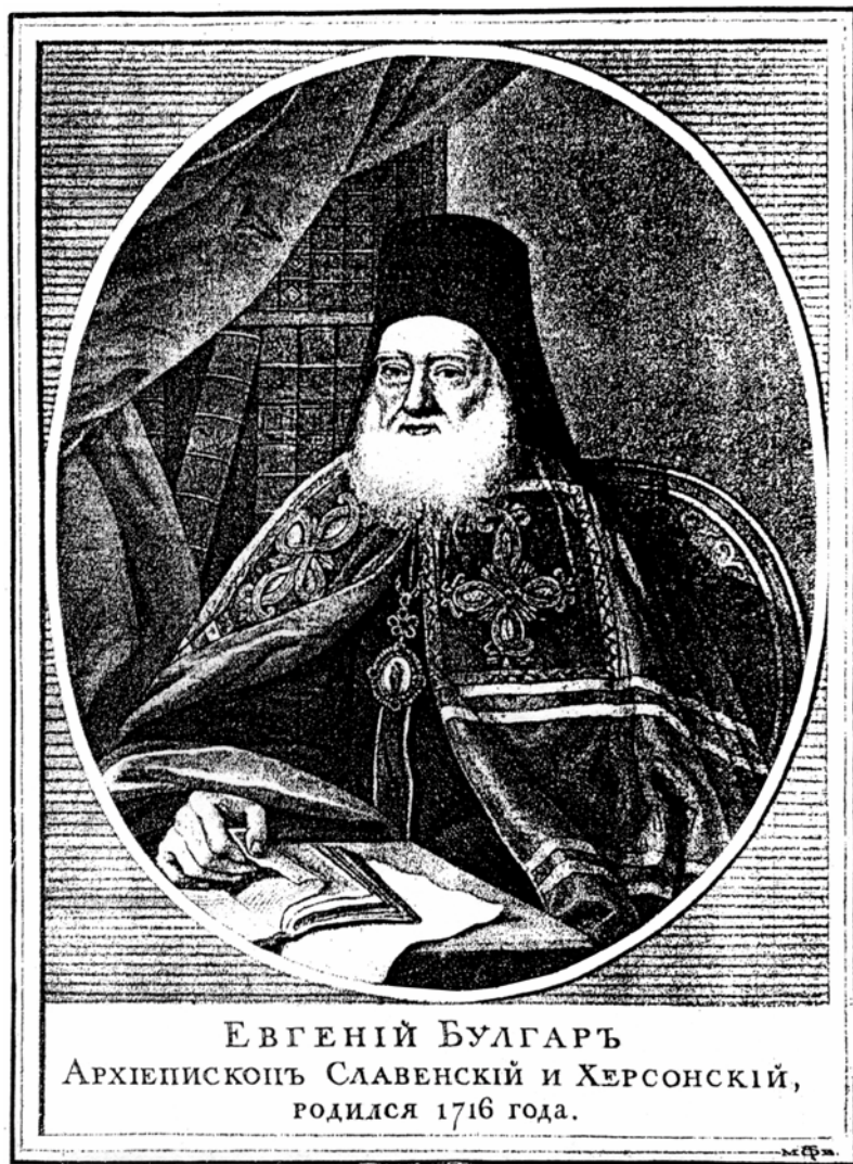
Архиепископ Евгений (Булгарис)