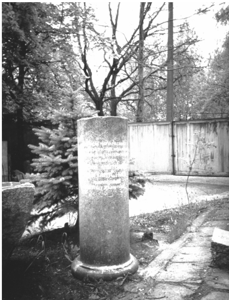
Памятник с могилы А.Д. Константинова, находящийся ныне в ограде Свято-Покровского храма в г. Орехов Запорожской области. 2006 г.