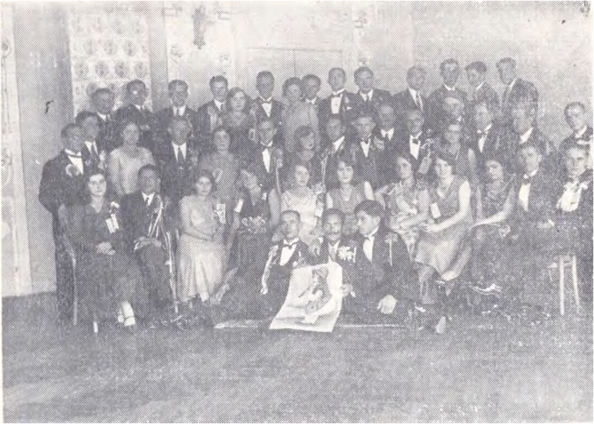
"Молода Громада", Члени "Молодої Громади" після вечерниць з "Котильйоном" 30 серпня 1930 р. в залі Української Бесіди".

кусях, критиках тощо. Члени секції виголошували реферати у "Робітничій Громаді". Вони звернули особливу увагу на це товариство, бо туди почали закрадатися комуністичні впливи.