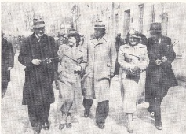
Прохідка по "корзі" (кол. вул. Міцкевіча) в Тернополі.