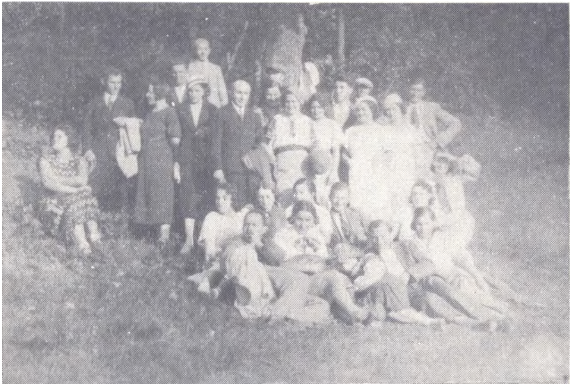
"Молода Громада" ч. 2 Прогулянка членів "Молодої Громади" у Гаї, у лісі Богдана Остап'юка в 1935 р.

2. Культ-освітня Секція. Члени секції влаштовували доповіді не лише в "Молодій Громаді", але також і в інших товариствах. Дуже часто на запрошення секції давали реферати в