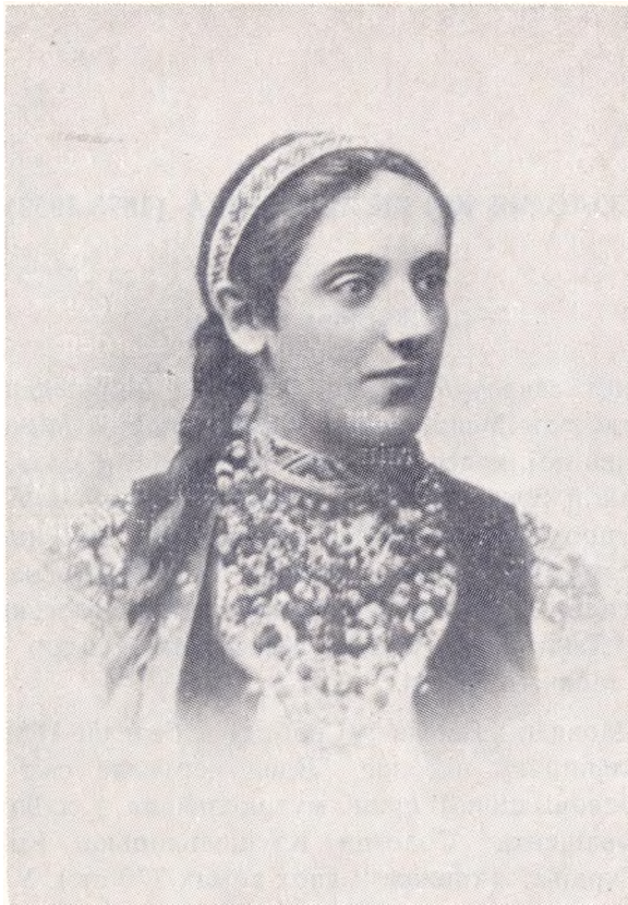
Соломія Крушельницька в юності