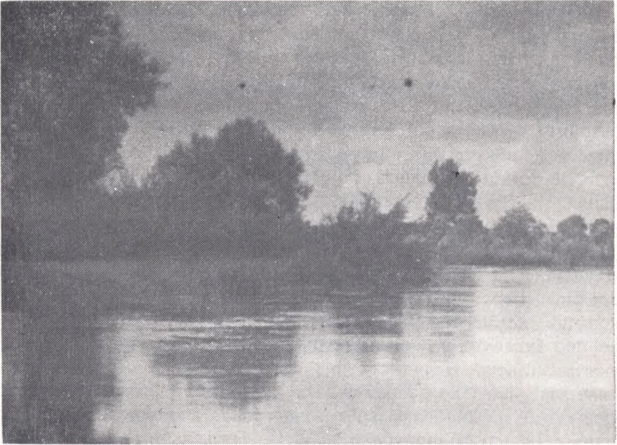
"Над далеким, тихим Серетом"