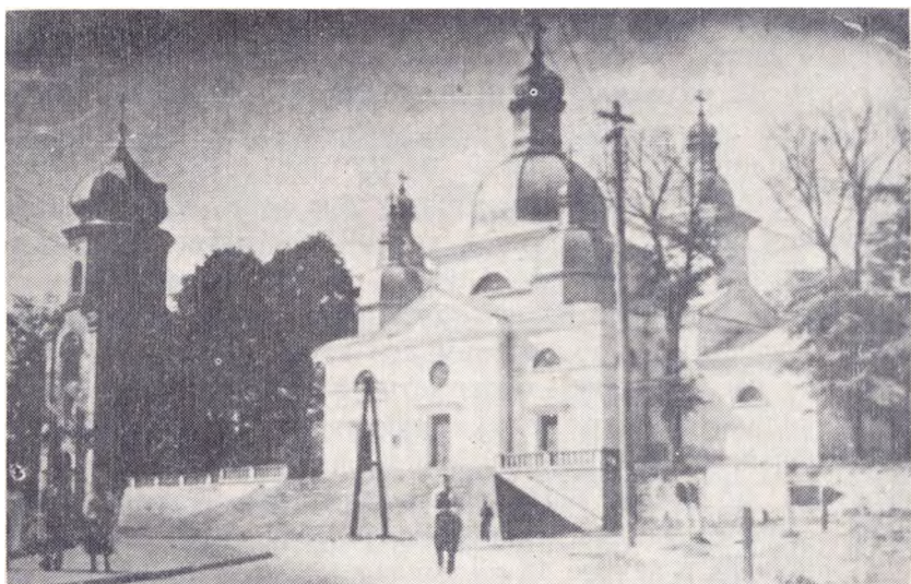
Свят-Успенська церква, яку оо. Редемптористи розбудували у 1930-их роках.