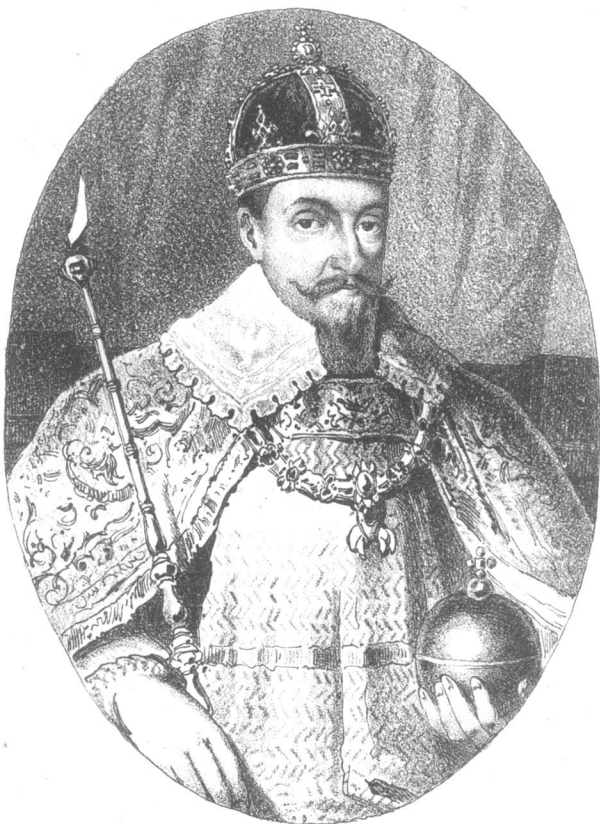
СИГИЗМУНДЪ III, КОРОЛЬ ПОЛЬСКІЙ.