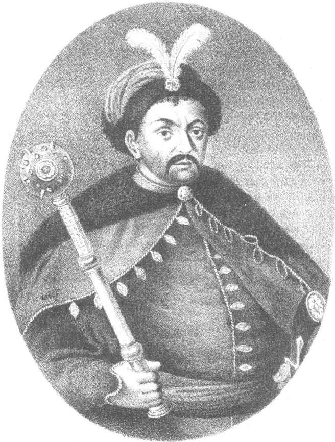
ГЕТМАНЪ БОГДАНЪ ХМЕЛЬНИЦКІЙ .