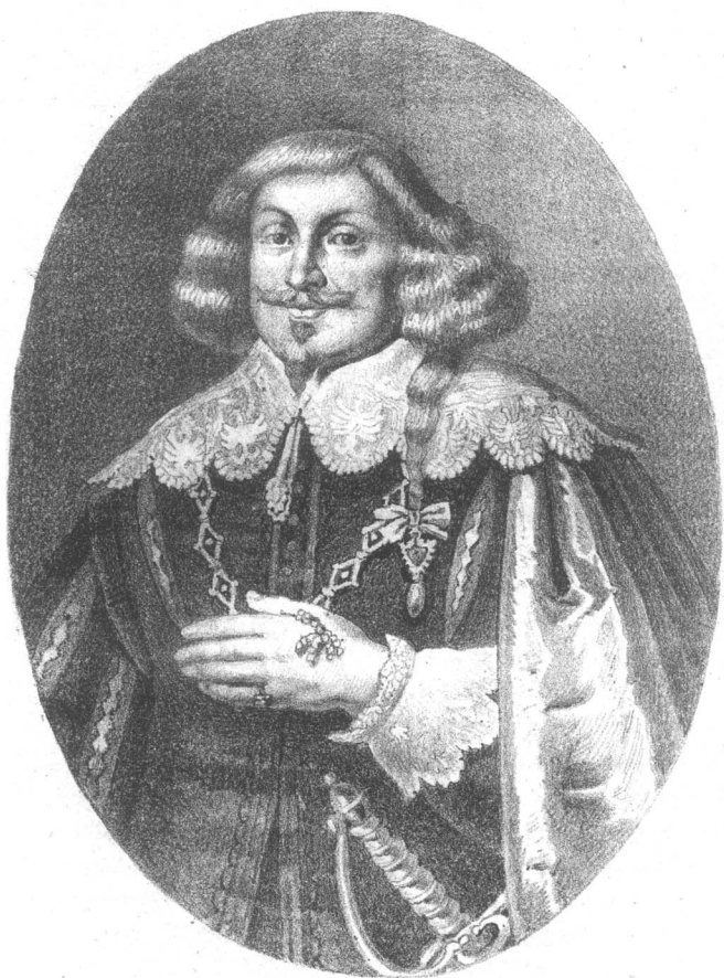
ВЛАДИСЛАВЪ IV, КОРОЛЬ ПОЛЬСКІЙ .