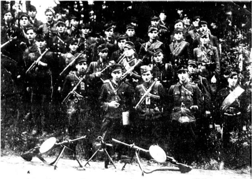
Вд. 95–У2 УПА-Захід к-ра «Громенка» після переходу до Західної Німеччини. 1947 р.