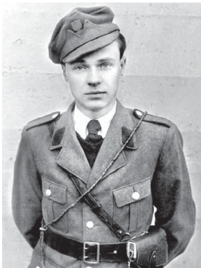
Михайло Шашкевич – «Рись»