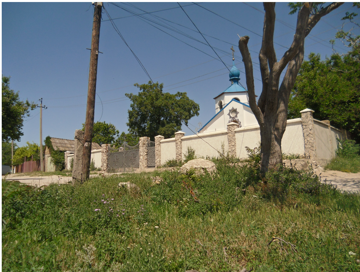
Рис. 5. Предполагаемое место захоронения графини де Гаше в Старом Крыму. Фото 2013 г.