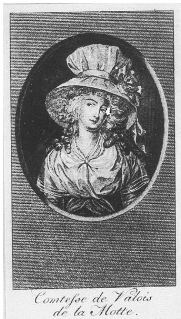
Рис. 3. Графиня Жанна де Ла Мотт-Валуа-Гаше