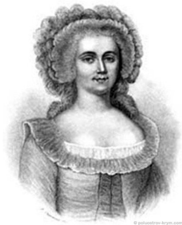
Рис. 4. Графиня Жанна де Ла Мотт-Валуа-Гаше