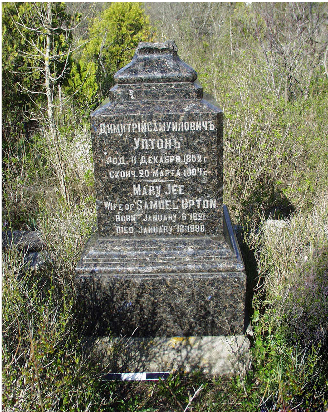
Рис. 2. Памятник над склепом Уптонов на севастопольском старом городском кладбище. Фото 2012 г.