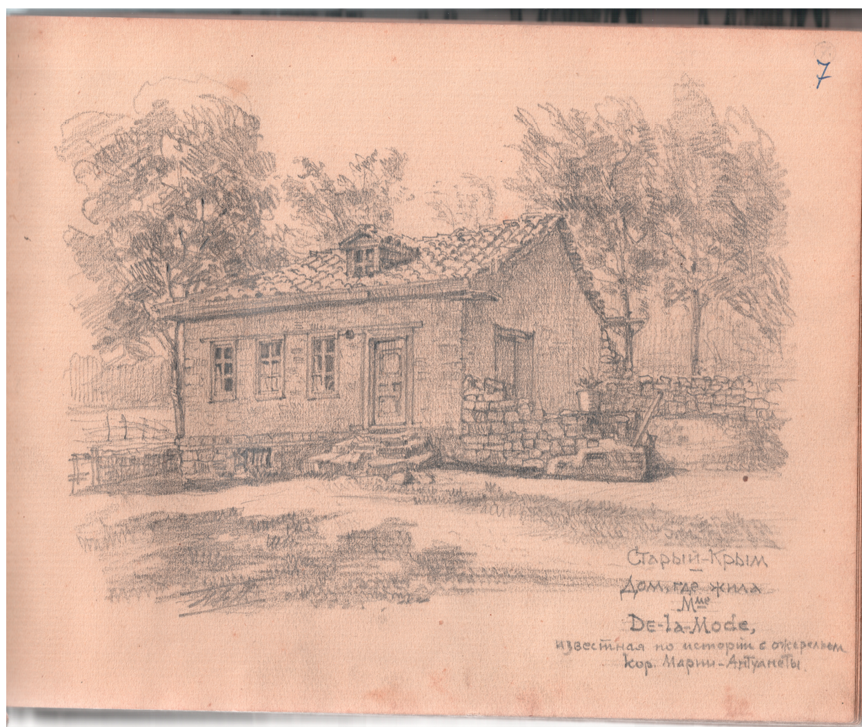
Рис. 2. П.И. Голландский. Старый Крым. Дом, где жила мадам де Ла Мотт, известная по истории с ожерельем королевы Марии Антуанетты. 1927 г. (ЦМТ)