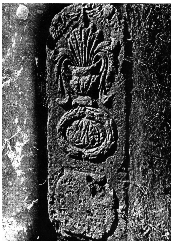
Рис. 6. Надгробие над могилой графини де Гаше в Старом Крыму.