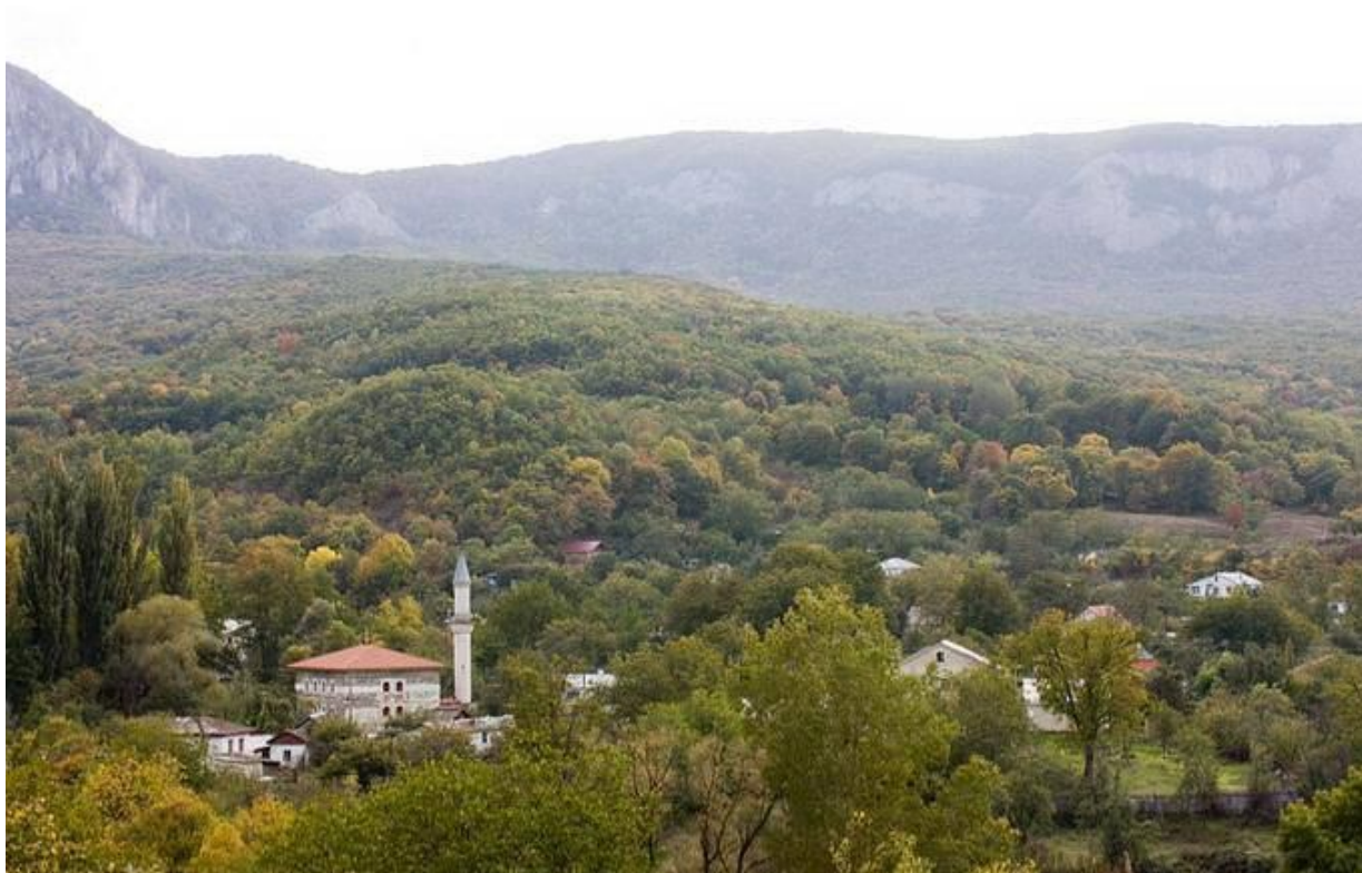
Рис.2. Современный татарский этнокультурный ландшафт Крыма. [ http://pics.livejournal.com/dinaitour/pic/000pz1fe ]