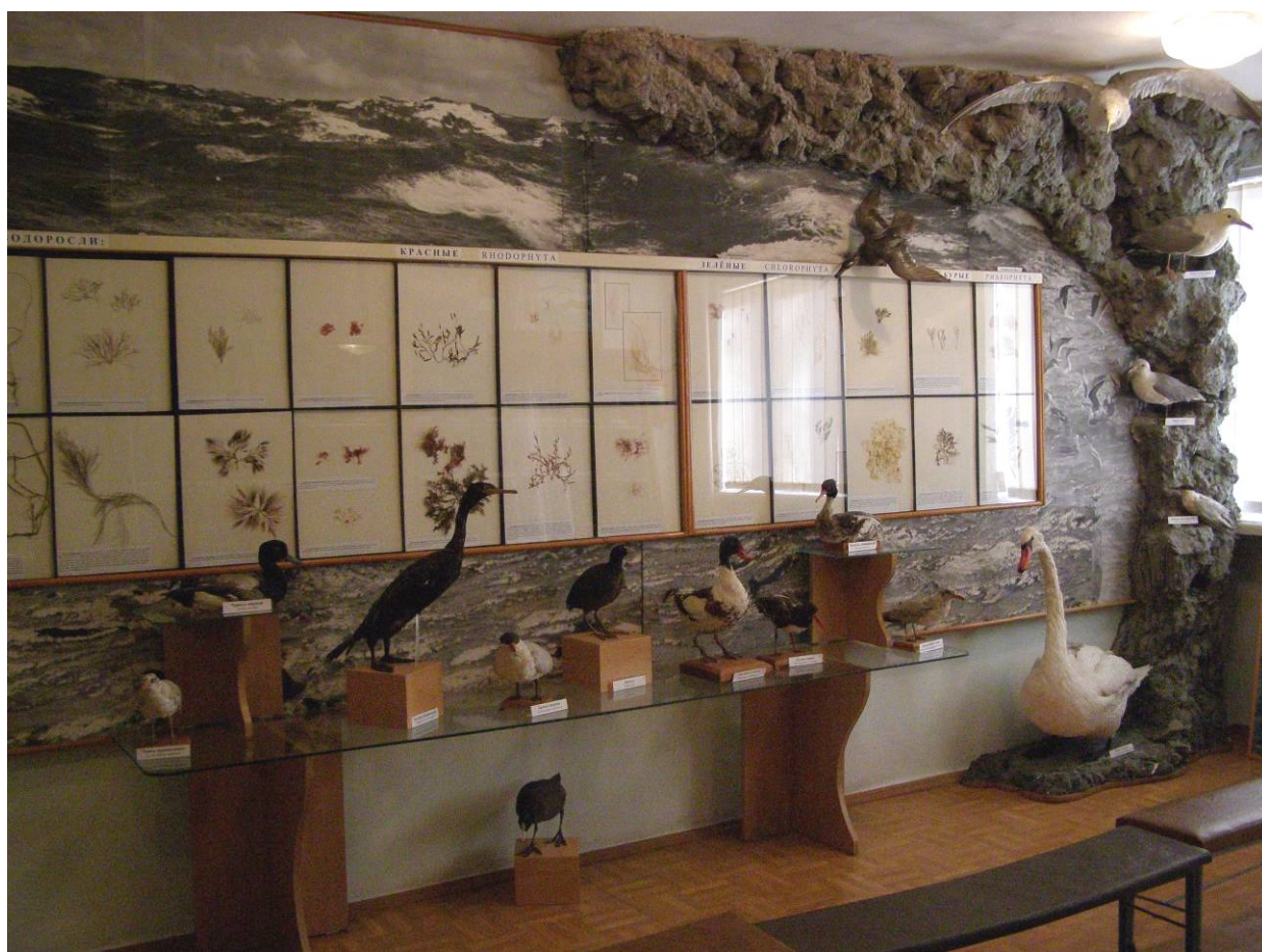
Рис. 16. Фрагмент зала "Черное море" СМКМ им. Е.Н. Овч. 2011 г.