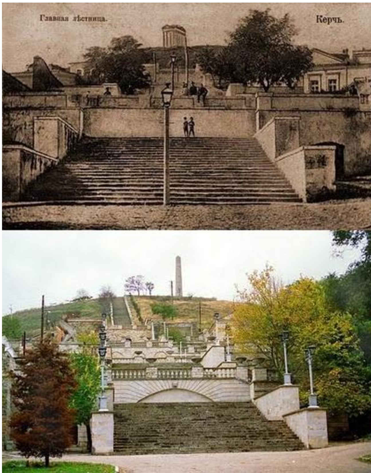
Рис. 3. Лестница на гору Митридат. Вверху – фото XIX в., внизу – современный вид