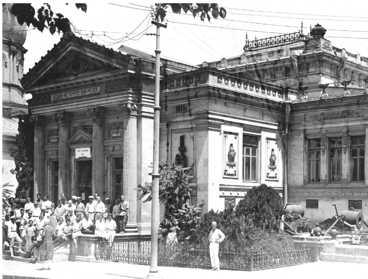
Рис. 8. Здание Севастопольского военно-исторического музея, 1927 г.