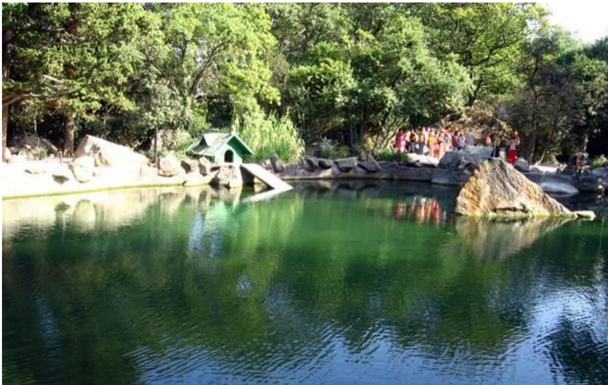
Рис. 1. Садово-парковый культурный ландшафт. Воронцовский дворцовый парк [ http://www.allkrim.ru/fotografii-vorontsovskogo-dvortsa-i-parka ]