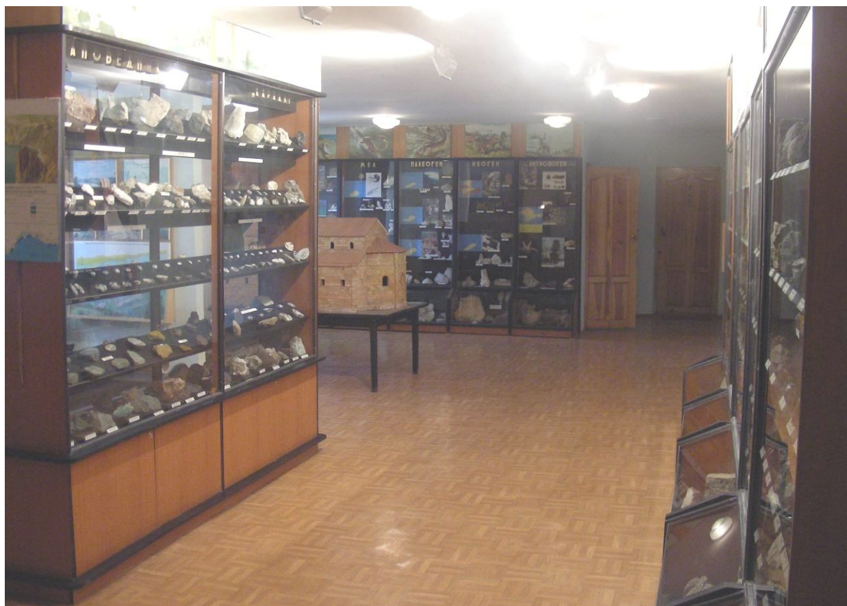
Рис. 15. Общий вид зала неживой природы СМКМ им. Е.Н. Овч. 2011 г.