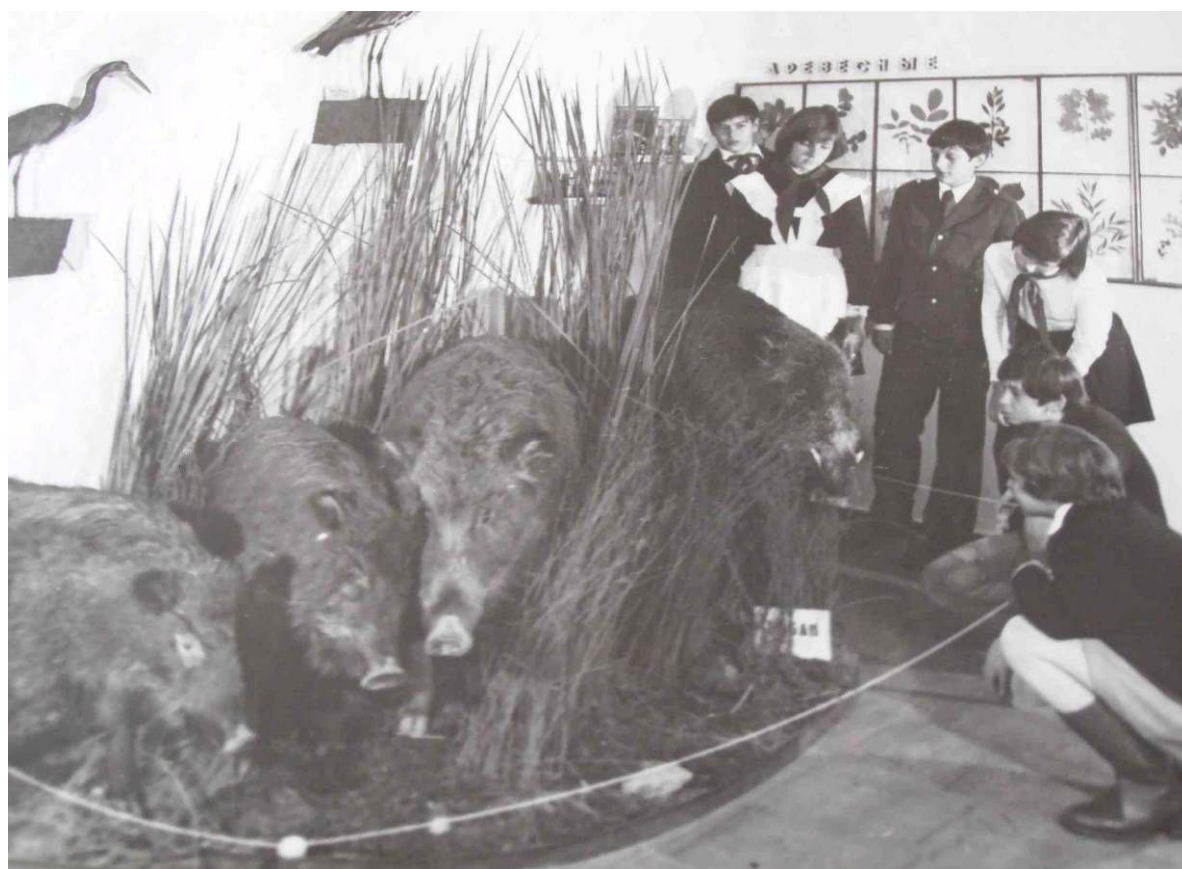
Рис. 14. Школьники знакомятся с разделом живой природы в экспозиции СМКМ, 1977 г.