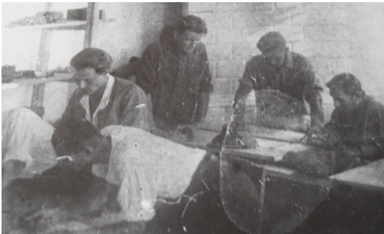
Рис. 9. СМК в подвале Военно-исторического музея, 1933 г.