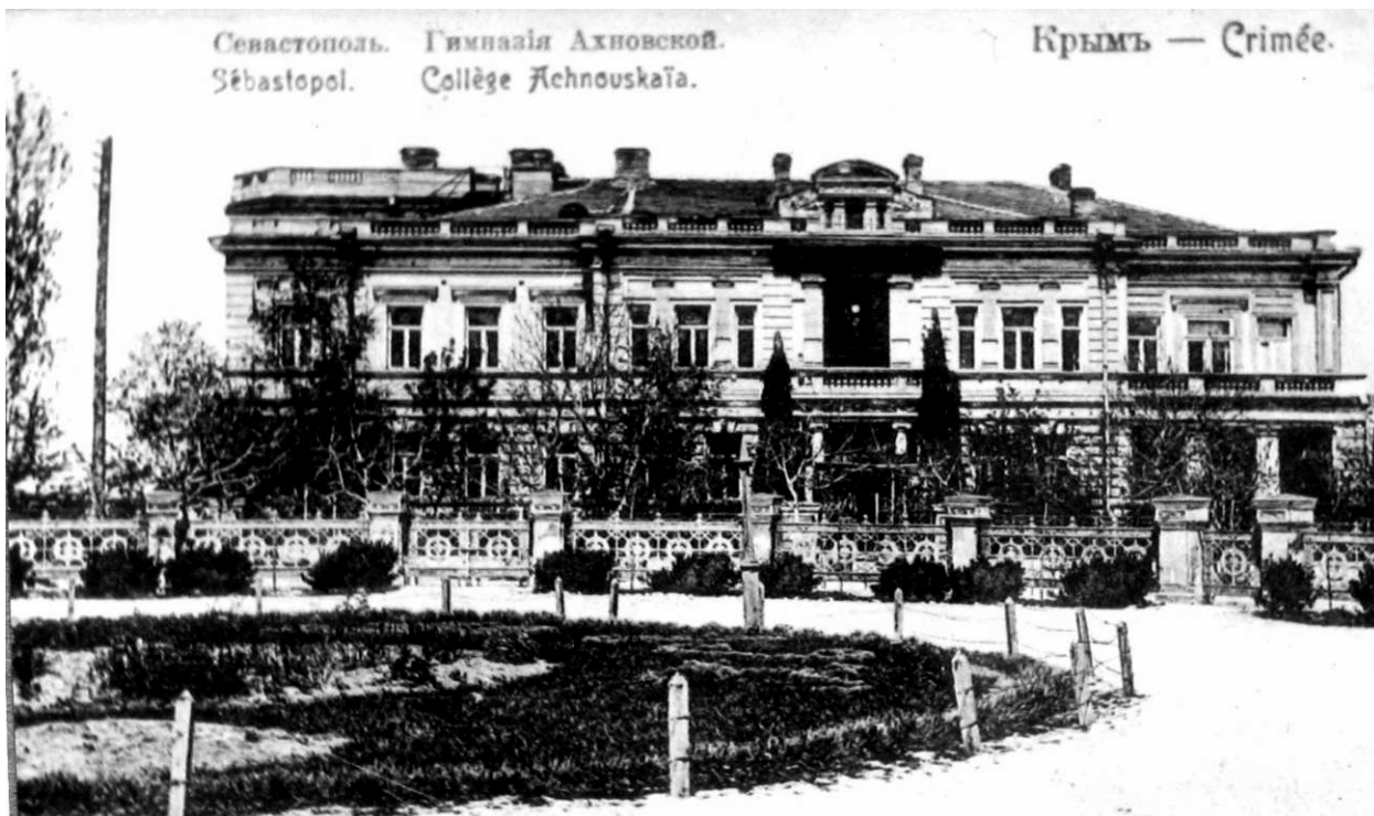
Рис. 1. Здание, в котором располагался Севастопольский музей краеведения (СМК) в 1923–1927 гг. (ул. Пролетарская, 5)