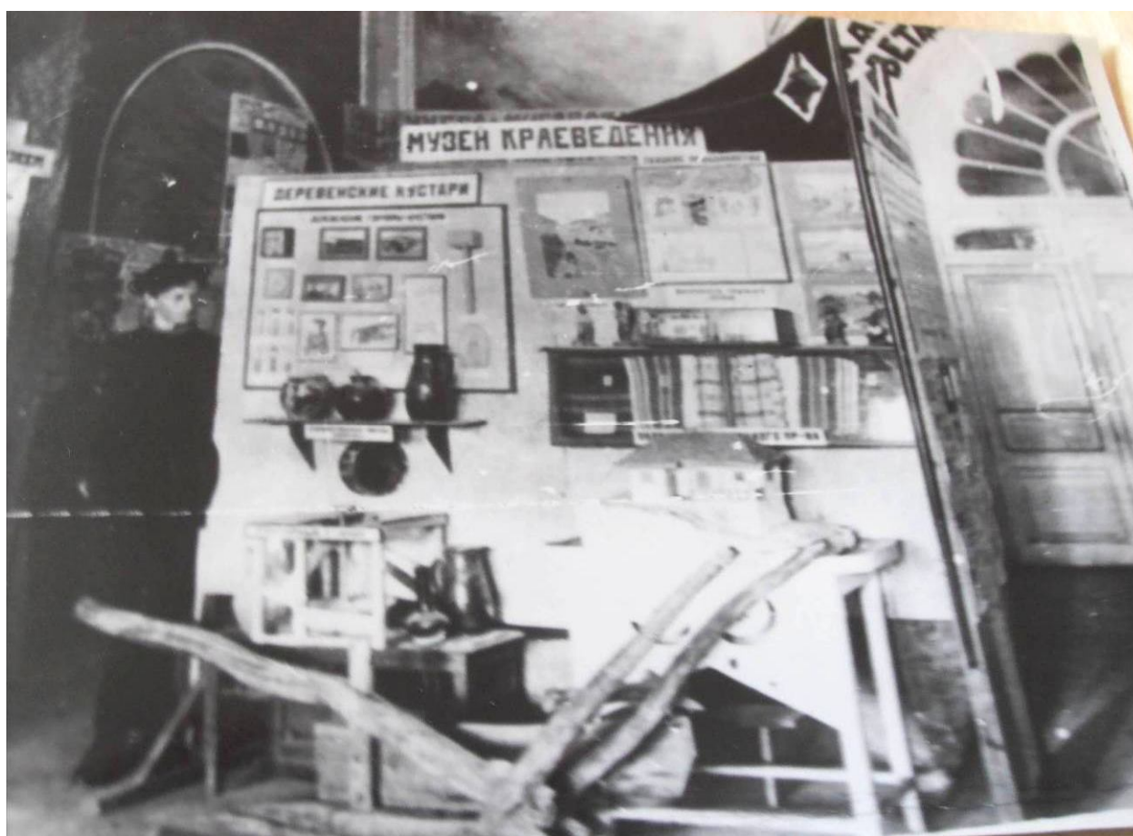
Рис. 6. Александр Натанович Бернштам, СМК, 1925 г.