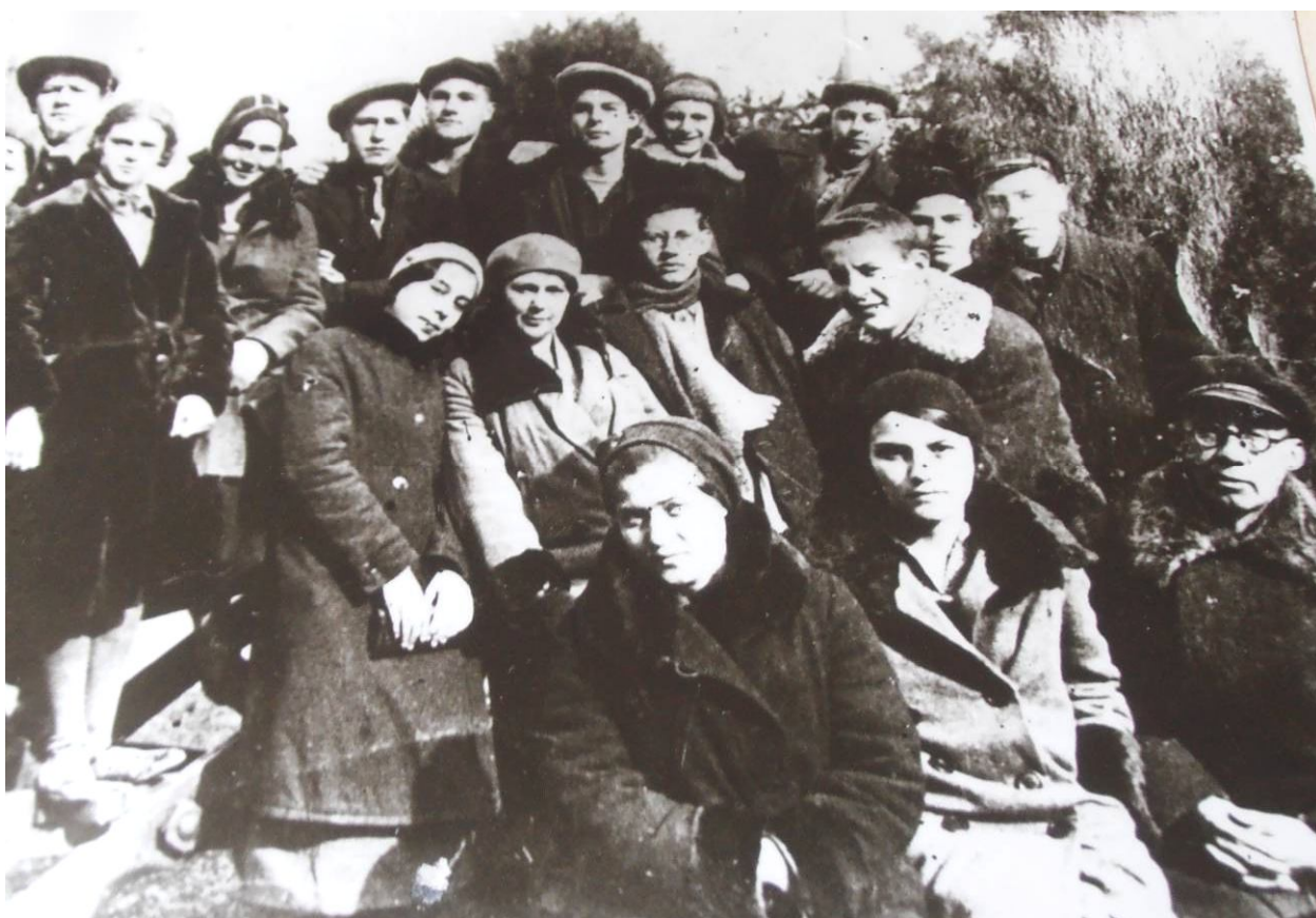
Рис. 10. Группа музейстов среднего и младшего поколения, СМК, 1934 г.