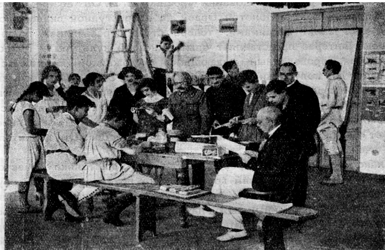
Краеведы за разборкой свежесобранного материала (Севастопольский му