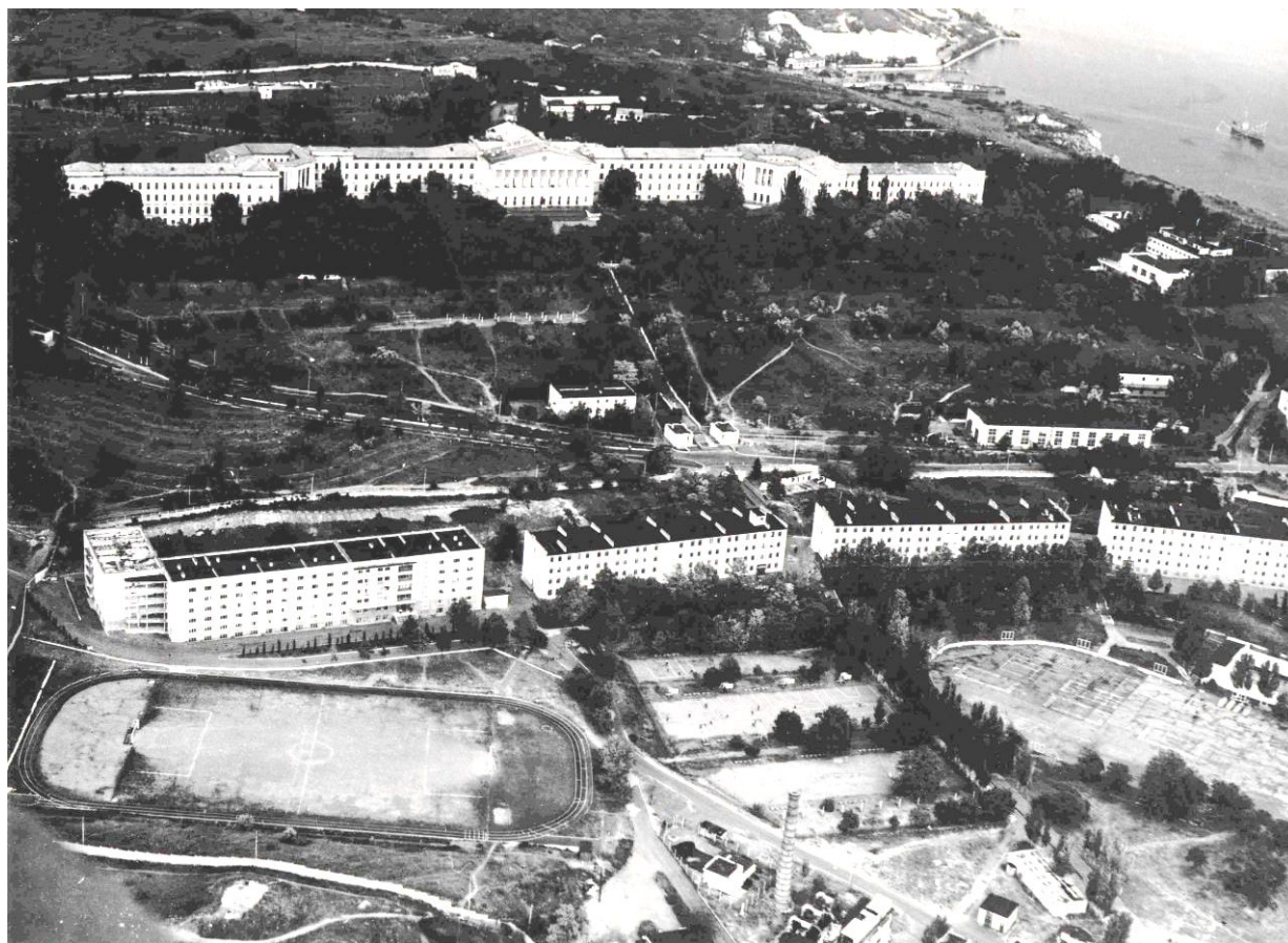
Комплекс зданий СВВМИУ