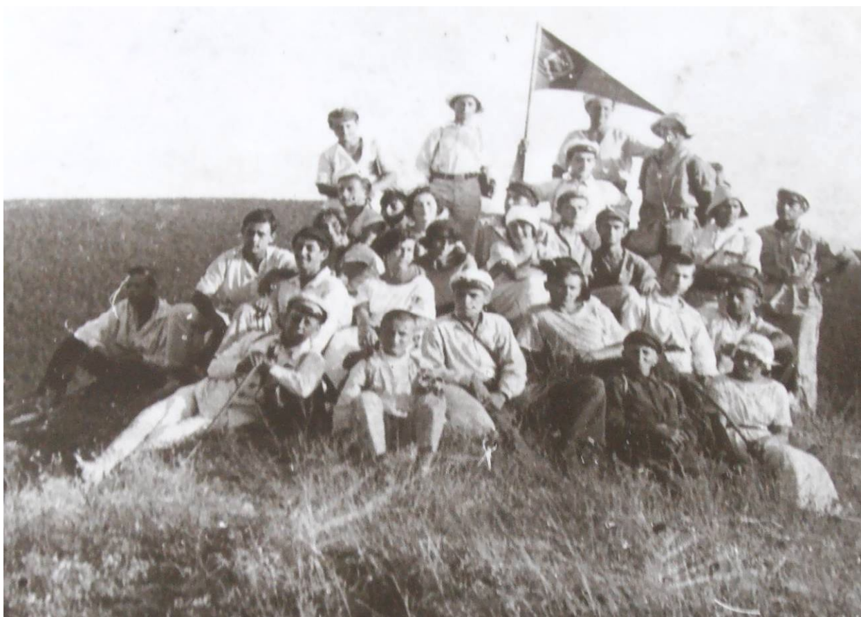
Рис. 5. Экспедиция историко-археологического сектора СМК на Эски-Кермен, 1924 г.