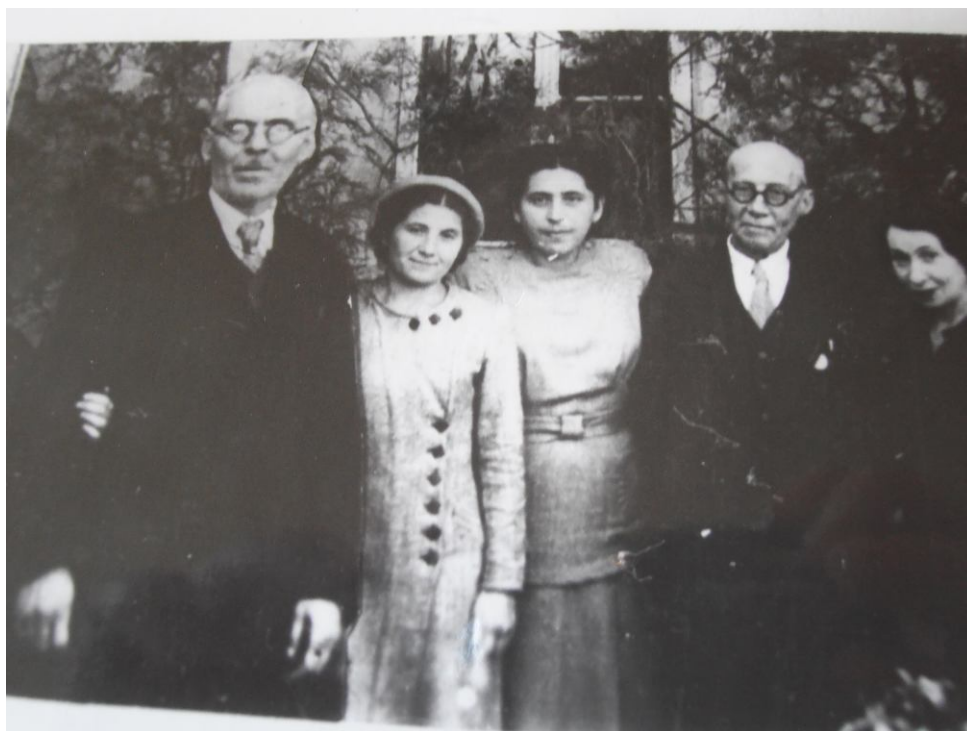
Рис. 12. В.П. Бабенчиков с сотрудниками Крымского областного краеведческого музея, 1947 г., из коллекции Э.И. Соломоник