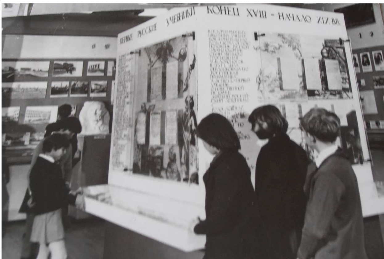
Рис. 13. Школьники знакомятся с историческим разделом экспозиции Севастопольского межшкольного краеведческого музея (СМКМ), 1977 г.