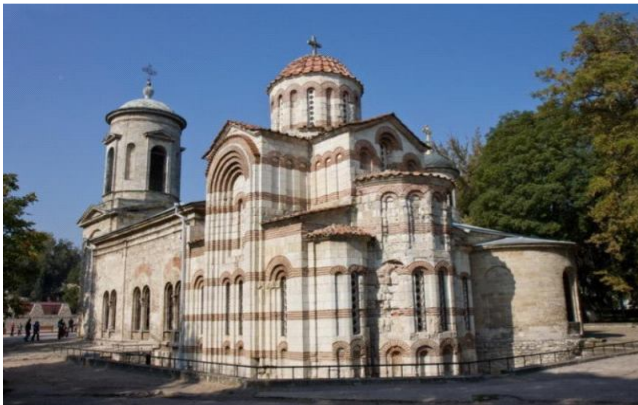
Рис. 1. Храм Иоанна Предтечи. Современный вид