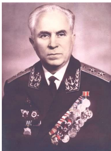
Инженер-вице-адмирал М.А. Крестелёв

Несмотря на то, что создание атомного подводного флота и, следовательно, системы подготовки соответствующих специалистов – эпохальное событие в новейшей истории как с точки зрения развития сил и средств ведения современной войны на море, так и с точки зрения расстановки политических сил на мировой арене после Второй мировой войны, история создания системы подготовки офицеров-инженеров для атомного подводного флота в литературе практически не освещены.