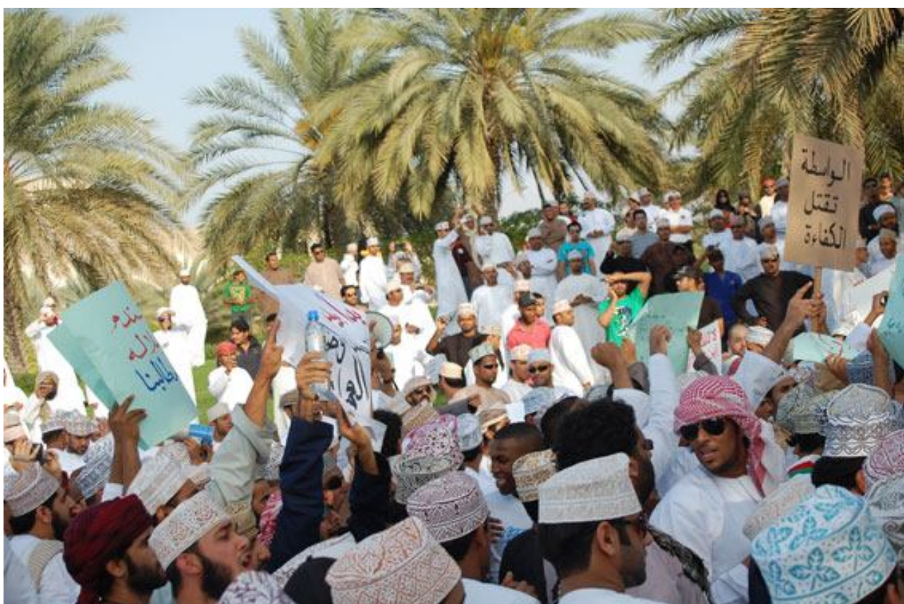
Рис. 10. Лозунги протестных акций в Омане [ http://www.slate.com/content/dam/slate/archive/2011/02/1_123125_122986_2279590_2283219_110218_dispatch_1_ex.jpg ]