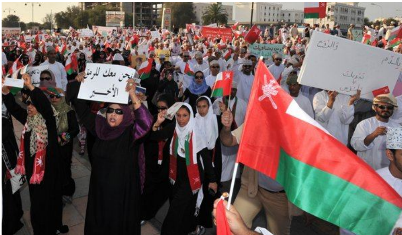
Рис. 9. Лозунги протестных акций в Омане