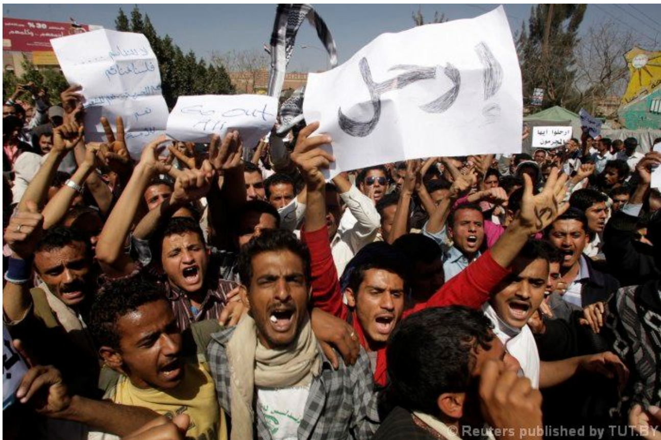
Рис. 6. Лозунги на акциях протеста в Йемене

[ http://www.egypthome.org/upload/medialibrary/165/egyptian%20revolution%20caricatures1.jpg ]