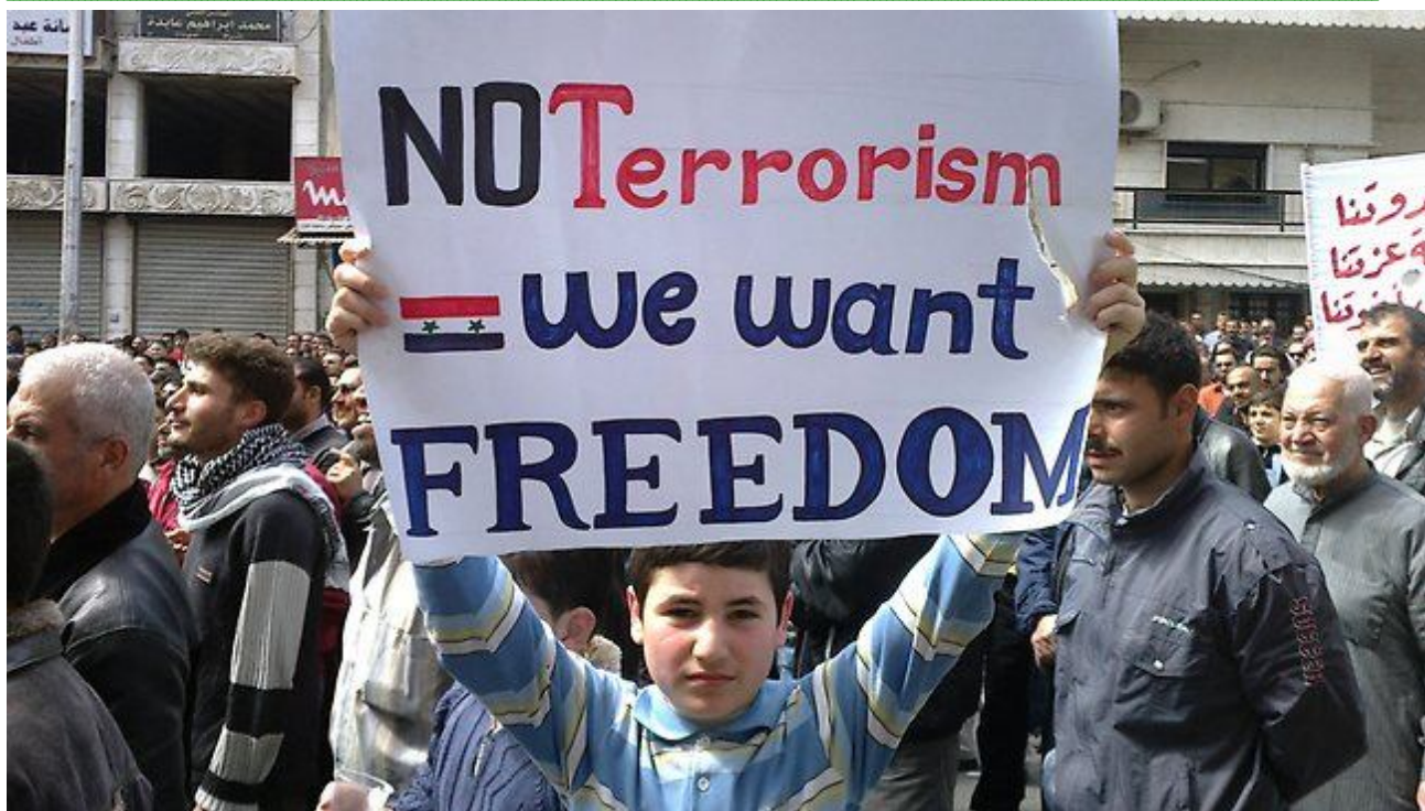
Рис. 11. Лозунги протестных акций в Сирии

[ http://resources3.news.com.au/images/2011/08/01/1226105/685319-mideast-syria-protesters.jpg ]