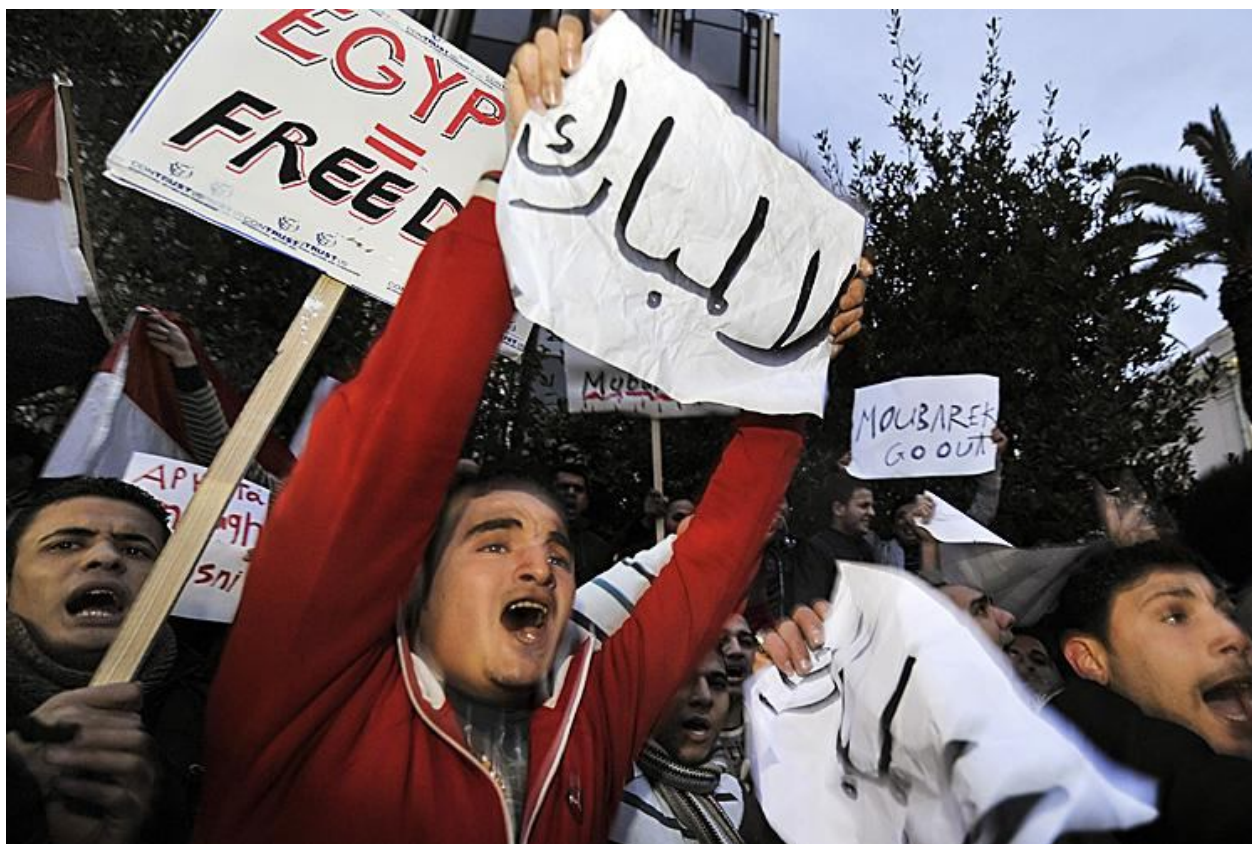
Рис. 4. Лозунги на протестных акциях в Египте [ http://thefrustratedoptimist.files.wordpress.com/2011/02/egypt-picture.jpg ]