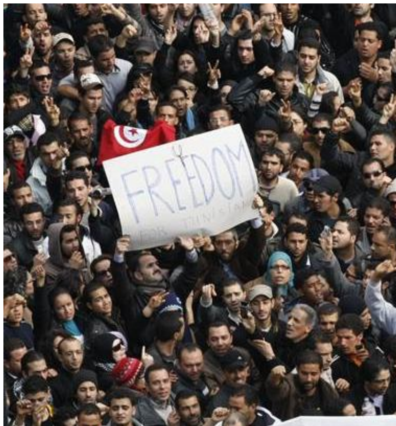
Рис. 1. Демонстрация протеста в Тунисе

[ http://msnbcmedia.msn.com/j/MSNBC/Components/Photo/_new/msnv-110114-tunisia-10a.nv_nws.jpg ]