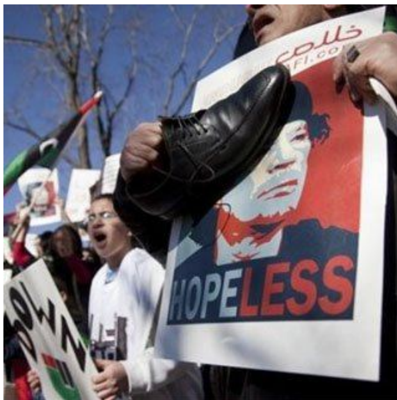
Рис. 16. Оскорбительные образы М. Каддафи на протестных акциях в Ливии [ http://www.xronika.az/uploads/photo_archive/demonstracii-v-livii.jpg ]