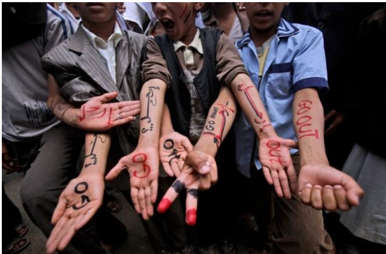
Рис. 7. Протестные лозунги на телах демонстрантов в Йемене