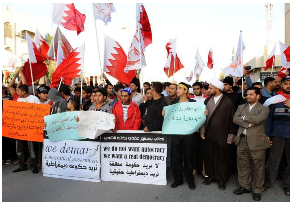
Рис. 8. Лозунги на демонстрациях протеста в Бахрейне