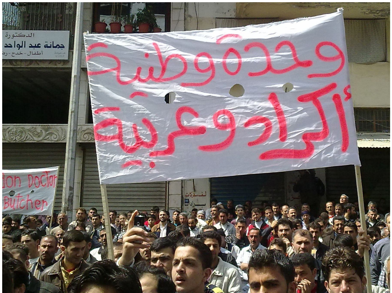
Рис. 17. Рифмованный лозунг на протестной акции в Ливии