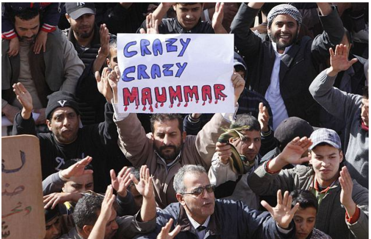
Рис. 14. Лозунги протестных акций в Ливии