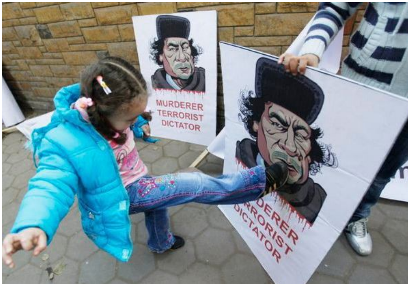
Рис. 15. Лозунги с оскорбительными эпитетами в адрес М. Каддафи на демонстрациях в Ливии