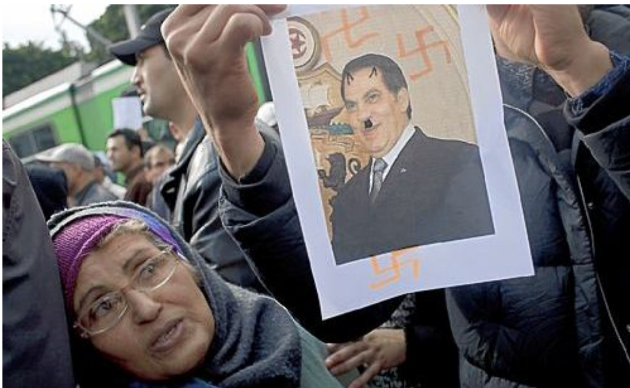
Рис. 2. Изображение президента Туниса Бен Али в образе Гитлера во время уличных протестов

[ http://msnbcmedia.msn.com/j/MSNBC/Components/Photo/_new/msnv-110114-tunisia-10a.nv_nws.jpg ]