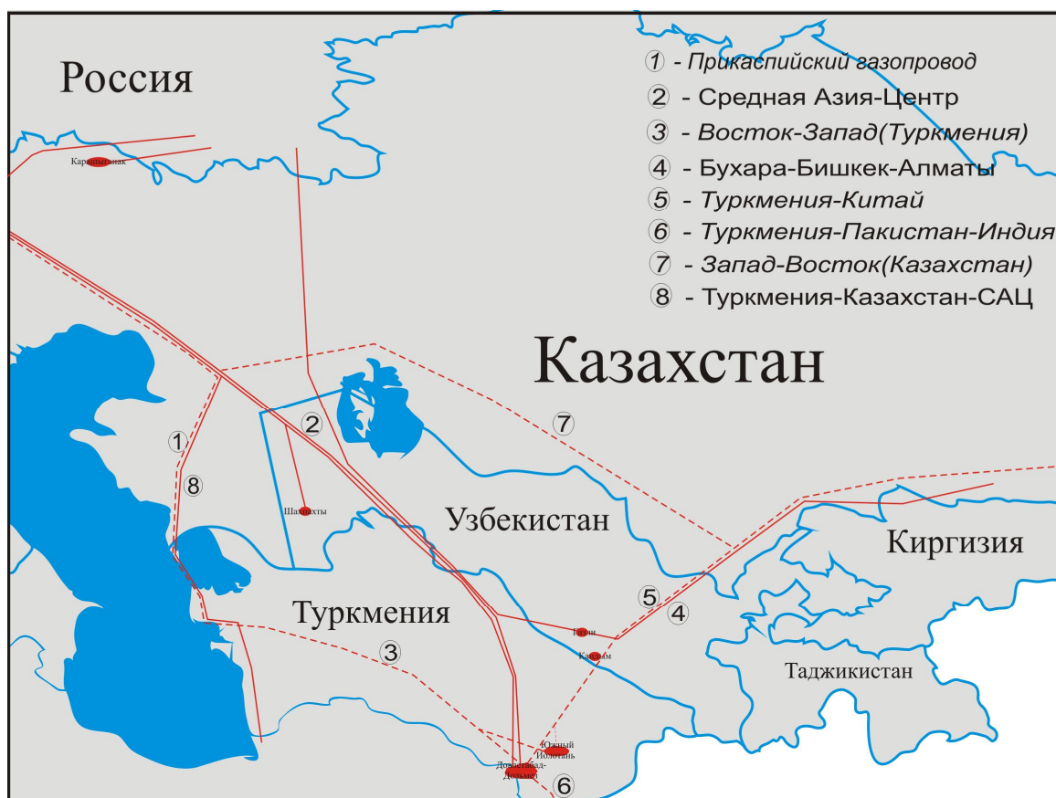
Рис. 2. Карта газопроводов Центральной Азии

Темно-коричневый цвет: изучаемый регион, бывшие республики Советского Союза Коричневый цвет: определение «Центральная Азия» в широком географическом контексте Светло-коричневый цвет: определение «Центральной Азии» организацией ЮНЕСКО