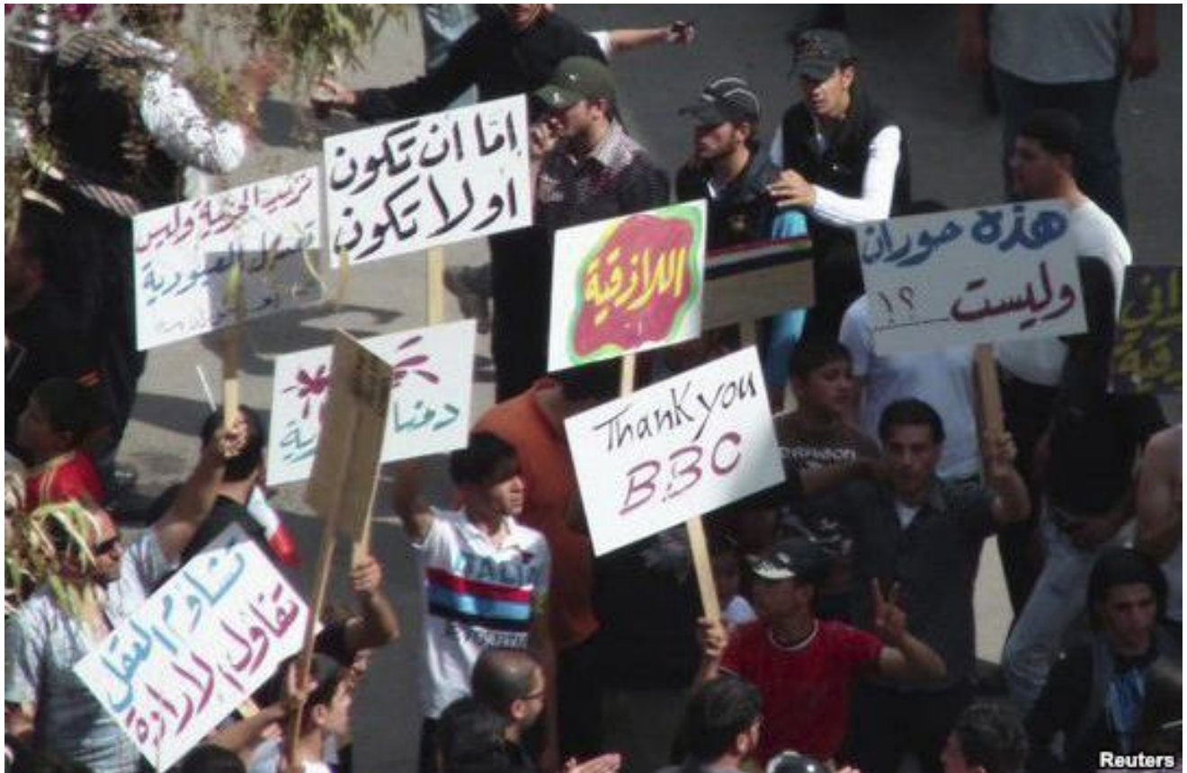
Рис. 13. Плакат «Спасибо Би-Би-Си» на протестной акции в Сирии