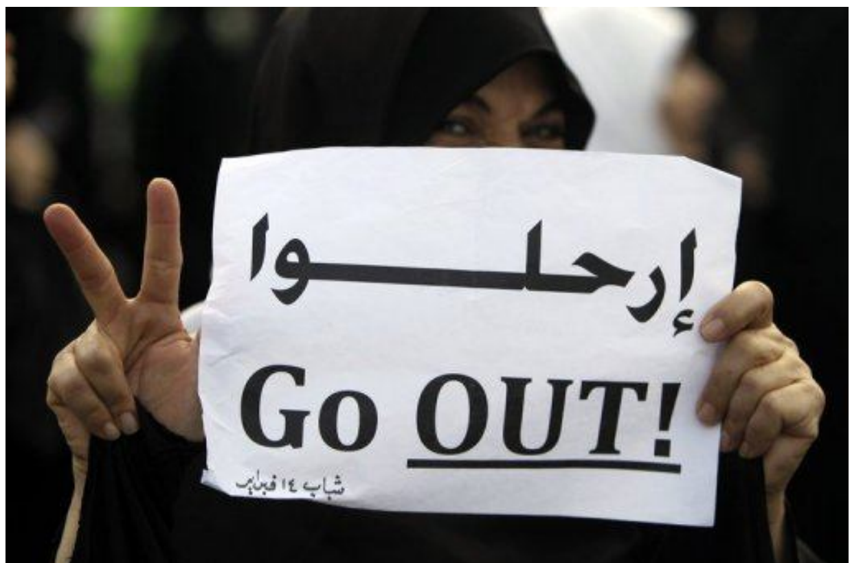
Рис. 18. Двухязычный плакат на протестной акции в одной из арабских стран [ http://www.france24.com/en/files/images/afp/photo_1306926721820-1-0.jpg ]