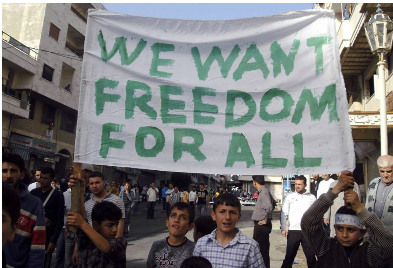
Рис. 12. Лозунги протестных акций в Сирии

[ http://resources3.news.com.au/images/2011/08/01/1226105/685319-mideast-syria-protesters.jpg ]