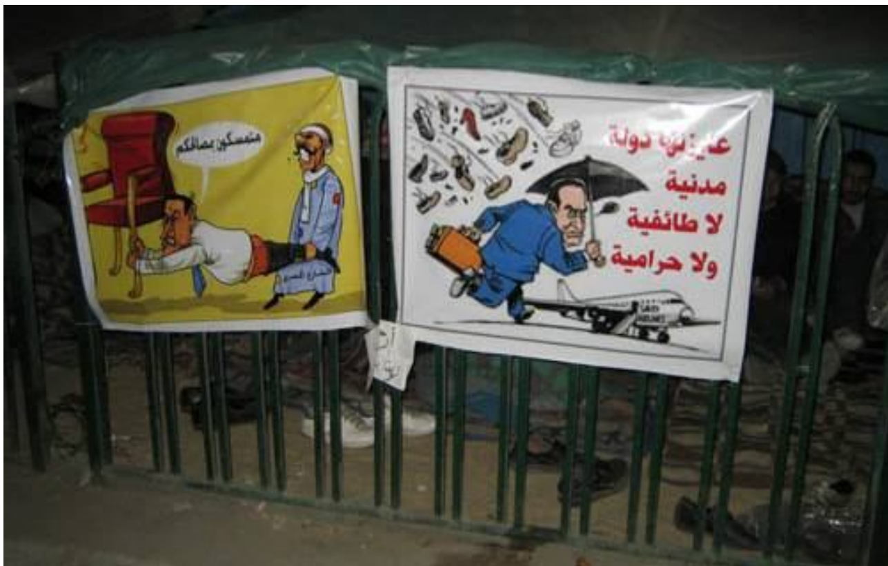
Рис. 5. Сатирические плакаты на протестных акциях в Египте

[ http://www.egypthome.org/upload/medialibrary/165/egyptian%20revolution%20caricatures1.jpg ]