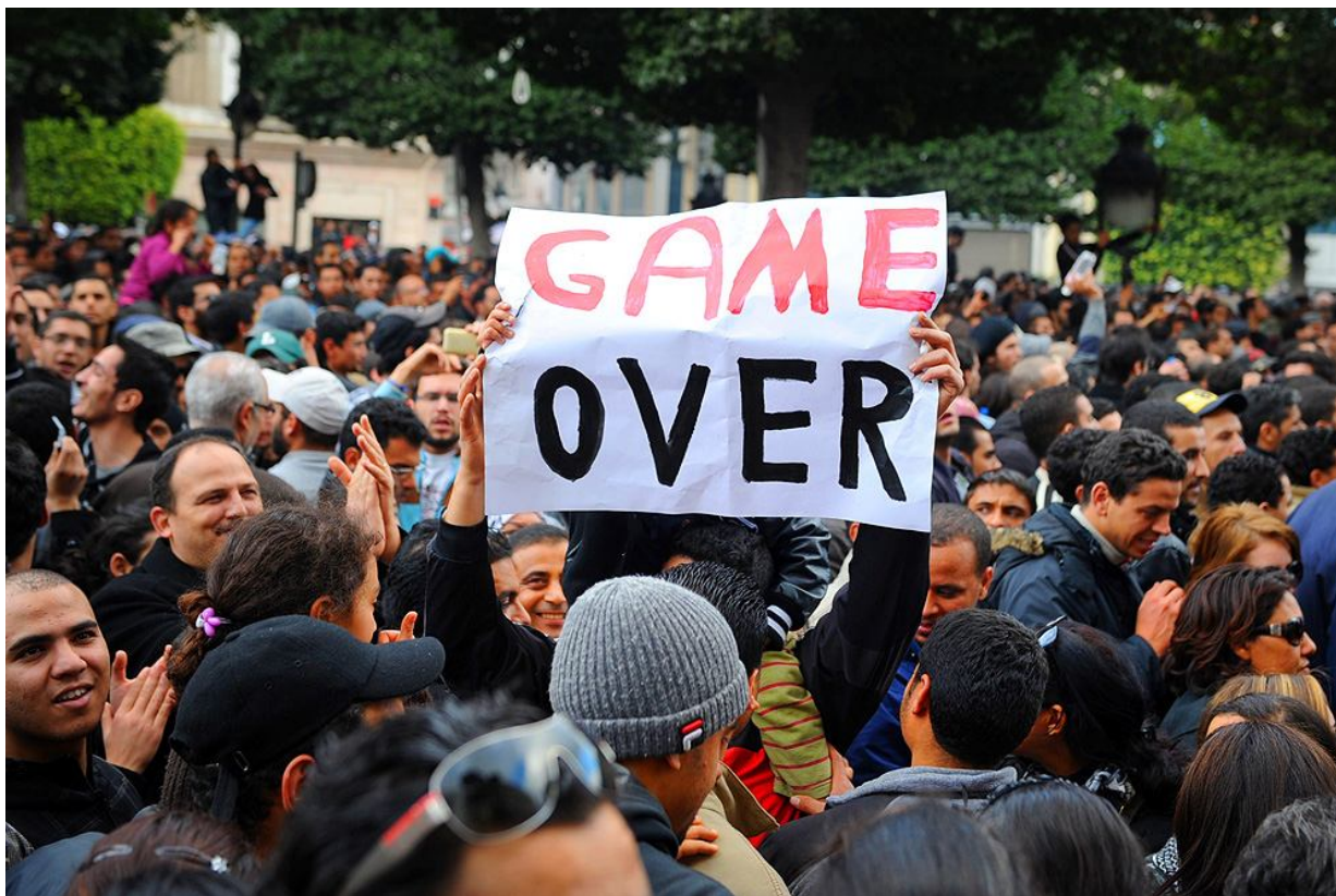
Рис. 3. Англоязычный лозунг на акции протеста в Тунисе