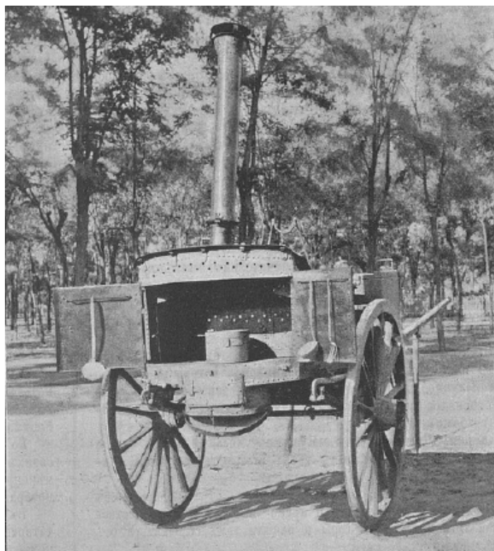
Фото 1. Похідна офіцерська кухня-двоколка системи М. Мерцалова. Вигляд ззаду, з відкритою плитою, лівою духовкою і опущеним піддувалом 25

У статті, присвяченій цій кухні, зазначається, що «похідні кухні для нижчих чинів заведено вже в багатьох частинах військ, під час походу слідує з частиною в обозі I розряду і дають можливість доставити нижчим чинам чай і сніданок, але для офіцерів такі кухні поширені мало, оскільки пропонувані зразки таких кухонь не відповідають умовам похідного життя.