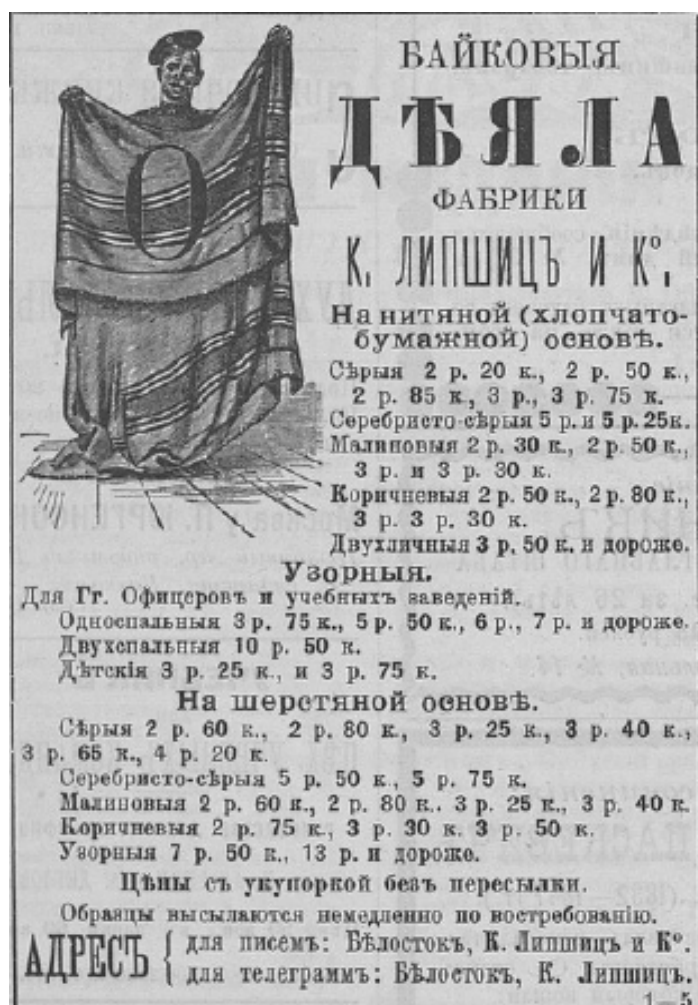
Фото 3. Газетна реклама ковдр для військових у 1896 р. 35

Разом з тим, як засвідчує реклама тих часів, військові частини, які вели своє артільне господарство, мали можливість придбати постільні принадлежности за прийнятною ціною.