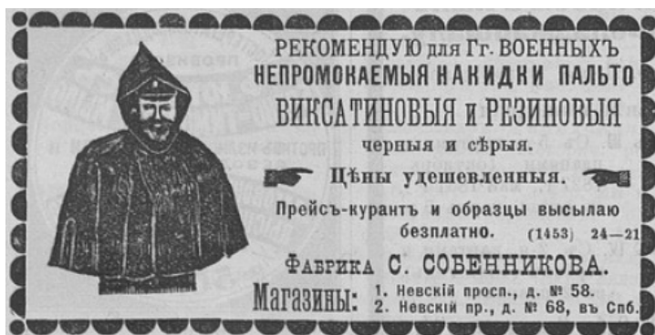
Фото 5. Газетна реклама непромокальних накидок для військових у 1896 р. 39

Одночасно з розвитком ринкових відносин та становленням масового машинного виробництва в побут військових значною мірою входили як нові матеріали для одягу та взуття, так і типові форми військового однострою. Про це свідчить реклама тих часів (див. фото 5).