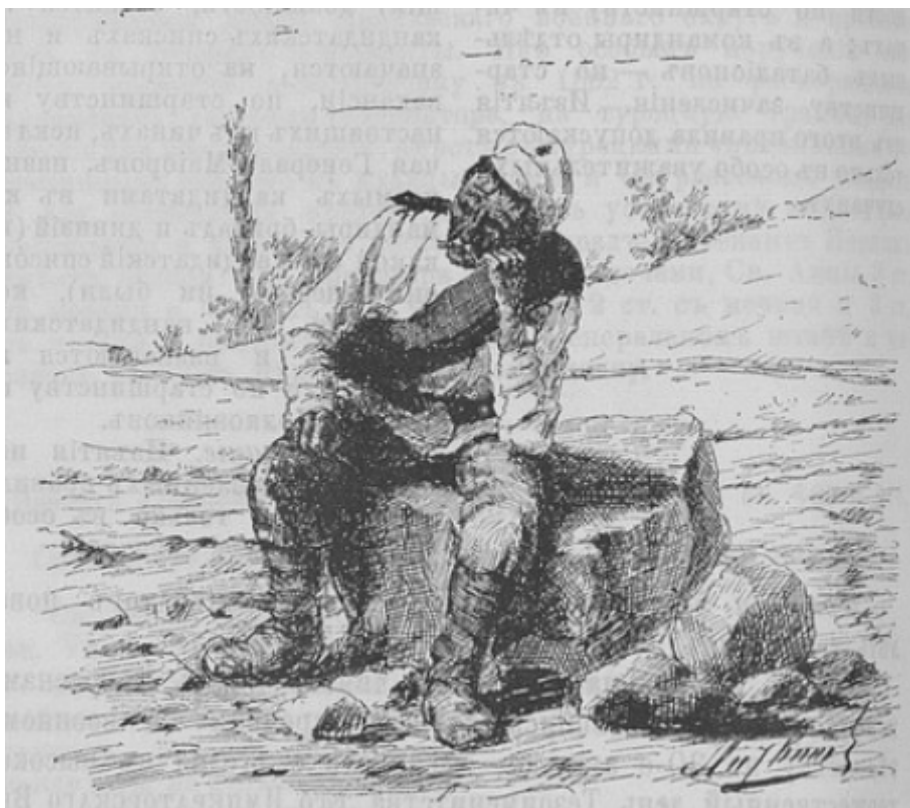
Фото. 2. Відстав 27

Загалом задоволення військовими своїх фізіологічних потреб у їжі під час бойових дій, польових навчань, походу чи на марші, на нашу думку, не можна вважати достатнім. Річ у тім, що для таких випробувань необхідно було мати неабияку фізичну силу і витривалість. Під час значних фізичних перевантажень мало хто звертає увагу на процес приготування страв. Завдяки віднайденому нами зображенню відсталого солдата на марші, можемо побачити, наскільки вимотували людей військові переходи (див. фото 2).