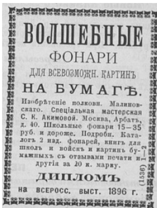
Фото 8. Газетна реклама чарівних ліхтарів 82