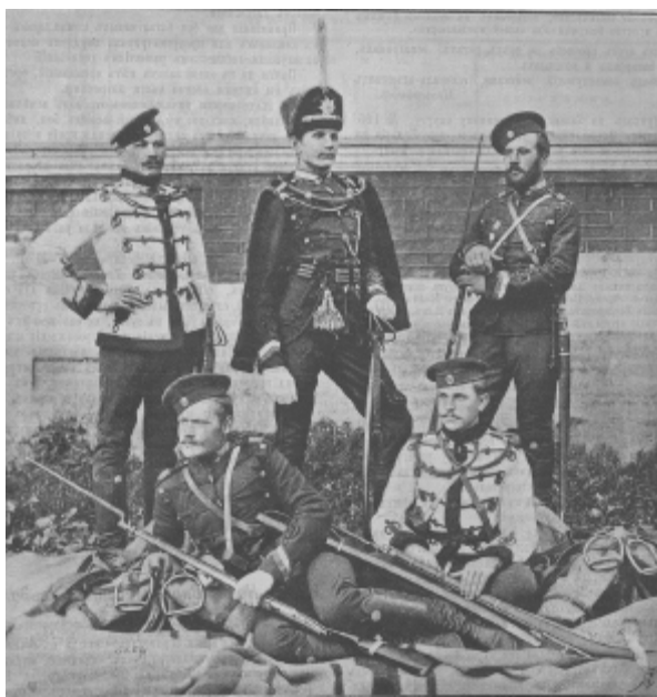
Фото 9. Офіцери лейб-гвардії гусарського полку 88

Нам вдалося знайти фото цих гульвіс у тогочасній військовій газеті.