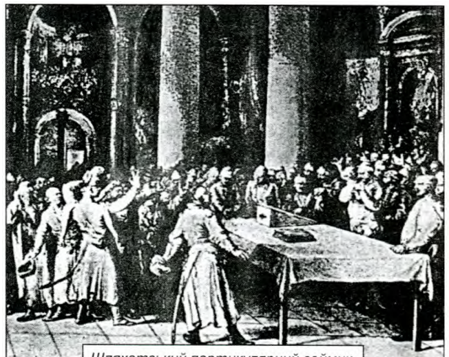
Шляхетський партикулярний сеймик.

Земські сеймики в корінній Польщі беруть початок з XIII ст. з так званих панських віч. (8) Такі організації відомі і на Україні. Наприклад, наприкінці XIV ст. діє Сіверська панська Рада . 26 квітня 1388 року князівсько-боярська Рада Корибута оголошує, що "наша добра рада за згодою, а не приневоленням всього посполства бояр "висловлює послух" великому і славному Володиславу, з Божої милості королю польському і інших земель господарю, і чесній Ядвизі, королівні, дітям його і Короні Польській". (9) З давньоруських часів в Київському князівстві і Волинській землі проводяться з'їзди земледодарів. (10) Походження сеймиків, без сумніву, є польським, хоча є великою подібність до боярських з'їздів, які скликалися великими князями київськими. (11) Сеймики скликаються універсалами королів, наказами воєвод або за ініціативою місцевого шляхетства. Предсеймові