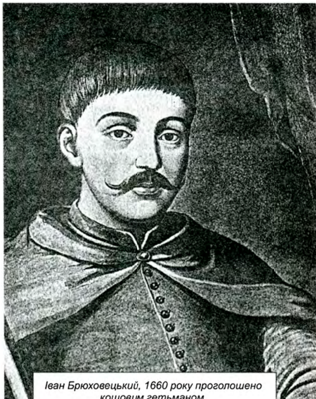
Іван Брюховецький, 1660 року проголошено кошовим гетьманом, український гетьман 1663-1668 років

При Брюховецькому козацьку старшину по полках введено в шляхетську гідність відповідно до старопольських гетьманських традицій, за якими гетьман надавав особисте шляхетство за визначні