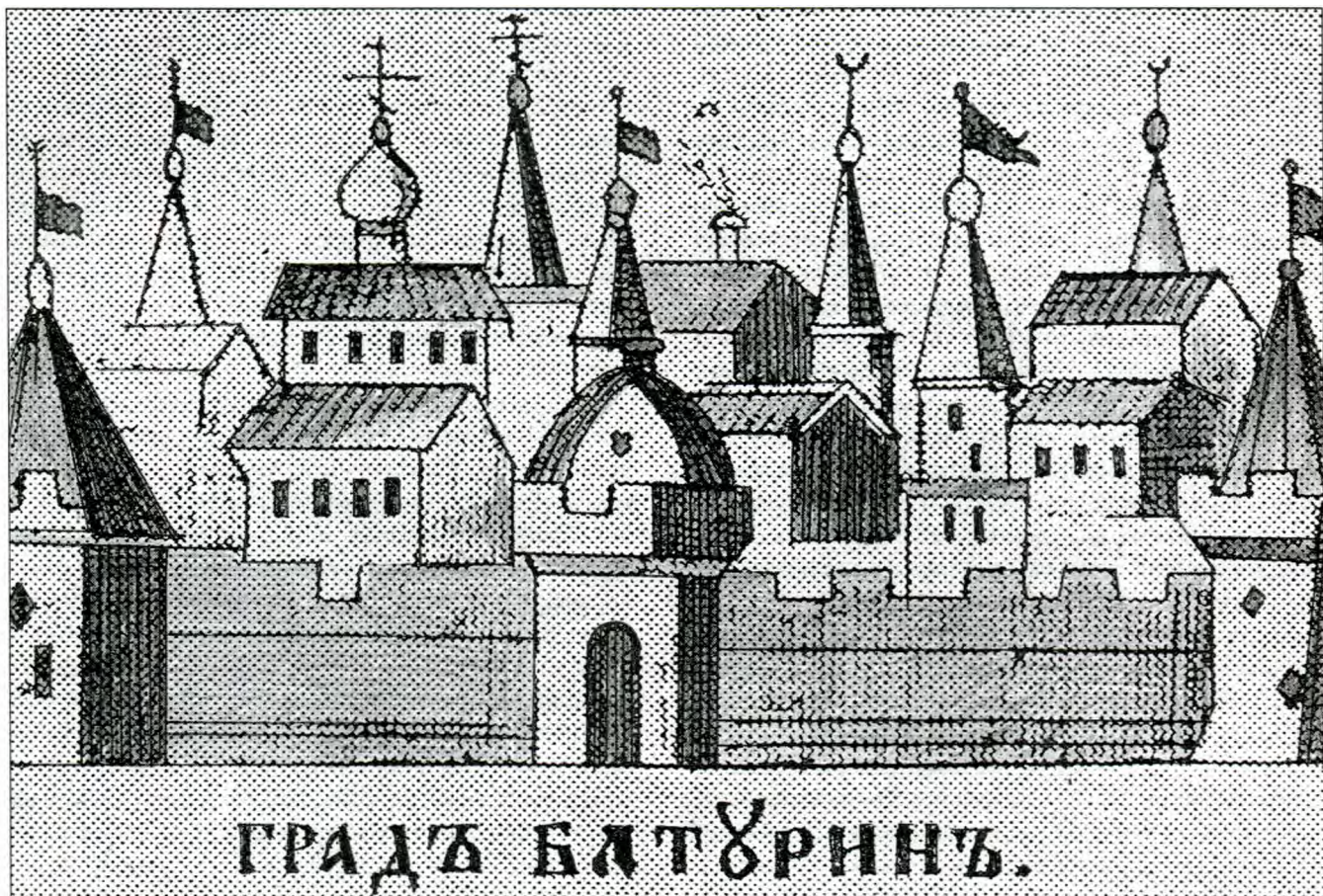
Гетьманська столиця Батурин

Головною функцією Сеймів є кодифікація українського права . Дослідження національного права проводиться в напрямку виокремлення становища і прав українських чинів, військових і земських, вольностей Запорозького війська, прав і привілеїв шляхетства і козацтва, окреслення положення інших станів, законодавчого забезпечення місцевого самоврядування. Підтвердженням існування при Мазепі кодифікованих збірників українських законів є посилання провінційних урядів і судів на українське посполите право. Наприклад, у Стародубській міській книзі за 1 квітня 1704 року зроблено запис про справу про маєтності пана Покорського, вирішену відповідно "до права посполитого." (106) Іноді розшифровуються і називаються правні документи і закони. Основу національного права складає Статут. 20 лютого 1704 року Полтавський полковий суд вирішує справу про ґрунти "подлуг права посполитого відповідно до Статуту коронного князівства Литовського" (107) , а 19 серпня 1684 року Решетилівський міський уряд - "подлуг права посполитого розд. арт. до Статуту Литовського вписаного". (108) При Мазепі місцеві уряди і суди укладають у громадських