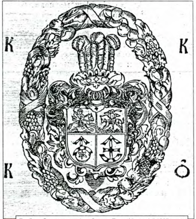
Герб кн. Острозьких, із видання „Лист Мелетія” 1605 року.

Історик українського шляхетства Григорій Полетика пише про надані королівські привілеї українському шляхетству: “Князів і інше шляхетство як римського, так і грецького законів допускати і жалувати в усі цивільні і придворні чини і в саму сенаторську гідність. Наказано сенаторам і князям мати в судах і розправах рівність з іншим шляхетством. Обіцяно гідність і чини Київського князівства не зменшувати і не знищувати, а вільно віддавати природньому місцевому шляхетству. Після цього об'єднання духовні та світські сенатори Київської землі складуть присягу за формою коронної і зобов'язані надалі присягати, а тоді засідати між коронними сенаторами і мати голос. Під час війни шляхетство зобов'язується сформувати своє військо за звичками Польської Корони. Як і в інших воєводствах та в коронних землях місцевому шляхетству дозволено в призначений час проводити сеймики і обирати на них послів, яким збиратися разом в Києві і звіти їхати на Головний Сейм. Наказано при проведенні загальних справ, також на прапорі використовувати коронний герб орел”. (49)