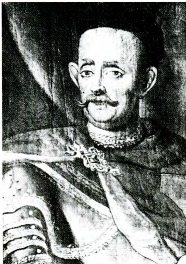
Гетьман Іван Мазепа 1687-1709 років.