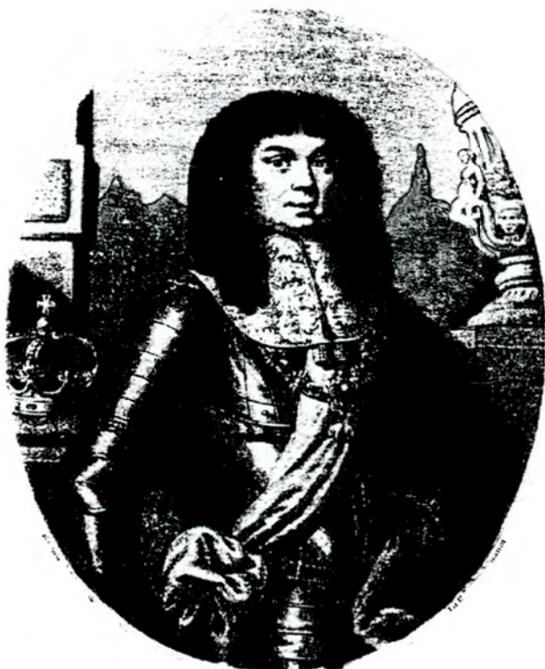
Міхал Корибут-Вишневецький, король Речіпосполитої.

Ряд Варшавських Сеймів було зірвано через вічну в Україні. Таку спробу робить 1649 року Ярема Вишневецький. На коронаційному Сеймі в Кракові відбувається суперечка між королем Яном Казиміром і Вишневецьким, якого король звинувачує у спробі зірвання Сейму. В суперечку було втягнуто надвірного маршалка Адама Казановського. Коли останній не погодився виступити проти Вишневецького, король демонстративно залишив сенаторську палату. (97) Сейм 1652 року мусив розглядати Білоцерківську угоду з козаками, але був зірваний депутатом Січинським (або Сіцинським), який застосував ліберум вето (98) . Сейм 1664/1665 років було зірвано галицьким послом Петром Феліціаном Телефузом (99) В королівській інструкції послові на Вілкомірський сеймик від 11 січня 1667 року сказано, що через неуспіхи в боротьбі за Україну попередні Сеймі були зірвані. Король каже, що Московська комісія вносить незгоду в провінціях Речіпосполитої. (100) З приводу зірвання Сеймів поміж королем і Вишенським сеймиком зав'язується переписка. 3 вересня 1665 року король відповідає вишенським послам про небезпеку