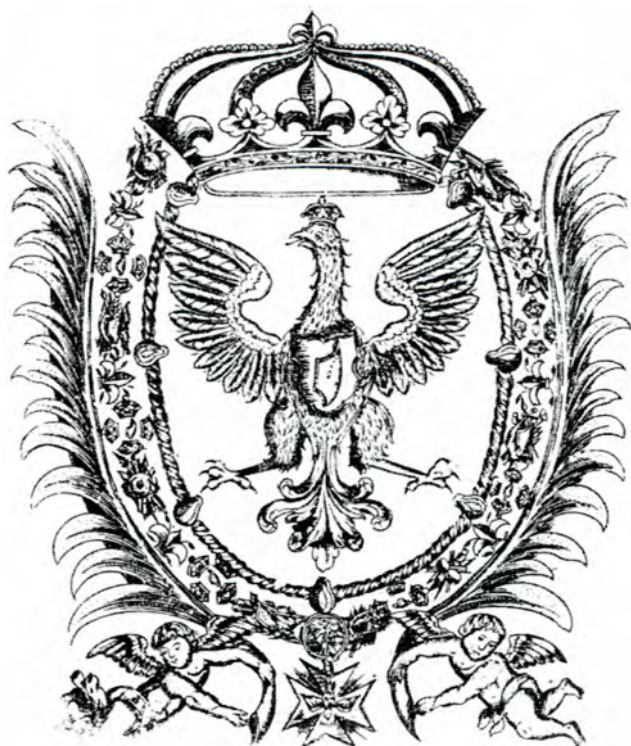
Герб короля Яна Собеського, родом із України, з кн. Salvationes serenissimi invictissimi principis Ioannis III Kraków. 1677.

В останній чверті XVII - на початку XVIII ст. вже окреслені різні соціальні верстви Гетьманщини - шляхетство, козацтво, які є привілейованими станами, низкою переваг володіють міщанство і купецтво. Інших осіб названо посполитими. При Мазепі до шляхетства належить козацька старшина і земські чиновники по праву чина, цивільні та військові поміщики по праву землеволодіння і спадку. У вирішальних статтях Мазепи від 25 липня 1684 року сказано: “Як і до цього часу доручалася шляхетська честь заслуженим людям, щоб вони і надалі при тому чині і честі перебували, а які в майбутньому заслужать, а гетьман і старшина будуть про них бити чолом великому государеві, щоб царська величність побажали дарувати їм ту саму шляхетську честь, а кому за послуги гетьман дасть свої універсали, про таких він разом зі старшиною будуть бити чолом великому государеві Його царській пресвітлій величності про підтвердження універсалів і жалуваних грамот, щоб царська пресвітла величність наказали дарувати їм маєтності і щоб свої царської пресвітлої величності милостиві жалувані грамоти надав”. (9) Відповідно до українського законодавства гетьмани володіють