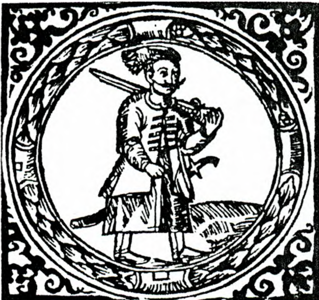
Герб Запорозького війська кінця XVI - середини XVII ст. як символ Української Речіпосполитої.

З часом гетьмани набувають новий ступінь самостійності (право міжнародної діяльності, культура), разом з чим збільшується кількість трибунальських урядів. Гетьман отримує право надавати військово-шляхетство з умовою затвердження у Варшаві. Деякі відомості про діяльність Українського Трибуналу знаходимо серед польських коронних архівів. Так, 1590 року Вальний Сейм розглядає питання про діяльність Трибуналу і вносить положення до Конституції про вирішення судових позовів поміж козаками, з одного боку, та українською шляхтою і державцями. Довідуємося, що щорічно на початку діяльності Трибуналу депутати від шляхетства в Трибуналі обирають інстигатора (прокурора).