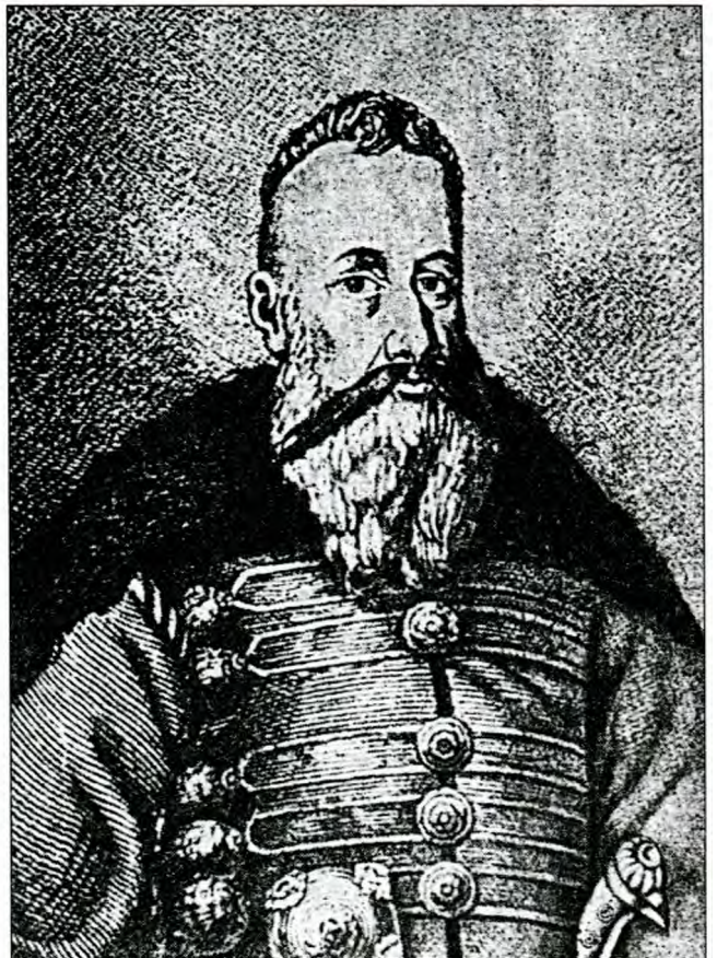
Коронний гетьман Станіслав Конецьпольський.

грамоти на Магдебурзьке право. 1594 року його брат Міхай успадковує від небіжчика по-сультські володіння. Він надає статус міста Прилукам, Яблуніві, Миргороду і Хоролу, під його протекцією формується Прилуцький реєстровий козацький полк. 1620 року суд визнає Миргород і Яблунів королівськими володіннями, якими Вишневецькі змушені поступитися. 1632 року успадковує маєтності Ієремія. Трактуючи на власний розсуд королівський привілей він захоплює маєтності сусідів, зокрема 14 травня 1644 року повертає місто Ромен, втрачене його батьком на користь надвірного маршала Адама Казановського. (3) Останній оскаржує захоплення у короля, який відмовляється прийняти прибулого до Варшави Ярему Вишневецького. Тоді Вишневецький висилає на сеймики листи з викладенням заповіданої Казановським кривди. На Луцький сеймик він прибуває особисто і представляє папери на Ромен. Українське шляхетство підтримує князя, засуджує чеха і зрештою ухвалює, якщо Сейм буде заперечувати право Вишневецького на Ромен, то потрібно зірвати Сейм. Король виносить суперечку між Казановським і Вишневецьким на розгляд Сейму 1645 року. Казановський оголошує ультиматум про недопущення обрання