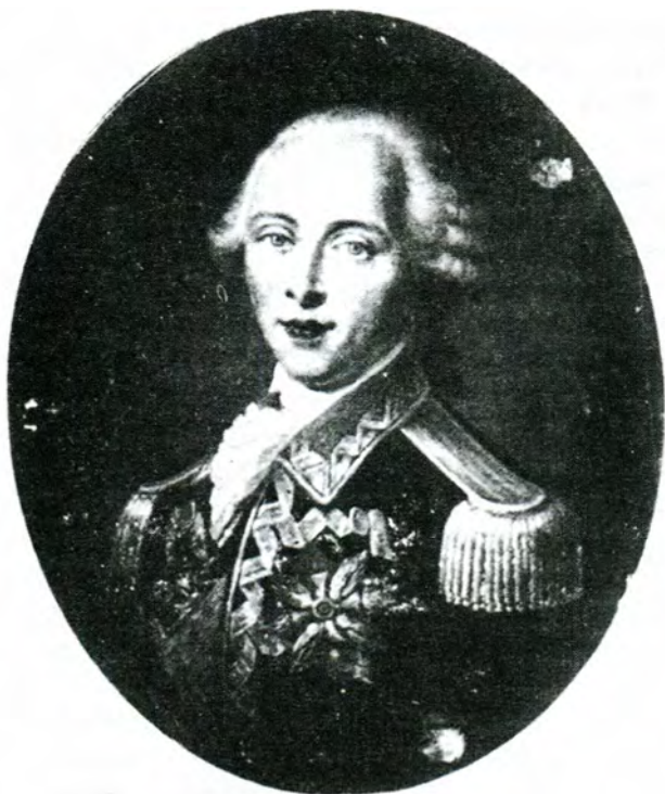
Князь Сангушко, портрет із колекції Вінницького художнього музею.