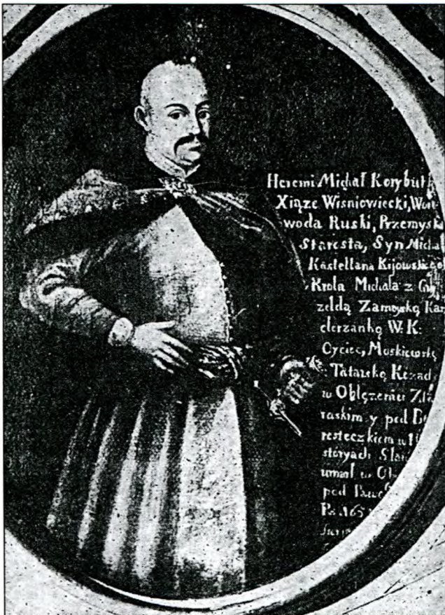
Князь Ярема Корибут-Вишневецький, фундатор і будівник реєстрового козацтва; портрет із Віланівського музею.

Історія рангового козацького землеволодіння простежується з XVI ст. Така форма землеволодіння складає в Речіпосполитій незначну частину. Виписники з козацького реєстру з залишенням старшинського уряду такі маєтності гублять. Разом із цим козаки користуються правом приватної власності на різноманітні угіддя, які вони продавали, міняли, дарували і передавали у спадок. (13) Після Хмельниччини опинилася велика кількість вільних земель, силою відібраних у поміщиків і залишених колишніми володарями. З них утворилися так звані військові землі. Найбільшою такою ділян-