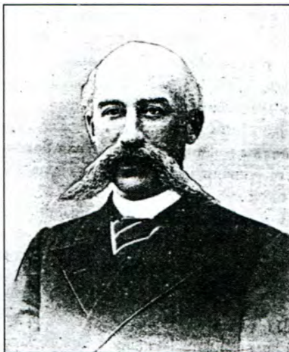
Митрофан Катеринич, пирятинський маршалок і полтавський віце-губернатор.