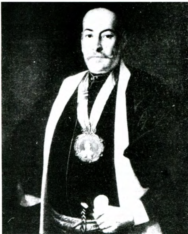
Опанас Феодорович Ковпак, полковник Запорозького війська, олександрівський маршалок кінця XVIII ст

Наприкінці 60 - в 70-х роках в Україні шляхетські вибори проводяться кожних два роки поспіль. Це був час поступової втрати гетьманських шляхетських привілеїв. З ліквідацією Гетьманату скасовано чин гетьманського маршалка. 11 серпня 1767 року президент Малоросійської Колегії Петро Румянцев скасовує розпорядження Розумовського про вибірних від шляхетства членів Генерального суду: "Справи свідчать, що у всі роки, коли діяла ця постанова, в судах рідко коли було повне зібрання всіх десяти депутатів. Вони переважно були відсутніми і знаходили різні причини в своє виправдання". 25 вересня того самого року Румянцев призначає "неодмінних членів" або суддів Гр. Фридрикевича, С. Дергуна, Ол. Безбородька і П. Симоновського, переважно з колишніх маршалків. (4) У внутрішній діяльності шляхетські зібрання керуються "давніми правами" і новітніми сенатськими наказами. В перший період діяльності шляхетських зібрань після ліквідації Гетьманату їхні повноваження обмежуються переважно визнанням гідності місцевих шляхтичів. Широкі парламентарні сеймикові функції відібрано в українського шляхетства. Частково вони повертаються разом із легалізацією земських привілеїв на початку XIX ст. Документи того часу виглядають так: За пропозицією герольдмейстера кн.Олександра Вяземського 31 жовтня 1771 року Сенат наказує Малоросійській Колегії через шляхетські зібрання отримати списки шляхтичів: а) генеральні іменні і по чинам; б) гідних осіб для залучення до справ і подальшої служби; в)