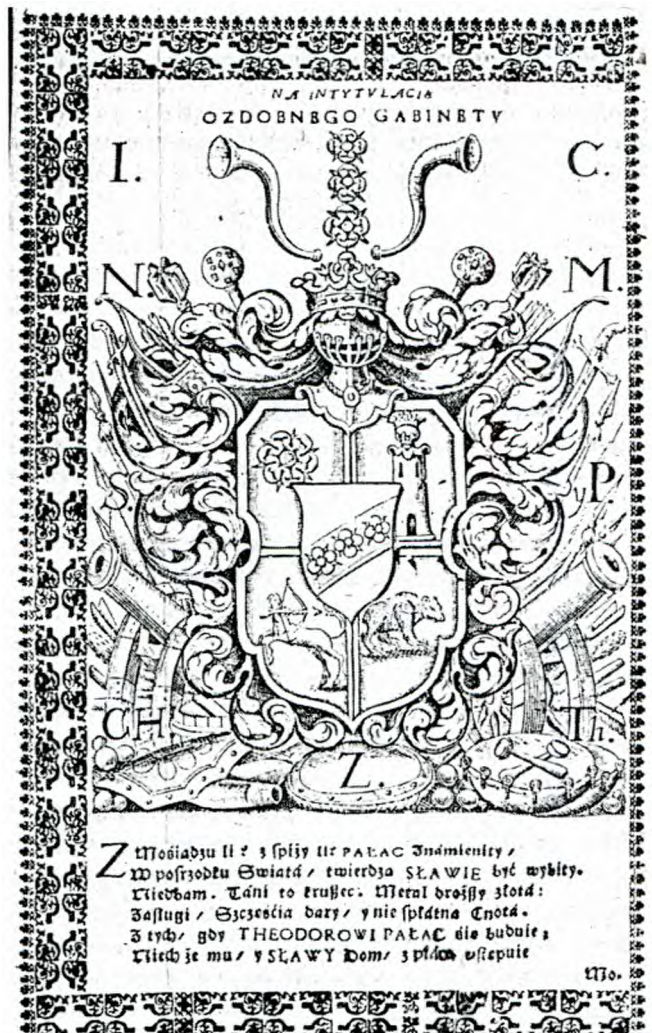
Герб харківського полковника Захаржевського й ілюстрація з київського видання Яна Орновського “Bogaty wirydarz” 1705 року.

Шляхетська гідність передається у спадок. До таких осіб звертаються як до славетно уроджених панів. Король Міхал Корибут-Вишневецький в універсалі каже про повернення “від боку Нашого послів уродженого Михайла Ханенка, тобто уроджених Семена Богаченка і Мартина Донця з товариством”. (43) Борзенський уряд 6 грудня 1664 року проводить судове засідання “в присутності уродженого пана Петра Забіли, судді генерального”. (44) В засіданні “вряду Конотопського”