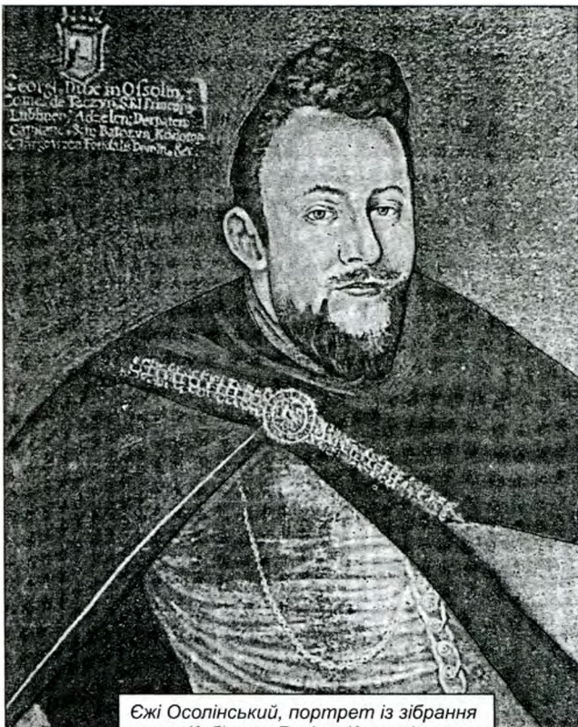
Єжі Осолінський, портрет із зібрання Кабінету Русин у Кракові.

Реформування козацтва проведено королем Стефаном Баторієм за гетьманування Федора Богдана (Teodor Bogdanko). Гетьман був українського шляхетського роду, який поріднився з найповажнішими польськими і волоськими родами. До гетьманування Богданко був волоським господарем, проте не полишав мрії служити в польському королівському почоті. Саме тому він утримував своїм коштом козацьке військо на Поділлі, де перебував частіше, аніж в Молдавії. Його мрія не збулась, і коли турки поставили молдавським господарем Івону, Богданко остаточно пов'язує свою долю з Україною. (114) Саме з тих давніх часів козацької реформи Баторія в Європі поширено думку про Орден “з племені запорогів” як форпост європейської цивілізації. Така думка існувала навіть тривалий час після знищення царицею Катериною другою Запорозької Січі. (115) Історик Романович-Славатинський пише: “Стефан Баторій 1576 року дарує українському (малоросійському) війнству організацію, утворивши генеральну і полкову старшину. Відповідно до 18 артикулу Статуту (в якому сказано “гідності і чини простим людям не давати”) шляхетство злилося зі старшиною”. (116)