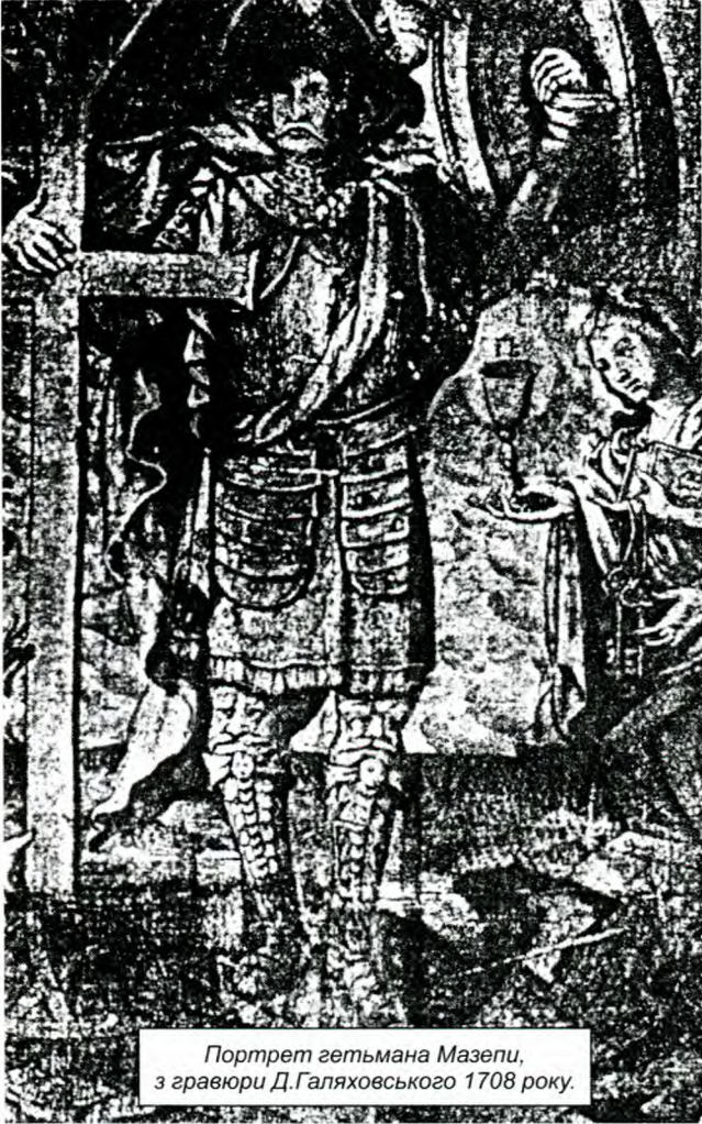
Портрет гетьмана Мазепи, з гравюри Д.Галяховського 1708 року.

за собою всю повноту влади. “Маючи Ми, гетьман,- пише він 26 липня 1687 року в універсалі Саві Прокоповичу,- владу виправляти і встановлювати всілякі в Україні (Малій Росії) порядки, а за гідністю заслужених у війську осіб довольствувати Нашею рейментарською ласкою і кожному затверджувати права”. (27) В універсалі на маєтності миргородському полковому судді від 26 лютого 1689 року Мазепа пише: “Маємо Ми, гетьман, у своїй моці владу всіляку по облаштуванню порядків і кожному у Війську Запорозькому заслуженому контенувати надання ріжних добр”. (28) На вимоги гетьмана Петро перший 17 серпня 1700 року підтверджує давні українські національні права і привілеї, отримані від польських королів. (29)