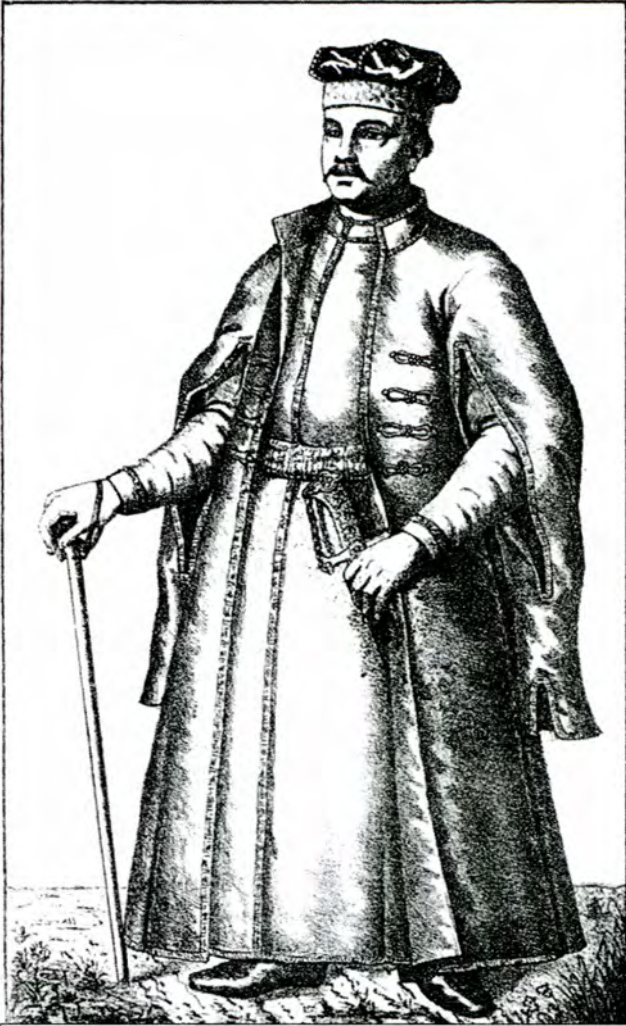
Портрет знатного українського шляхтича Із зібрання портретів часів Гетьманщини Осипа Бодяньського.

1702 року сказано: “Наказуємо всім козацьким підсусідкам, які мешкають в і при дворах козацьких, допомагати в прохарчуванні (кормлении) сердюків, щоб відбували всі посполиті і тяглі повинності, особливо ті, які мають грунти”. (16) В гетьманському універсалі муравському сотникові від 31 січня 1704 року сказано: “Стало відомо Нам, що Ви на своєму уряді... не попускаєте підсусідків у посполиту тяглість і захищаєте їх козацькою вольністю. Це суперечить Нашому наказу в універсалі, надісланому в усі полки, щоб кожний козак залишався при своїй козацькій вольності, а посполиті і кожний підсусідок знав посполиту тяглість. Ми пильно і суворо наказуємо, щоб жодного підсусідка, особливо які на кафедральних грунтах мешкають, не брали в свою оборону і всіх у посполиту тяглість відпустили. Про це за волею нового Нашого універсалу і владою Нашою рейментарською варуємо”. (17)