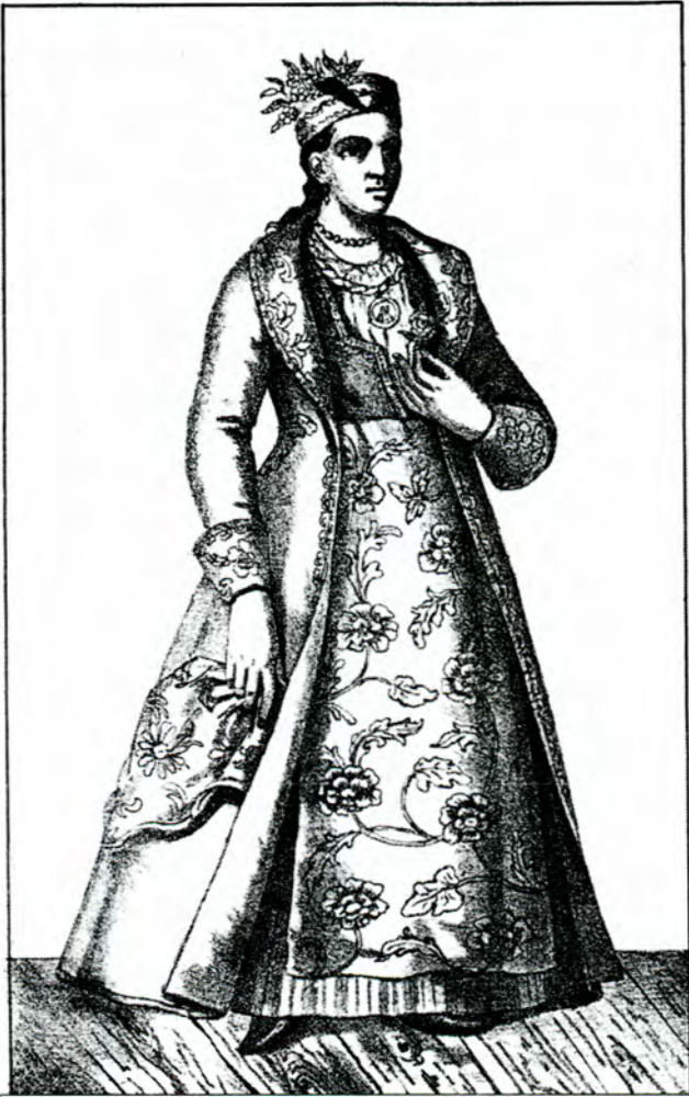
Портрет української панночки.

Із зібрання портретів часів Гетьманщини Осипа Бодяньського