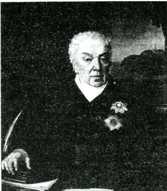
Дмитро Прокопович Трощинський, полтавський губернський маршалок 1811-1814 років, міністр уділів і юстиції, сенатор.