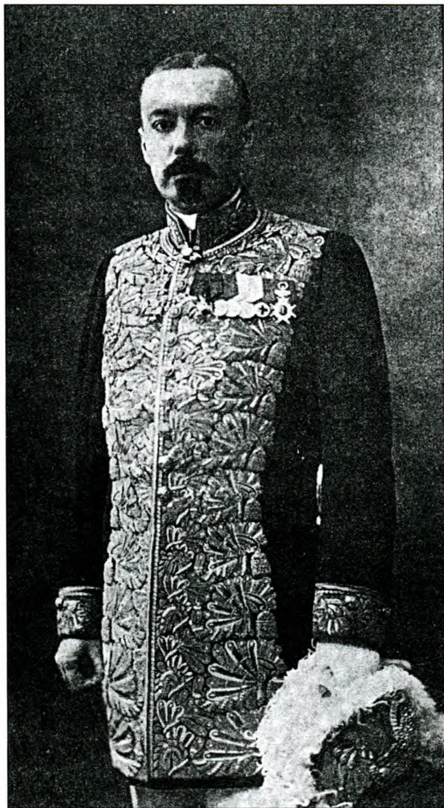
належав Ненасицький поріг.

Основ'яненка виступає з блискучою промовою проф. Потєбня. Ця промова була увертурою до зборів, які відбулися після університетських ювілейних свят. На обіді говорив земець Петрункевич про громадську діяльність і запропонував скласти окрему Комісію для проекту об'єднання всіх опозиційних сил у краї. Саме тому 1881 року земства клопочуться про