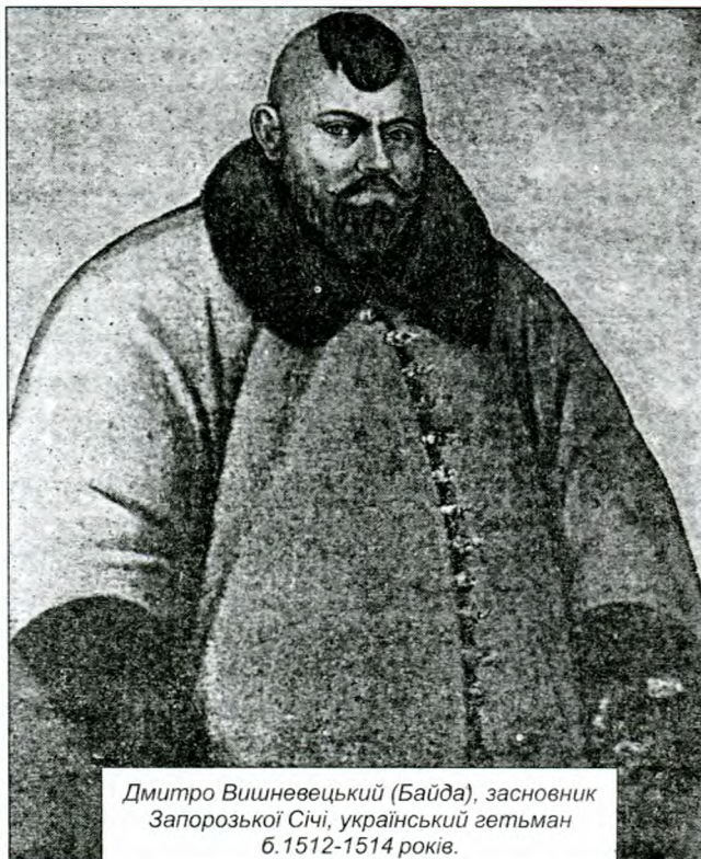
Дмитро Вишневецький (Байда), засновник Запорозької Січі, український гетьман б. 1512-1514 років.