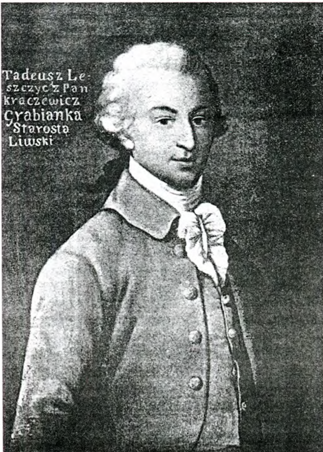
Тадеуш Граб'янка, король "Нового Ізраїля", його син Антоні був плоскирівським маршалком.

Під час шляхетських виборів нерідко оскаржується невірний обрахунок голосів або допущення до виборів осіб, які довели гідність українськими і польськими чинами, але не були затверджені в шляхетстві герольдією урядуючого Сенату. 1816 року граф Мархоцький звертається до С. К. Вязмітінова про нелади під час шляхетських виборів по Ушицькому повіту Подільської губернії. (4) 15 вересня 1817 року подільський цивільний губернатор доповідає міністрові внутрішніх справ про пору-