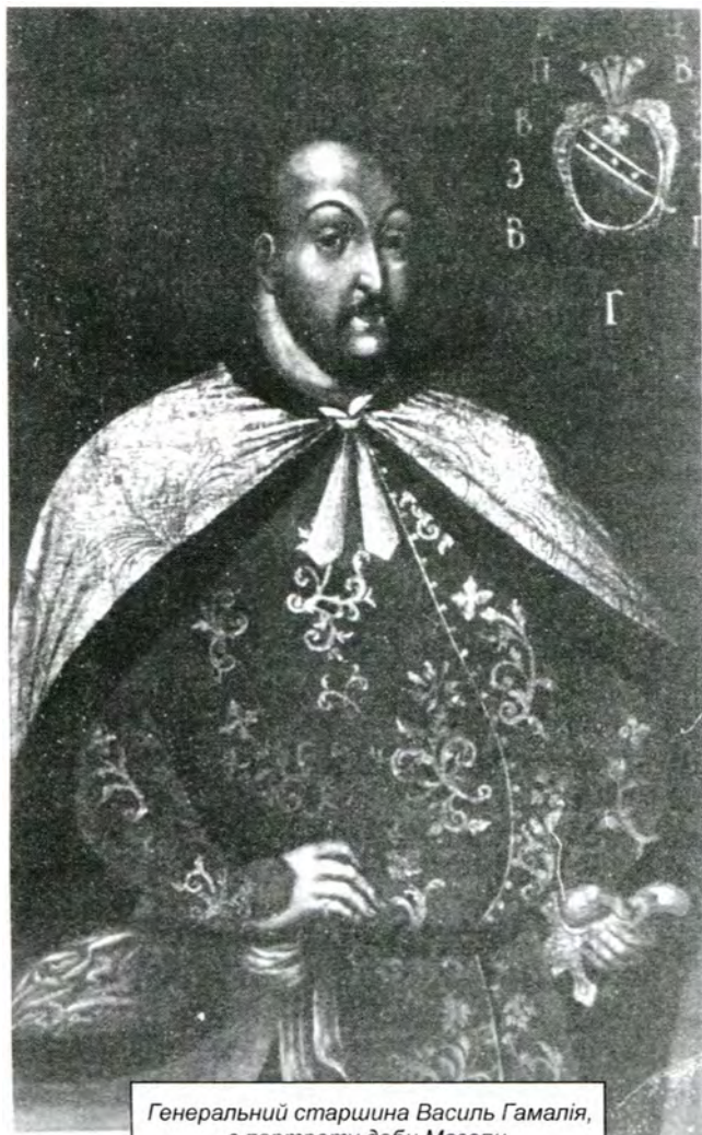
Генеральний старшина Василь Гамалія, з портрету доби Мазепи.

спадкового шляхетства. Значне військово товариство або Орден лицарства , який утворився з молодих вихідців зі знатних родів, не має постійного посту в службі. До гетьманування Мазепи був лише чин знатного військового або просто військового товариша, який носило поважне шляхетство і заслужені у війську люди. Ця назва настільки шанувалася в Україні, що відставна генеральна старшина і полковники називалися не інакше як знатними військовими товаришами, а на громадських або генеральних радах головували над генеральною старшиною і полковниками. Рангом нижче було шляхетство розписане по полках, яке називалося знатними якогось полку товаришами, пізніше переіменованими в значкових товаришів. Небагате шляхетство було розподілене за сотнями, кращі представники якого були названі знатними якоїсь сотні товаришами. Поза шляхетським правом фактично визнавалися лише рядові нечиновні козаки. Для надання честі, вишуканого блиску і захисту гетьманської хоругви і бунчуків Мазепа відновлює чин бунчукових товаришів, записавши його за молодими людьми, дітьми генеральної старшини, полковників і найповажнішого шляхетства. Чин бунчукових товаришів при Мазепі вважався нижче знатних військових або військових товаришів. (101) Обов'язком чиновників таких