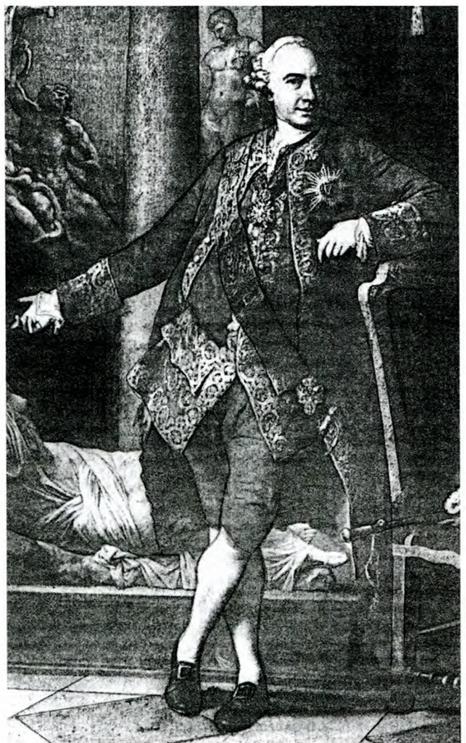
Гетьман Кирило Розумовський 1750-1764 років.

Разом із Мазепою іде в небуття передова європейська культура і традиції в Україні. В часі Північної війни Петро перший ліквідує в Україні трибунальські уряди, сеймики, земські палати, а згодом і статутів суди. Сліди мазепинських інституцій подекуди зустрічаються і в пізніші часи. На початку гетьманування Скоропадського ще діють провінційні уряди, які в 20-х роках перетворюються на магістратські та ратушні правління. 1743 року козацька старшина, яка працює в Глухові над укладанням і перекладом збірки українських прав, пропонує відновити інститут підкоморих і коморників, “як і було раніше”, яких названо межувальниками. Старшина вбачає в цьому “народну користь і потребу України (Малої Росії) в таких персонах”. (133) Історик М.Слабченко стверджує, що після 1709 року “шляхетство билось в судах, навіть перебуваючи в передсмертній агонії, всупереч розуму і наперекір стихіям воно намагалось врятувати автономію рідного краю і підносило ледь не до небес перевагу власних порядків”. (134) Шляхетський