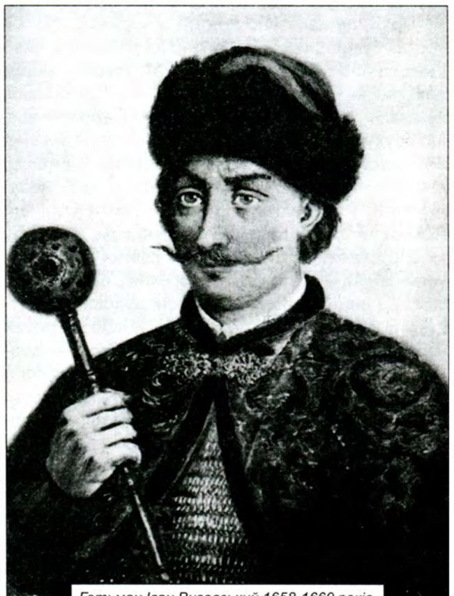
Гетьман Іван Виговський 1658-1660 років.

Великий український державник шляхтич Іван Виговський відновлює діяльність сеймиків і статутних судів та прагне заманіфестувати українську незалежність, чого не зробив його попередник. Серед тогочасних актових паперів зустрічаємо цікаві відомості, що Виговський плекав українські державотворчі традиції не з Хмельниччини, а з попередніх часів. Так, у першому варіанті Гадяцького трактату сказано, що “Річпосполита народу польського, великих князівств Литовського і Українського (руського) і належних до них провінцій відновлюється непорушно, які були перед війною, в своїх межах і при своїх вольностях відповідно до законів”. Переконавшись, що московський цар і чути не бажає про українську самостійність, для