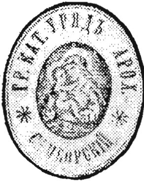
м. Самбір, Самбірський д-т 1892 р.