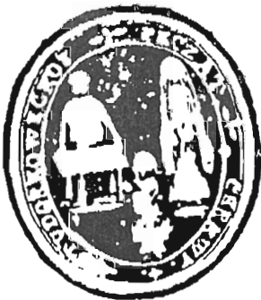
с. Тудорковичі, Варяжський д-т 1885 р.