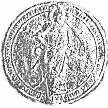
1. Печатка К.Розумовського зразка 1732 р., якою він користувався у 1761 р.