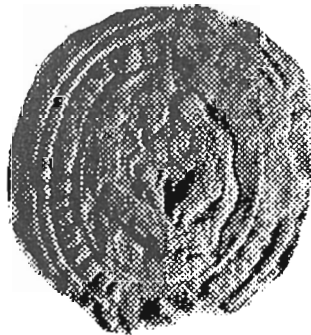
с. Деревня, Жовківський д-т 1885 р.