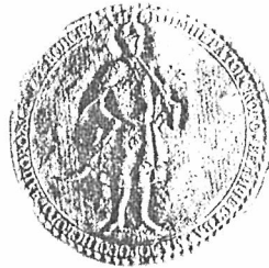
4. Печатка К.Розумовського зразка 1762 р., якою він користувався у 1762 р.