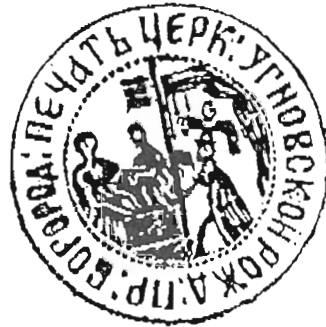
м. Угнів, Угнівський д-т 1879 р.