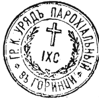
с. Горинець, Любачівський д-т 1914 р.