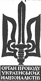
Мал. 1. Емблема ОУН на обкладинці часопису “Розбудова Нації”

На оголошений додатковий конкурс музики гімну в наступні місяці надійшло кілька варіантів, які були розглянуті комісією і найвдаліші (на думку комісії) – опубліковані того ж року у “Розбудові Нації”.