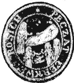
с. Розсохи, Старосольський д-т 1850 р.