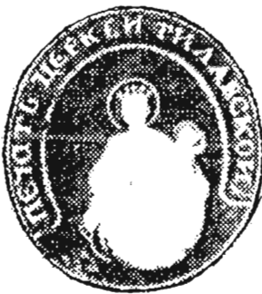
с. Тилява, Дуклянський д-т 1885 р.