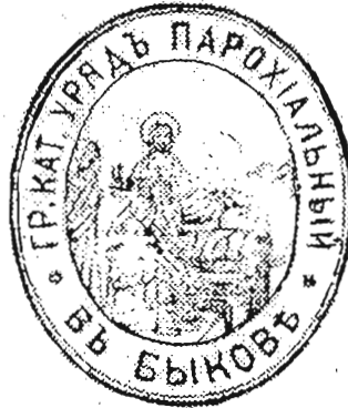
с. Биків, Мостиський д-т 1904 р.