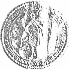
3. Печатка К.Розумовського зразка 1751 р., якою він користувався у 1753–1764 рр.