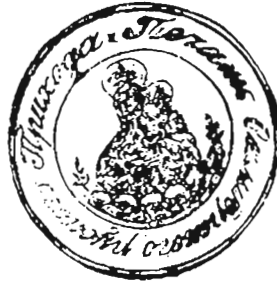
м. Самбір, Самбірський д-т 1875 р.