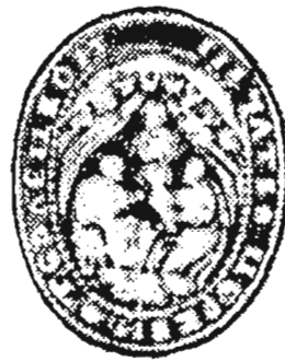
с. Терло, Старосольський д-т 1873 р.