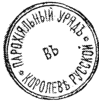
с. Королева Руська, Мушинський д-т 1899 р.