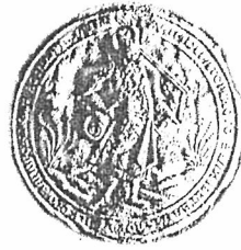
2. Печатка К.Розумовського зразка 1748 р., якою він користувався у 1751–1760 рр.