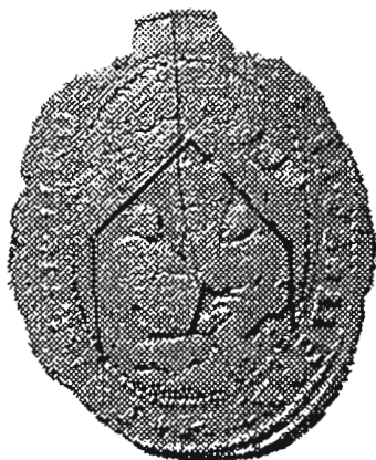
с. Гуменець, Старосольський д-т 1805 р.