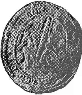
с. Василів Великий, Угнівський д-т 1798 р.