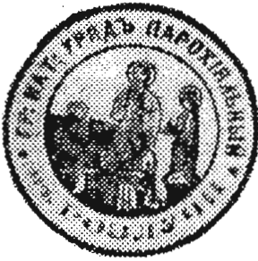
с. Розлуч, Жукотинський д-т 1909 р.