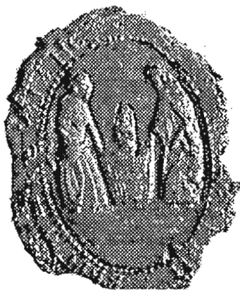
с. Висоцько, Вижне Височанський д-т 1803 р.