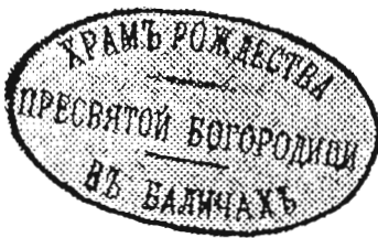
с. Баличі, Мостиський д-т 1885 р.