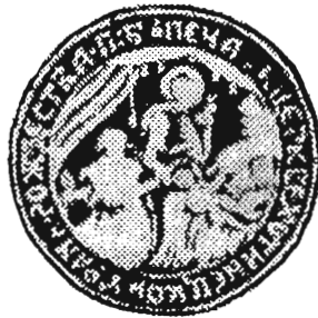
с. Хотинець, Ярославський д-т 1854 р.