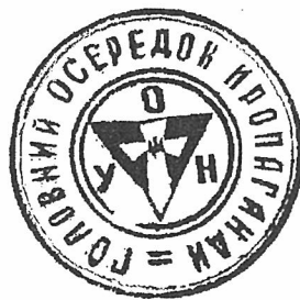
Мал. 2. Емблема ОУН-р з документа від 30 липня 1941 р.

Недатований документ за літо 1941 р. “Членам, симпатикам і прихильникам ОУН” за підписом Крайового провідника містить такий опис емблеми: “Організаційним знаком є: Чорний рівнораменний трикутник підставкою в гору, на ньому