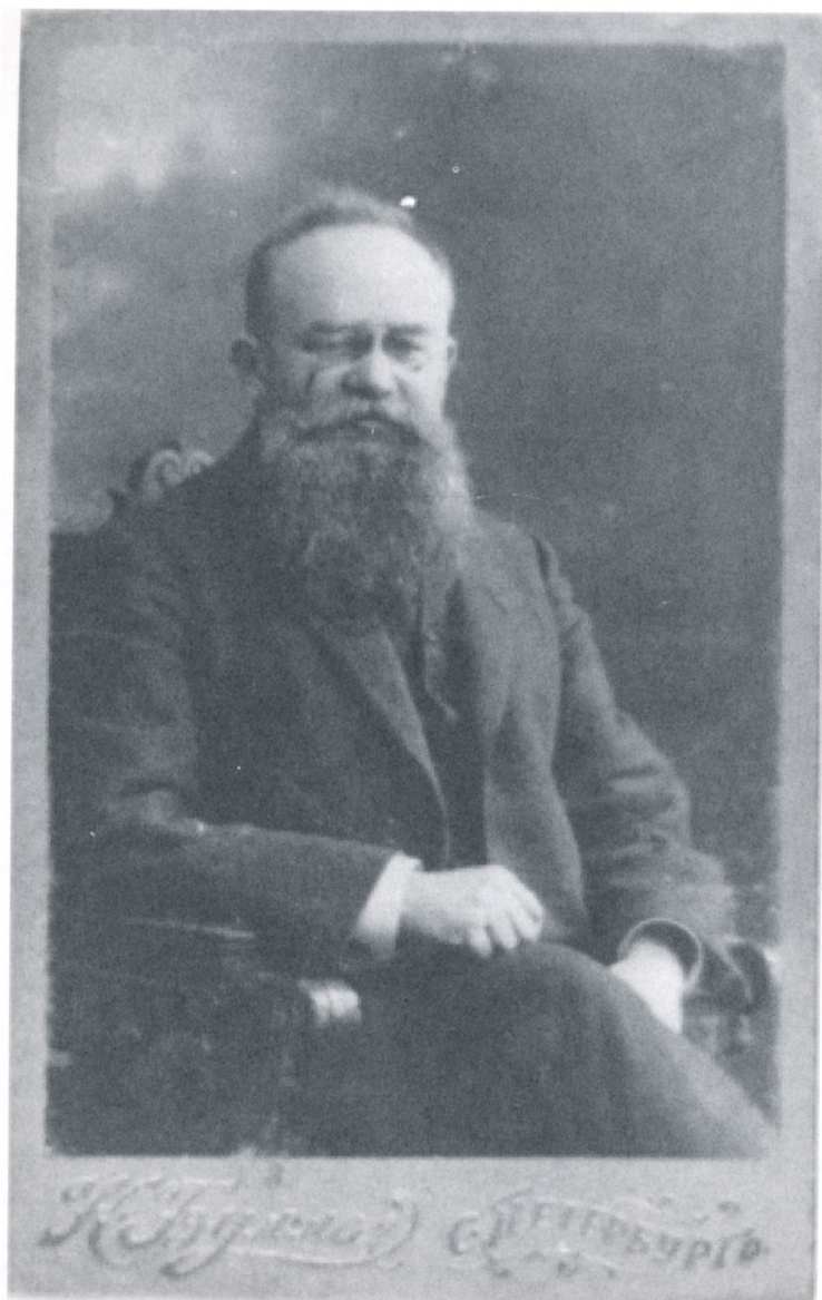
Фотографія Михайла Грушевського приблизно з 1913 року.