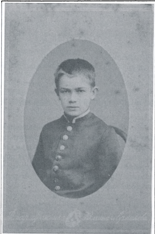
Михайло Грушевський після вступних іспитів до Тифліської гімназії. 1880 р. З іконографічної збірки Історико-меморіального музею Михайла Грушевського. Публікується вперше.

З усіх відомих фотографій Михайла Сергійовича – це третій знімок в його житті. Про перший, який поки що не вдалося розшукати ні в архівах, ні в приватних колекціях, він писав у “Споминах”: “Заховалась зате фотографія, де я приблизно в віку одного-півтора року засідаю на колінах моєї матері. В своїй малій фізіономії я вже ясно пізнаю свої риси – риси мого покійного батька. Фотограф, очевидно, вмів мене розсмішити. Рот мій розтягнений широкою блаженною усмішкою, і очі від сміху зійшлися в узенькі щілочки” 1 . Більш пізня фотографія, де Михайлові вже близько десяти років, зберігається в музейній колекції. На ній він зображений з батьками, братами Захарієм і Федором та сестрою Ганною. Унікальність цього знімка визначається насамперед