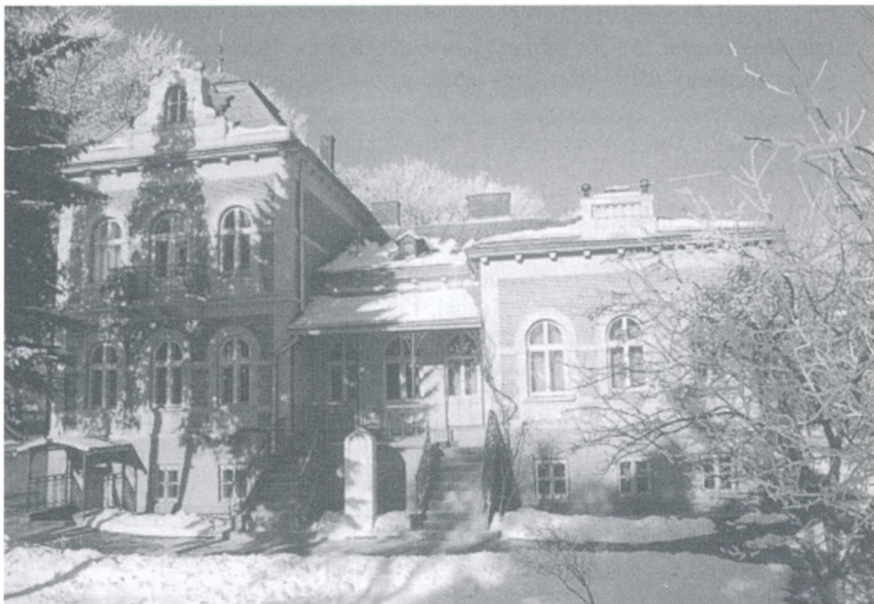
Музей М. Грушевського у Львові, 2001 р.

Зрозуміло, що таке тепле вступне слово проф. Любомира Винара учасникам ювілейної конференції задало високий тон усім урочистостям, а разом із тим викристалізувало думку автора про всеукраїнське і світове значення Михайла Грушевського, що й було предметом заголовної доповіді під тією ж назвою, яку сподівалися почути присутні у стінах Музею. І хоча прикрі трагічні події у США 11 вересня перешкодили нашому другові і науковому консультантові прибути до нас і виголосити доповідь особисто, але його зважене, обгрунтоване трактування цієї важливої проблеми у грушевськознавстві таки прозвучало.