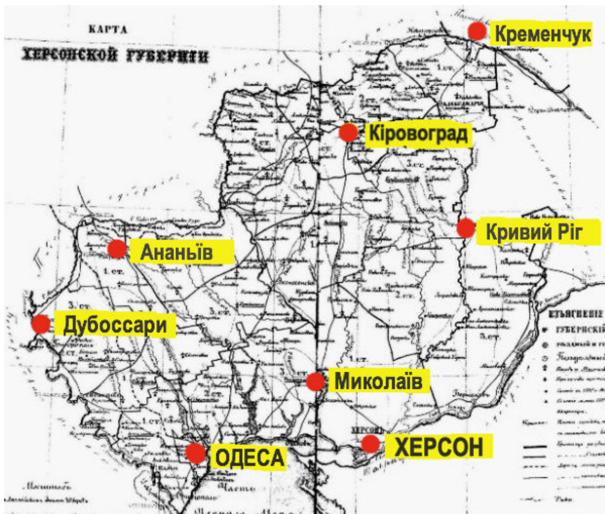
Карта Херсонської губернії

Найбільш строката (а тому і найбільш показова) в етнічному вимірі була Херсонська губернія . До її складу входили сучасні Херсонська, Миколаївська, Одеська, частини Кіровоградської та Дніпропетровської областей України плюс Придністров'я.