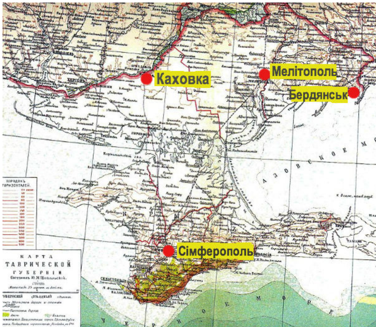
Карта Таврійської губернії

За даними Першого загального перепису 1897 року, українська мова була найпоширенішою ( 42,2% ) у повітах Таврійської губернії. Російська - на другому місці (27,9%), татарська - на третьому (13,6%).