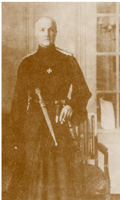
Павло Скоропадський, гетьман України

Сучасна українська історіографія успішно подолала марксистсько-сталінські догми щодо „вирішальної ролі народних мас в історії” й натомість дедалі більше уваги приділяє аналізу значення видатної особи в переломні епохи. Значний доробок у цьому напрямі мають обидва відтинки української історіографії: материкової та діаспорної. Із зрозумілих причин особлива увага приділяється особистісному факторові при дослідженні подій доби національно-визвольної боротьби ХХ ст. Адже саме вони мали своїм наслідком відновлення незалежності України у його останнє десятиліття. Грушевськознавство практично вже набуло офіційного статусу окремого напрямку історичної науки зусиллями Л. Винара і цілої групи науковців з України (І. Гирич, О. Копиленко, Р. Пиріг та ін.). З більшими труднощами, але наполегливо набирають ваги наукові дослідження життя та діяльності С. Петлюри (варто згадати останні праці С. Литвина), інших діячів визвольної боротьби (на жаль, поки що за рахунок публікації минулого доробку діаспорних істориків і дуже малою мірою — вчених України материкової).