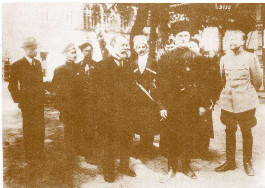
Гетьман Павло Скоропадський з найближчим оточенням