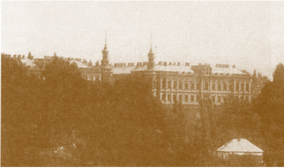
Головне управління Генерального Штабу Гетьмана Павла Скоропадського (вул. Банкова, 11)

кандидат історичних наук, старший науковий співробітник Інституту політичних і етнонаціональних досліджень ім.І.Кураса НАН України, докто- рант Київського національного університету імені Тараса Шевченка