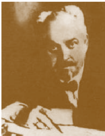
Ігор Кістяковський, видатний державний діяч

кандидат історичних наук, старший науковий співробітник Інституту політичних і етнонаціональних досліджень ім.І.Ф.Кураса НАН України, докторант Київського національного університету імені Тараса Шевченка