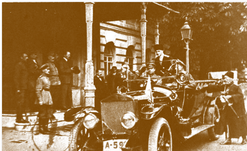
Гетьман Павло Скоропадський оглядає військо