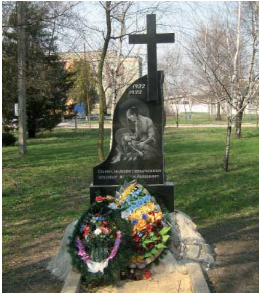
Пам'ятний знак на пошану жертв Голодомору 1932–1933 рр. смт Новомиколаївка Новомиколаївського р-ну Запорізької обл.