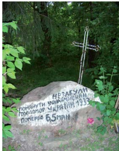
Пам'ятний знак на пошану жертв Голодомору 1932–1933 рр. с. Кірове Іванківського р-ну Київської обл.