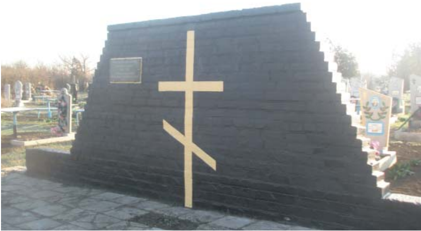
Пам'ятний знак на пошану жертв Голодомору 1932–1933 рр. с. Варварівка Гуляйпільського р-ну Запорізької обл.