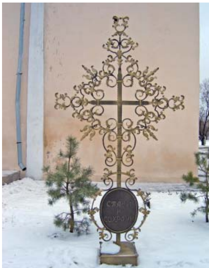
Пам'ятний хрест на пошану жертв Голодомору 1932–1933 рр. Автор-виконавець А. Семибратський. м. Чугуїв Харківської обл.