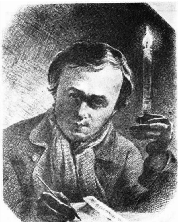
ТАРАС ГРИГОРОВИЧ ШЕВЧЕНКО