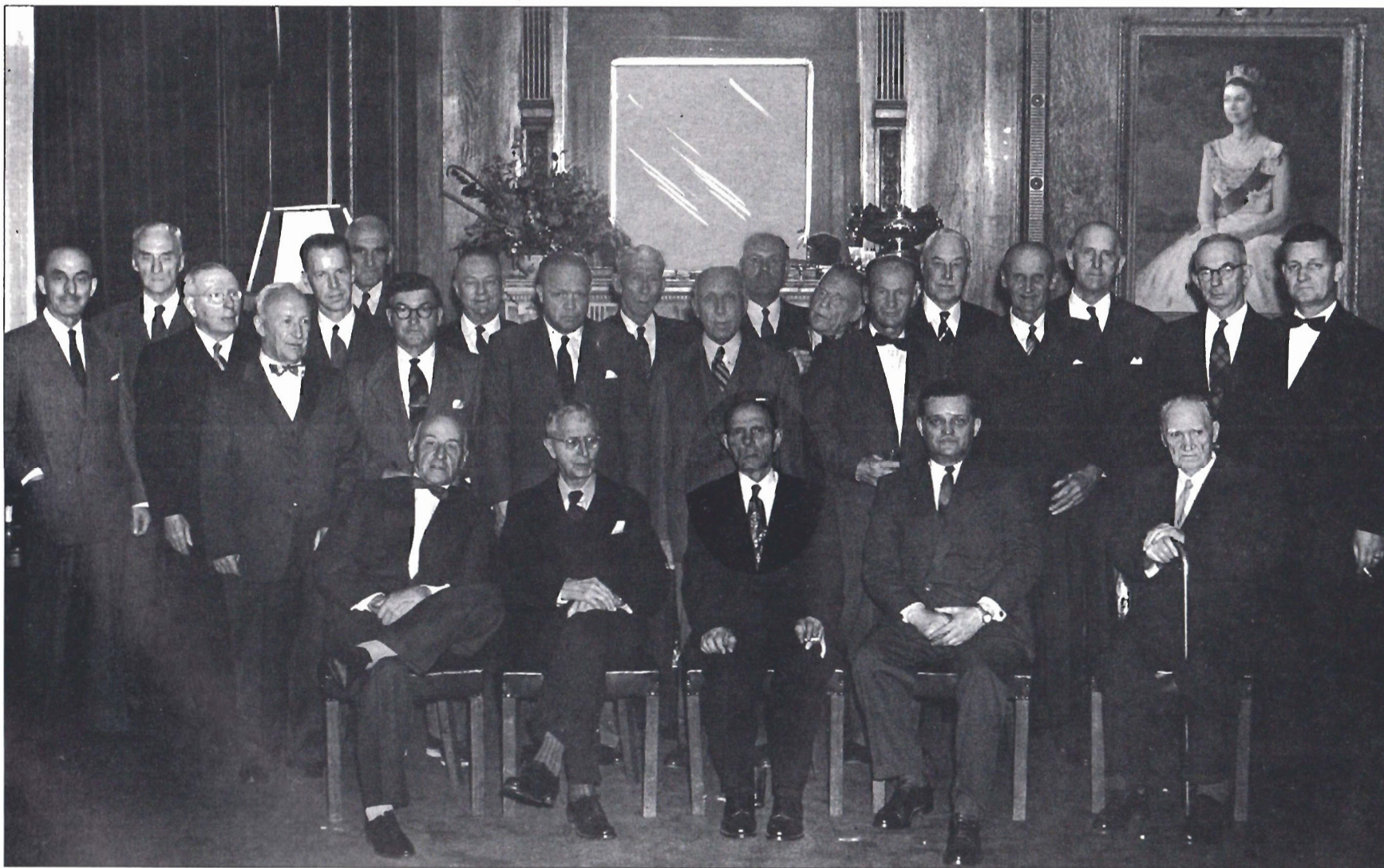
A hero among heroes