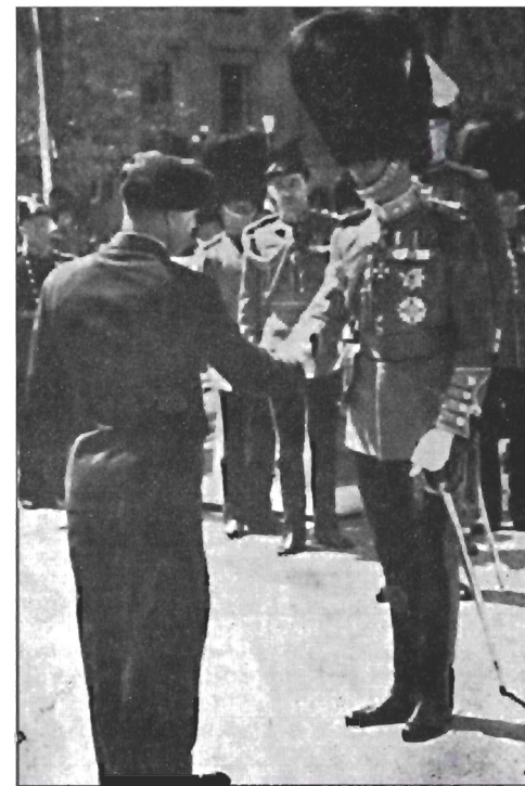
Meeting His Majesty King George VI, Ottawa, 1939

Le 47e bataillon d'infanterie du Canada est devenu aujourd'hui le régiment Royal Westminister, à New Westminister, en Colombie britannique. Le 77e bataillon est devenu les Governor General's Foot Guards, à Ottawa.