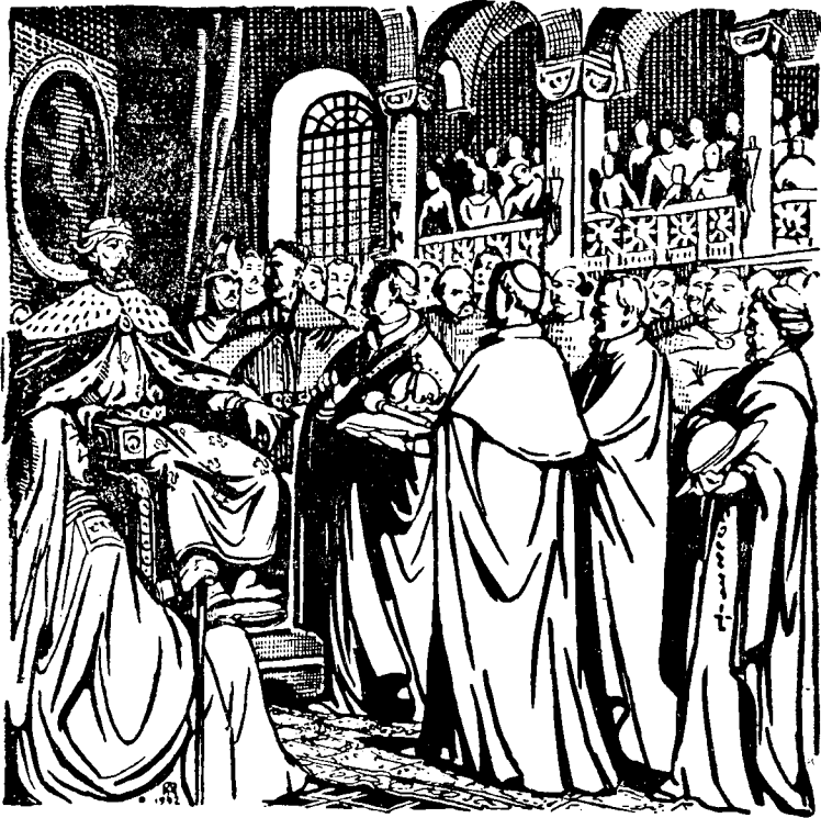
Папські послы приносять Данилові королівську корону

— Сину, прийми від нас вінець королівства! Матимеш поміч від св. Вітця.