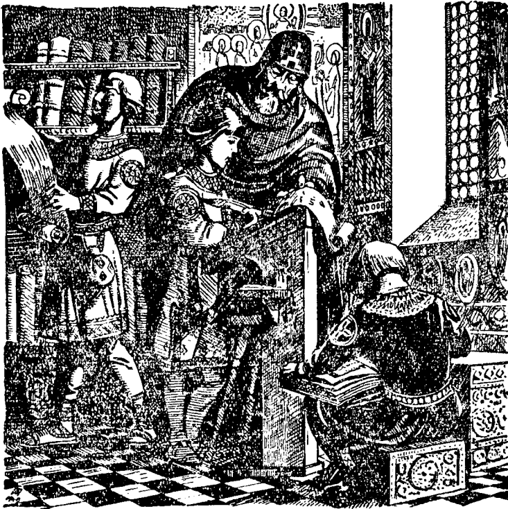
Княжичі прикладаються пильно до науки

били цю нашу окраїнну землю і старалися зробити її багатою й щасливою.