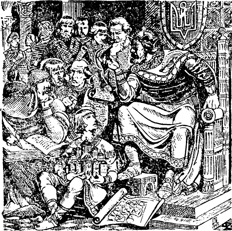
Князь Ярослав Мудрий видає закони

— І перепишемо, і перекладемо — зрадів о. Іларіон. — Великі твої заслуги, княже Юріє Ярославе, — говорить о. Іларіон. — Сама св. Софія, що ти на її честь величну церкву збудував, прославляти тебе буде по віки вічні.