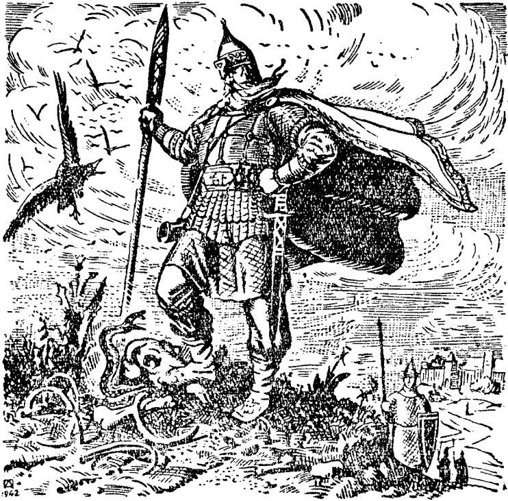
Князь Олег над черепом свого Сивого.

Кликали знахорів, не помогли. Пухлина з ноги пішла далі.