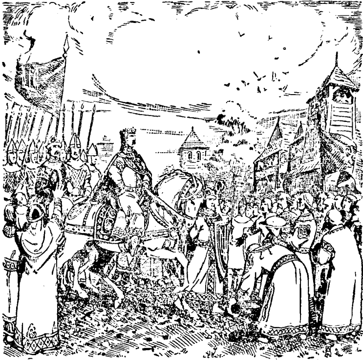
З радісним захопленням вітав Київ князя-переможця

Гей, як радісно вітали мешканці цих городів блакитні прапори з золотим Володимировим знаком і як радо приймали залози його залізних дружинників!