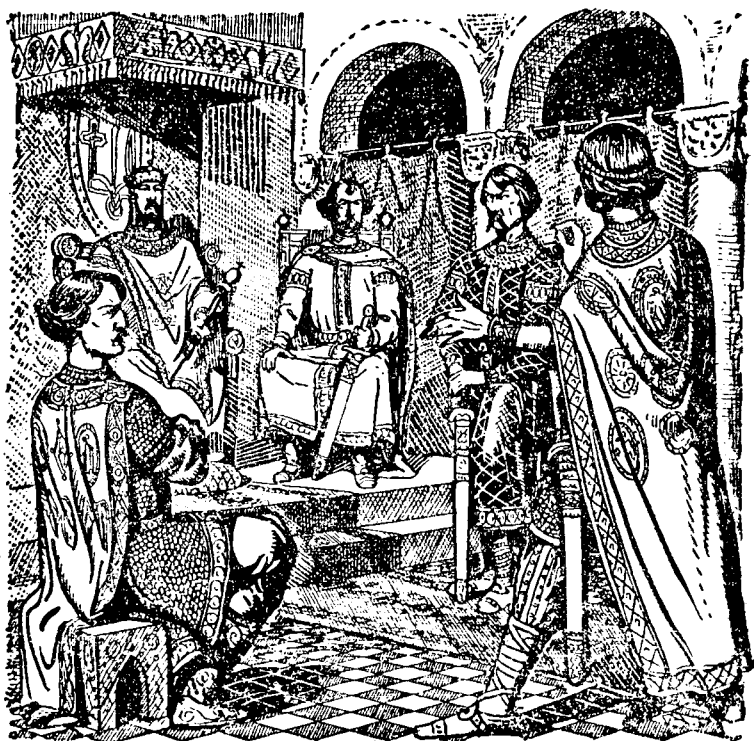
Великий князь Всеволод судить Ярополка

І осів Рюрик в Перемишлі, Володар у Звенигороді, а Василько в Тереховлі. Думали брати, що бодай якийсь час у мирі заживуть, та не довелося. Не додержав Ярополк даного слова, жаль стало йому гарної багатой Подністрияни, городів Червенських, і 1087 року рушив знову з великим військом на Ростиславичів. Насамперед пішов на Володаря, на Звенигород.