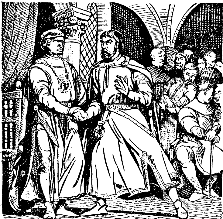
Посол князя Льва в князя Конрада Черського

— Пішли гінця до мого сина, князя Юрія, нехай приїздить якнайскоріше, маю йому важне сказати.