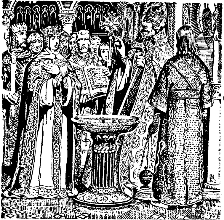
Хрищення кн. Ольги в Царгороді

І охристили Ольгу. А цар Константин був її хрестним батьком. При хрищенні дали їй імення Олена, як звалася й давня цариця, мати Константина Великого.