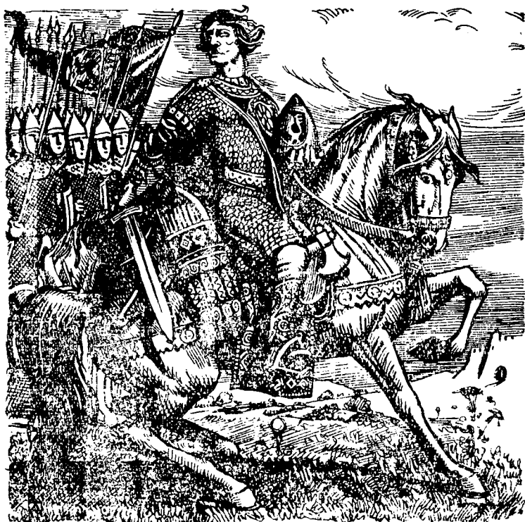
Осліплений князь Василько на чолі дружини

Та не встоятись йому проти Ростиславичів.