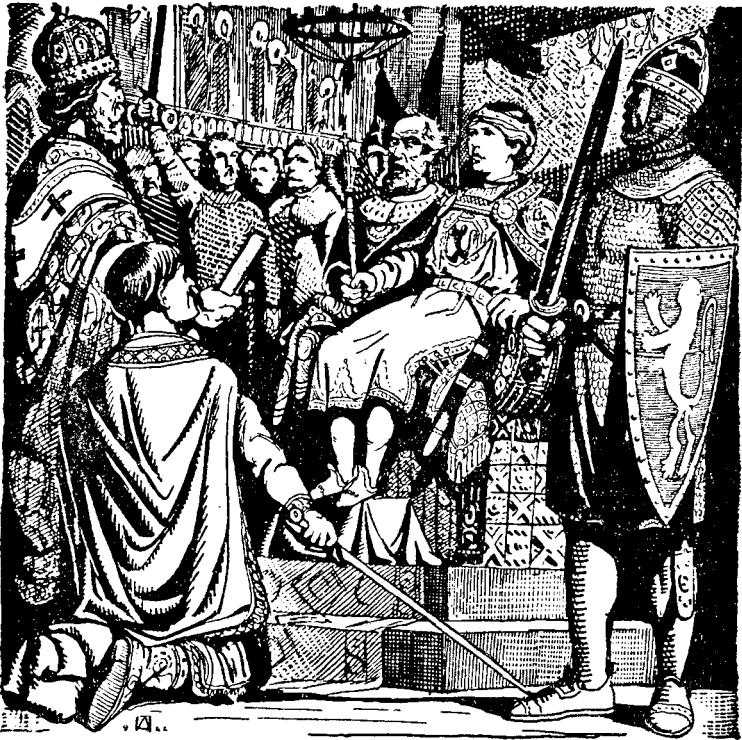
Молоденького Данилка проголошують галицьким князем

Так засів князь Данило Романович вдруге на престолі свого батька.