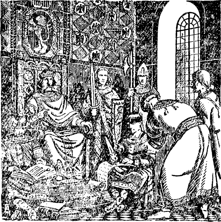
Князь Володимирко судить у судні

— Іванко Ольгович жалується на Станислава Назарича, що до нього втік його, Ольговичів, холоп 1) Борис Спнюта, а він держить його в себе, не вертає його йому, себто Іванкові Ольговичеві. — Богдан Чудинович жалується на Святополка Переніжича, що на прилюдному місці зневажив його, а Семен Чагрів жалується на Берислава Космича, смерда 2) , що підпалив йому гумно.