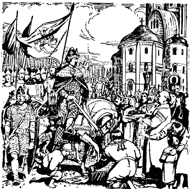
В'їзд князя Романа Мстиславича до Києва

ників половецьких, із неволі визволяє. Не щадить князь поганців так, як вони не щадили християн.