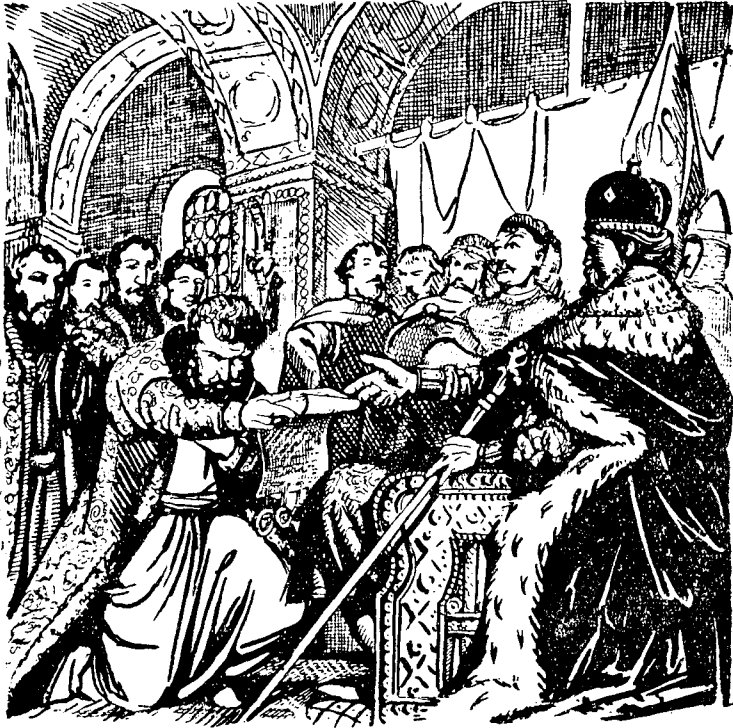
З'явилося в князя Льва дивне посольство

за віру, хочуть нас вигубити. Отже приходимо до тебе, щоб ти дозволив нам у твоїх містах, головню тут у городі Львові, поселитися.