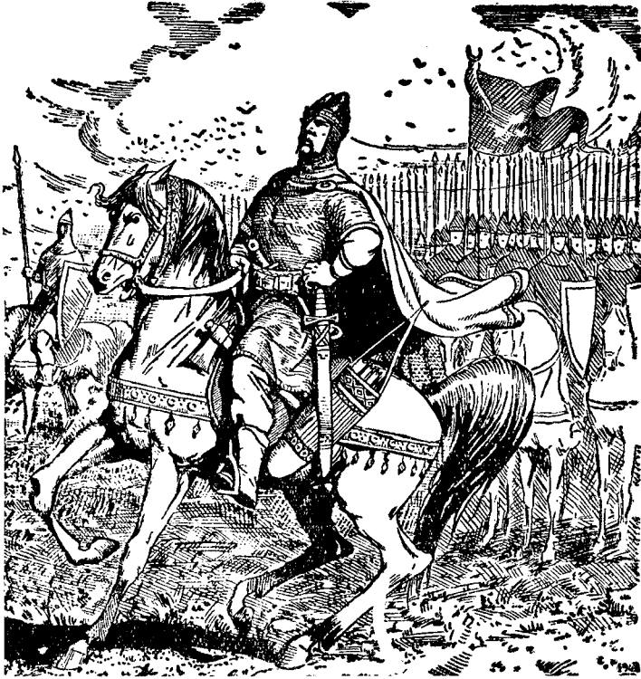
Князь Святослав вирушає на болгарів