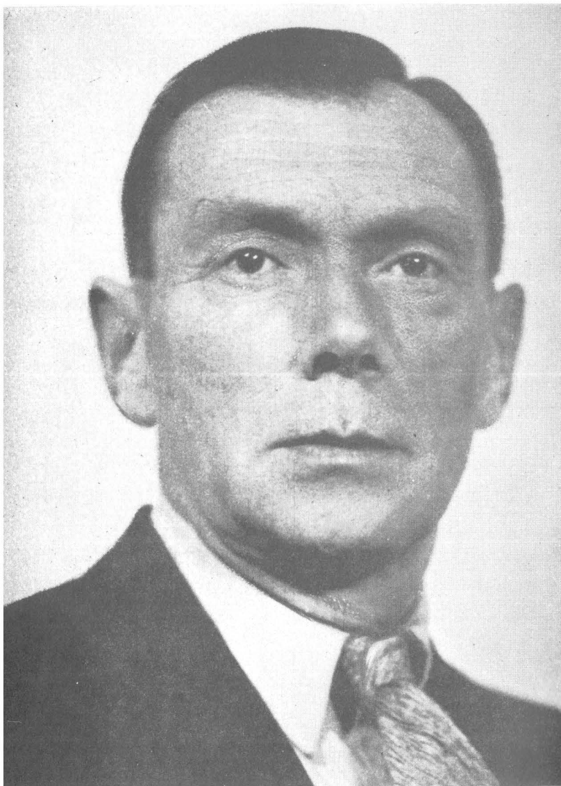
EVHEN MALANIUK (1897-1968 )