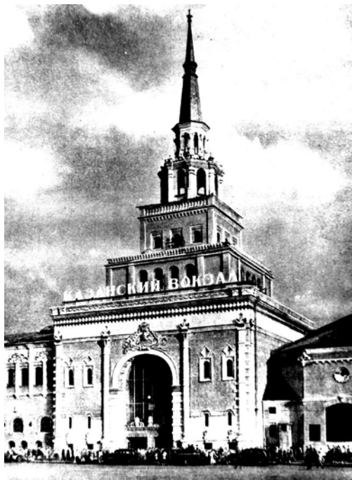
Здание Казанского вокзала.

Начало постройки Казанского вокзала относится к 1913 году. Постройка нового здания Казанского вокзала была намечена правлением Московско-Казанской железной дороги в виду расширения торговых сношений с Востоком. Московско-Казанская железная дорога осуществляла связи Москвы со Средней Азией через Казань, Урал и Сибирь. Новое здание в своем архитектурном оформлении должно было отражать эту мысль, т. е. дать как бы ворота из Москвы на Восток. Это было наиболее грандиозное по тем временам архитектурное сооружение общественного назначения. Впервые в своей практике А.В. Щусев обра-