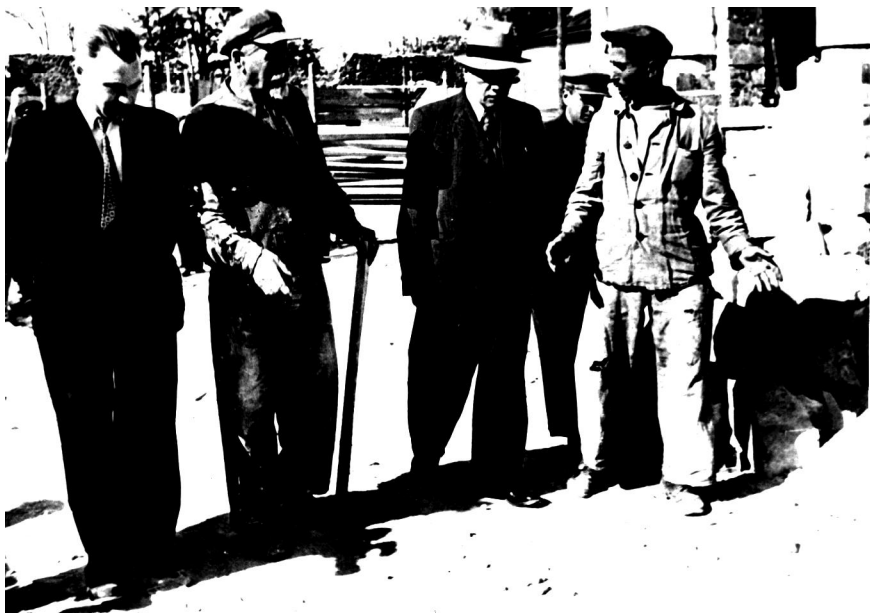
Архитектор А.В. Щусев на восстановлении Кишинева. 1947 г.

В этот же период архитектор продолжал начатую им еще задолго до войны работу по проектированию комплекса зданий для АН СССР. Под его руководством и при личном участии в мастерской Академпроекта создаются многочисленные проектные предложения, разработка которых велась на основе интерпретации классических архитектурных форм и композиций.