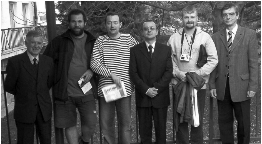
Участники конференции в Свиднике.