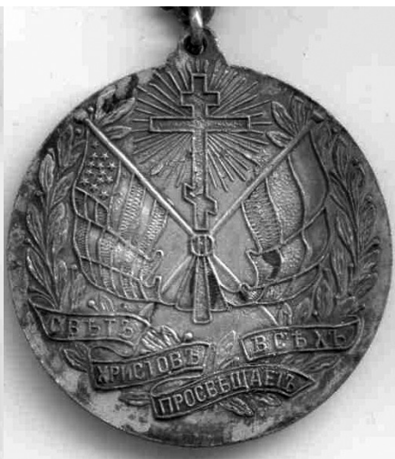
Лицевая и оборотная стороны медали.