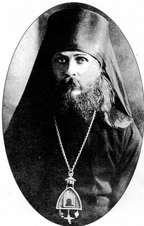
Митрополит Вениамин (Федченков). Фотография 1920 года.